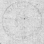
Fotokopija poslednje stranice dokumenta br. 38.

POSTAVLJENI: Generalštabu J.A., za uvid. Na izvještaje: Štabu avijacije, sv. General-pukovnik Vitruka, Štabu XVI, XXVI i XII divizije, Komandantu artiljerije i Komandantu pozadine ove armije, VI Korpusu Radiogramov; Ostalim odeljenjima izvedno.