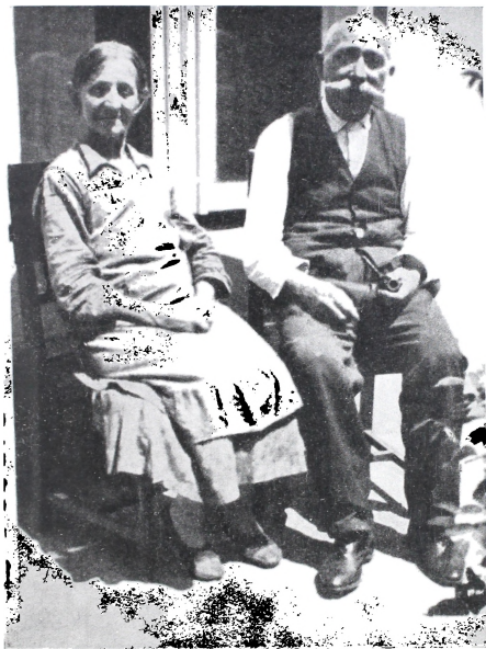
Roditelji A. Cesarca