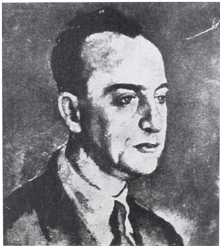
A. Cesarec (portret, Vilko Šeferov)