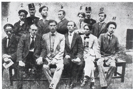
Omladinci optuženi zbog sudjelovanja u atentatu na komesara Slavka Cuvaja (1912)