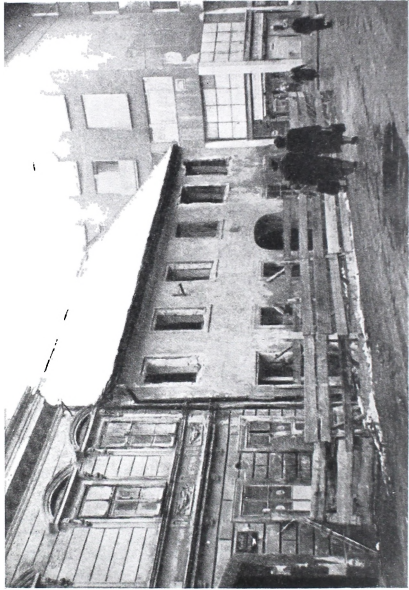
Kuća u Vlačkoj ulici 16, nedavno, 1960, srušena; u njoj je A. Cesarec proveo djetinjstvo i ranu mladost