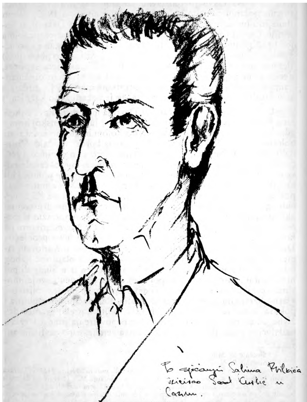
Milan Božić, prvoborac, Komandant Cazinske bune, strijeljan 6. novembra 1950. (Skica urađena po sjećanju Salima Bilkića iz Šturlića u ljeto 1991.)