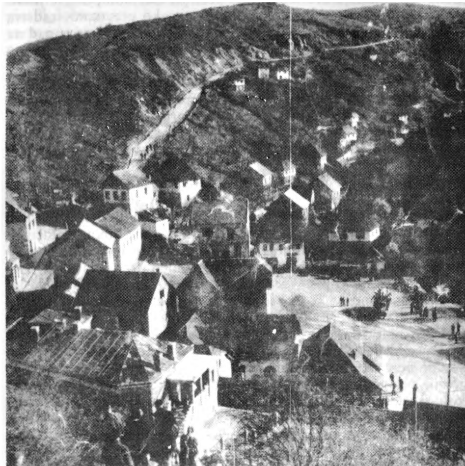
Cazin 1957. godine. Prema sjećanju starih Cazinjana grad sedam godina nakon bune nije nimalo promijenio svoj lik.