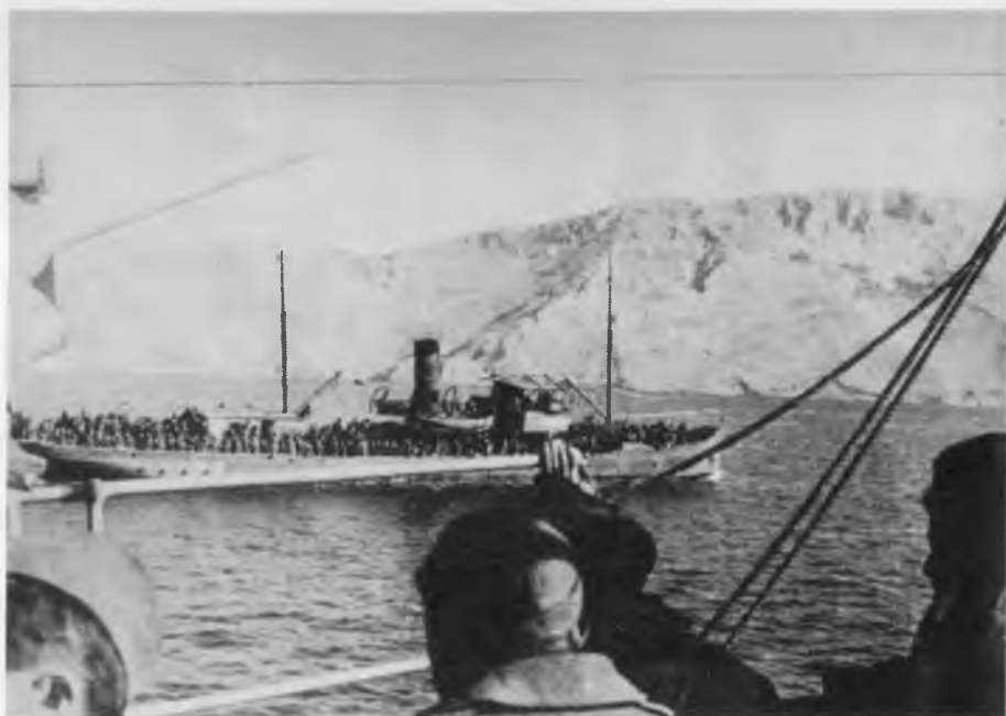
Превозење јединица 26. дивизије морем за мостарску операцију, Макарско приморје, фебруара 1945.