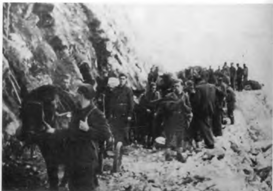
Запрежни транспорт, покрет јединица ка Мостару, фебруара 1945.