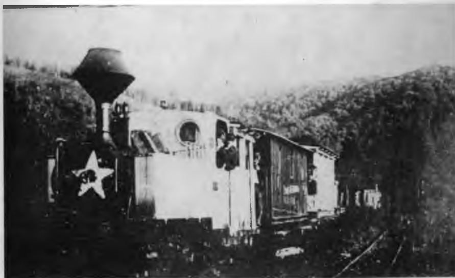
Партизански воз на Псуњу (Славонија), 1944.