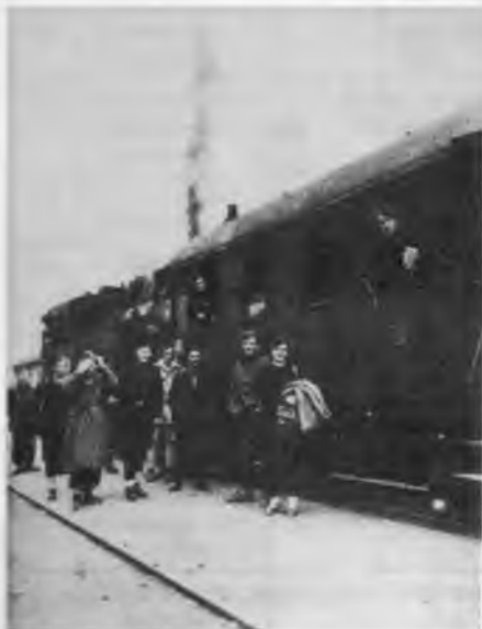
Партизански воз на прузи између станица Грмуша–Штрбачки Бук, (пруга Книн–Бихаћ), новембра 1942. (Бихаћка република).