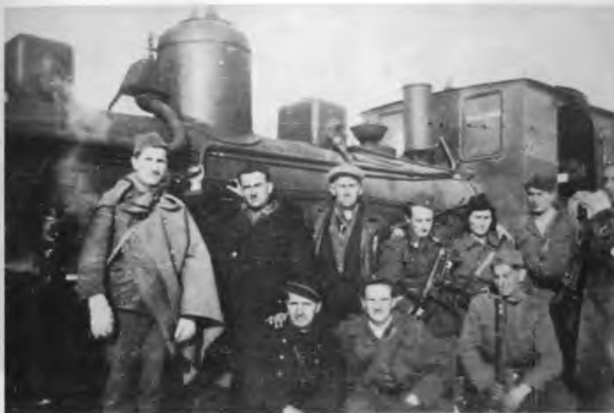
Група железничара и бораца НОВЈ на станици у Јајцу, у јесен 1943.