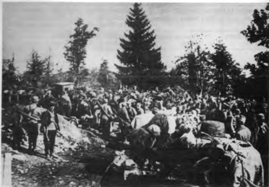
Борци 2. пролетерске бригаде укрцавају се у воз ЖНОВ код Млиништа у Босни, октобра 1942.