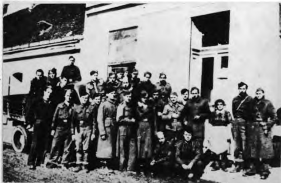
Група старешина и слушаоца курса за шофере и саобраћајну милицију у Глини 1944.