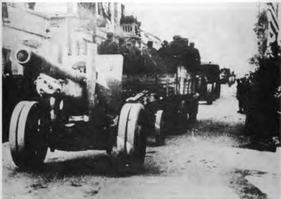
Моторизовани транспорт – артиљерија у дефилеу ослободилаца Мостара, 16. II 1945.