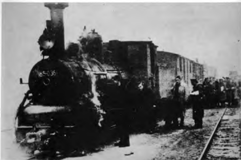
Довожење железницом делегата на друго заседање АВНОЈ-а, Јајце, новембра 1943.