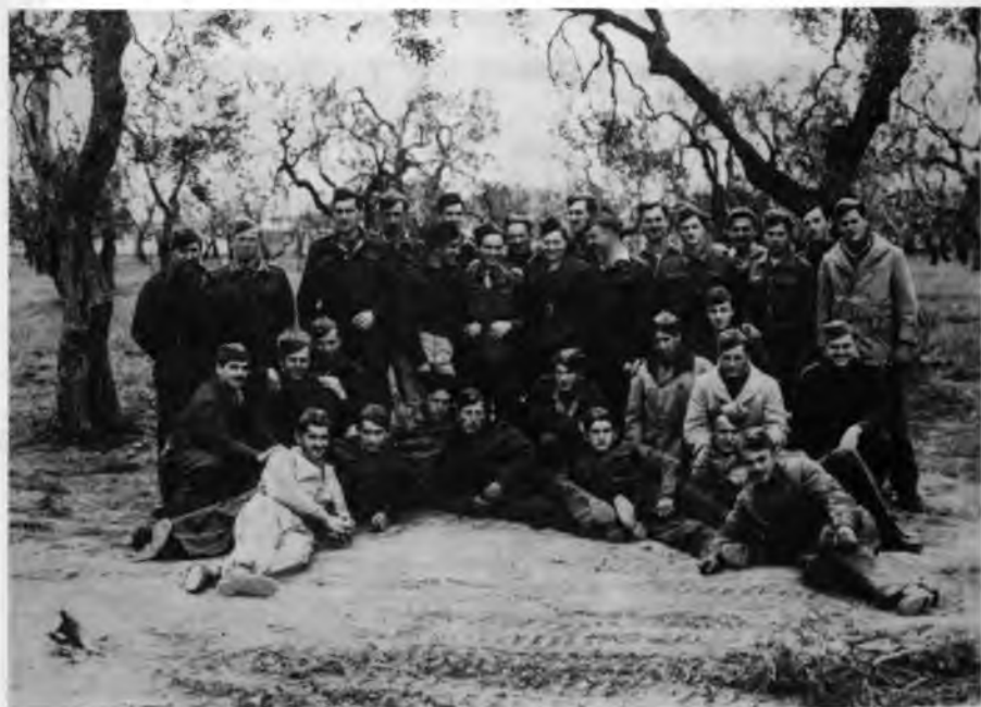
Група инструктора у Ауто школи у Гравини 1944.