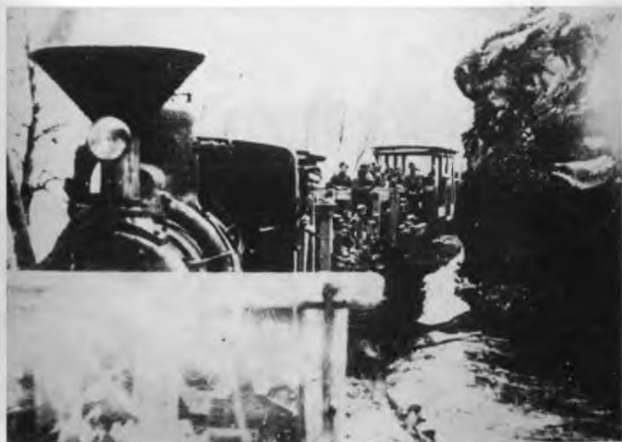
Превоз јединица партизанском железницом у Славонији у јесен 1943.