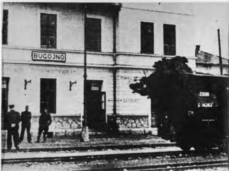
Железничка станица Бугојно, септембра 1943.