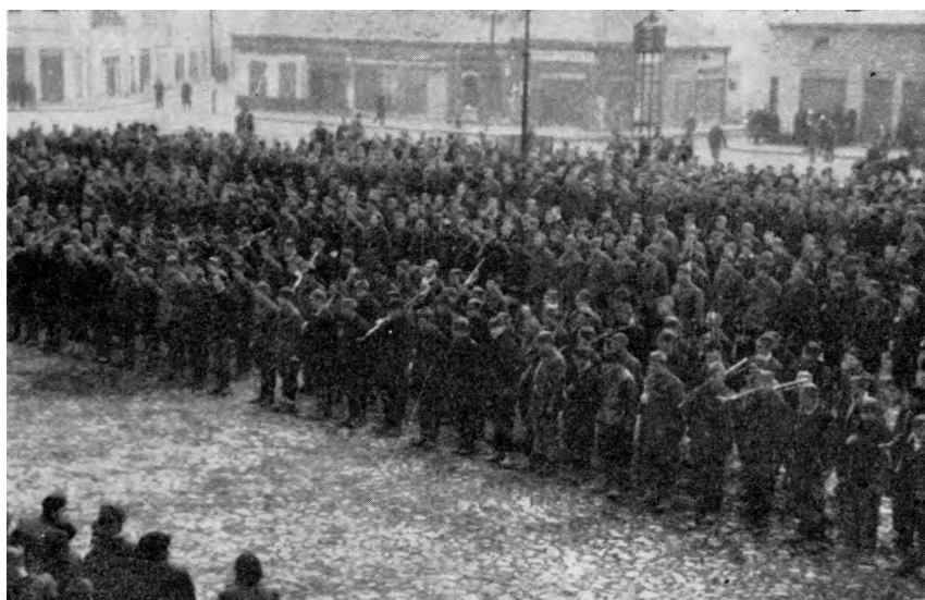
Трећа српска бригада пре дефилеа поводом уручивања одликовања борцима и старешинама бригаде, 17. децембар 1944. у Чачку