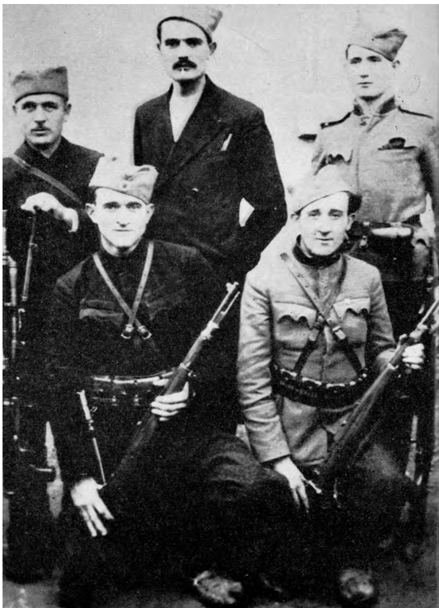
Група партизана из Јабланице 1943. године