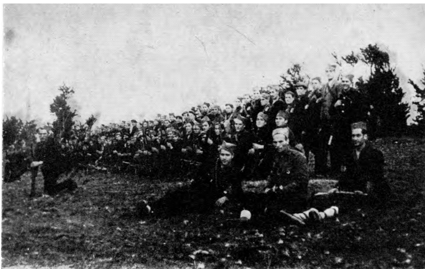
Јужнолоравски партизански одред у Србији 1943. године