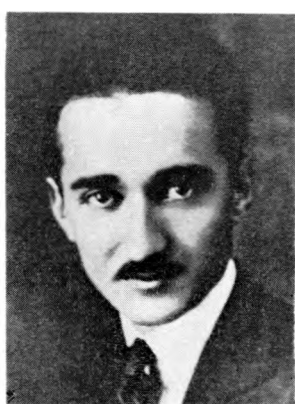
Народни херој Момчило Поповић