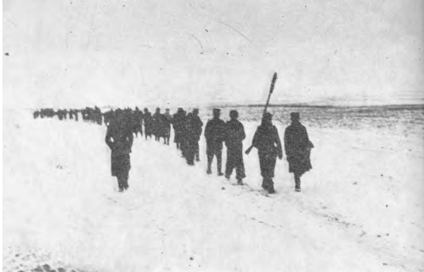
Трећа српска бригада на путу ка Србији, почетком 1944. године