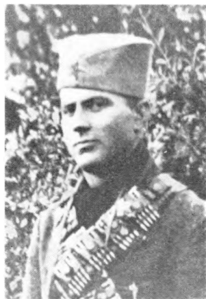
Народни херој Бождар Стојановић