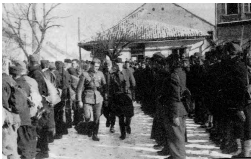
Смотра Треће српске бригаде, 6. априла 1945. године