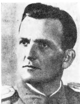
Народни херој Тома Брцуљ