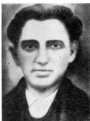
Народни херој Војислав Манојловић