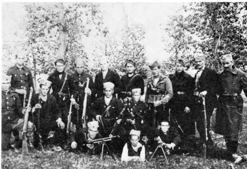
Диверзантска група Првог јужноморавског партизанског одреда 1. маја 1943. у селу Шумарцима