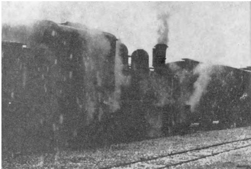
Локомотива коју су октобра 1944. године у близини Вуприје уништили борци Треће српске бригаде