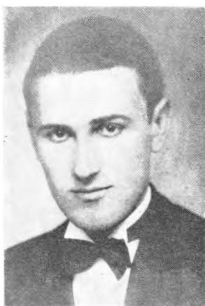
Народни херој Мирослав Јовановић