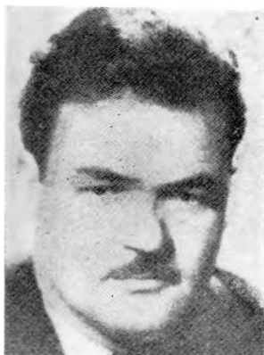
Народни херој Ратко Мандић