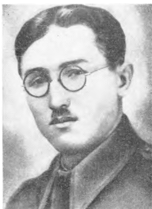
Народни херој Ратко Павловић Вићко