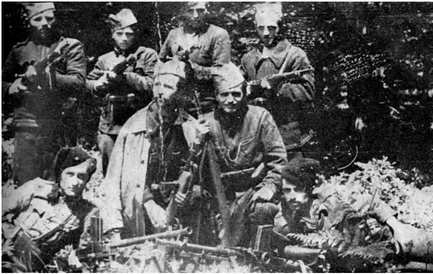
Група јужноморавских партизана на Великом Јастрецу у пролеће 1942.