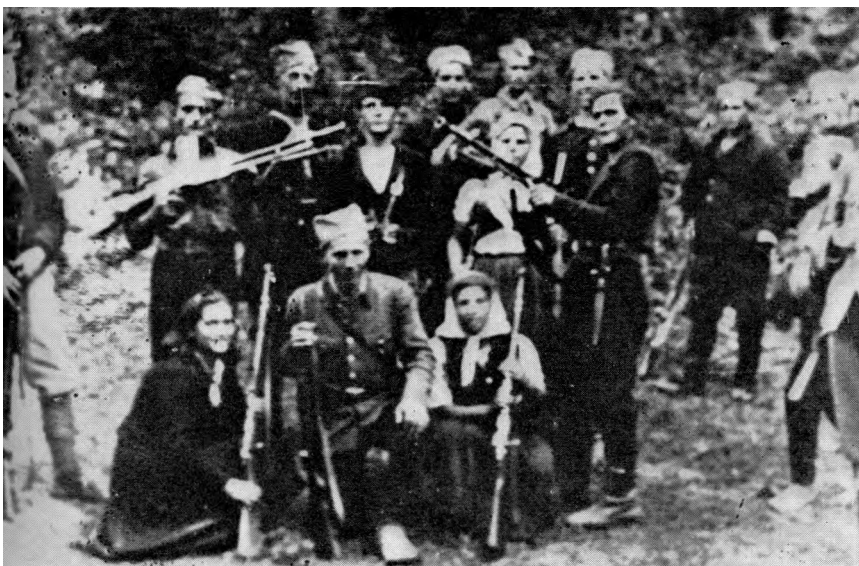
Партизани Кукавичког одреда 1943. године