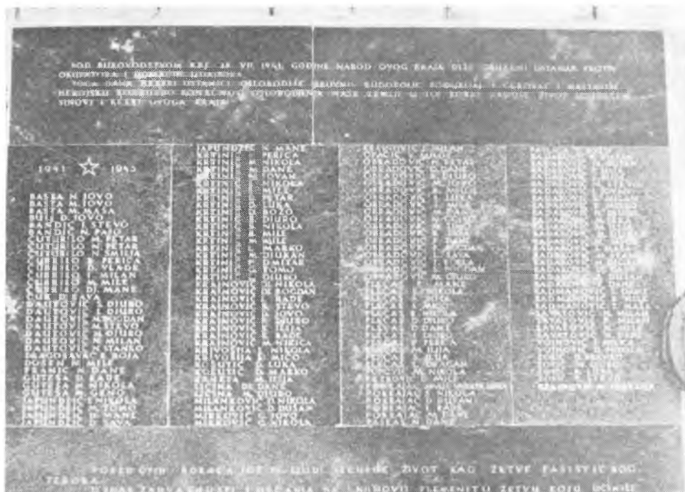
Bravno, Spomen-ploča palim borcima i žrtvama fašističkog terora na zgradi Osnovne škole.