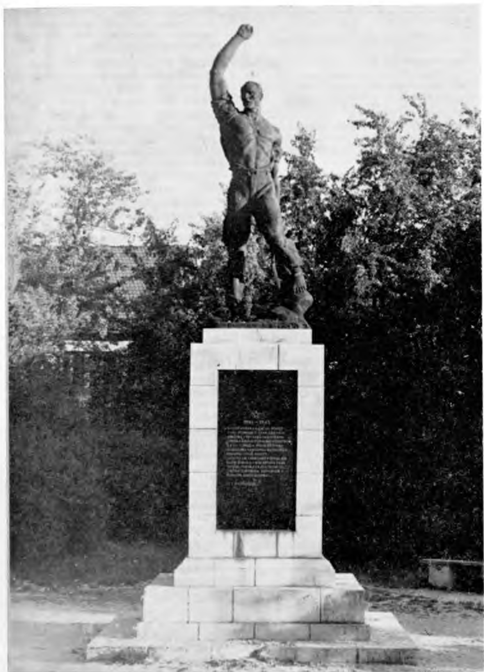
Gračac, Spomenik palih boraca i žrtava fašističkog terora.