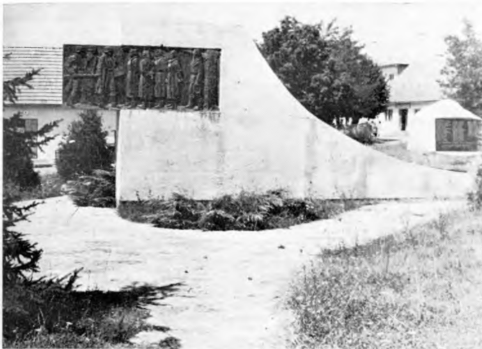
Lovinac, Spomenik palih boraca, žrtava fašističkog terora i poginulih u španjolskom građanskom ratu.