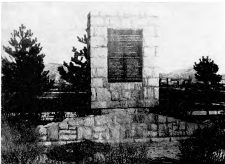
Gračac, Grobnica i spomenik narodnih heroja i istaknutih vojnih i političkih rukovodilaca.