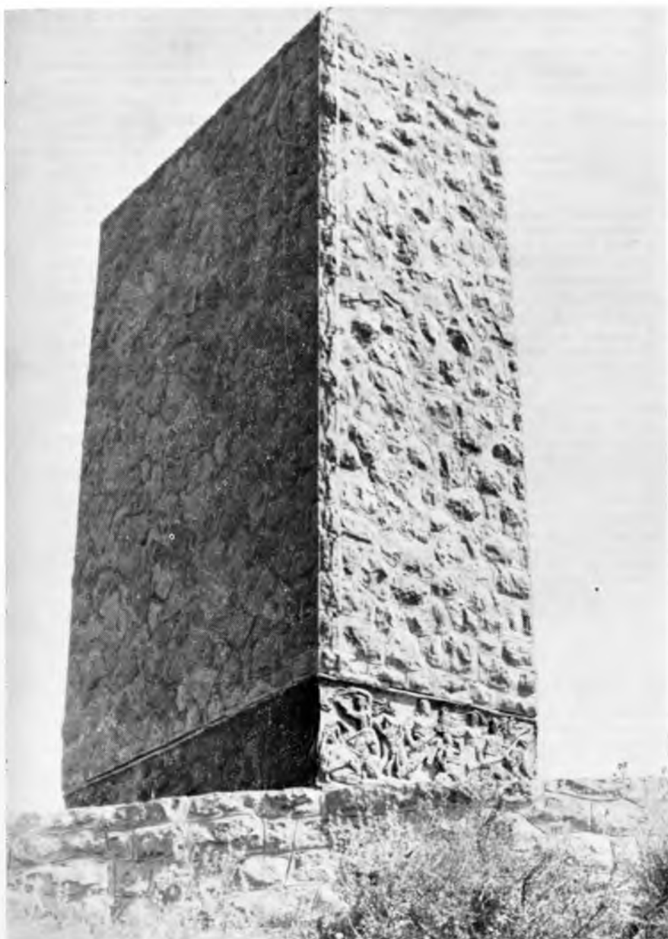
Gračac. Spomenik i grobnica palim borcima podignuti na Gradini.