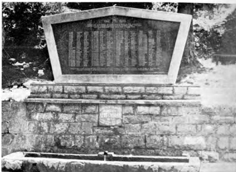
Mazin. Spomen česma palim borcima i žrtvama fašističkog terora.