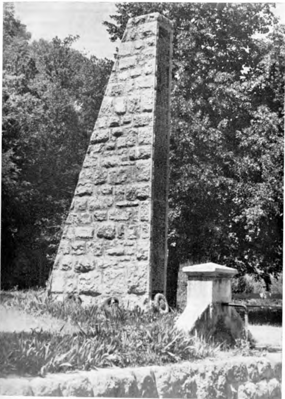
Zrmanja. Spomenik palih boraca i žrtava fašističkog terora.