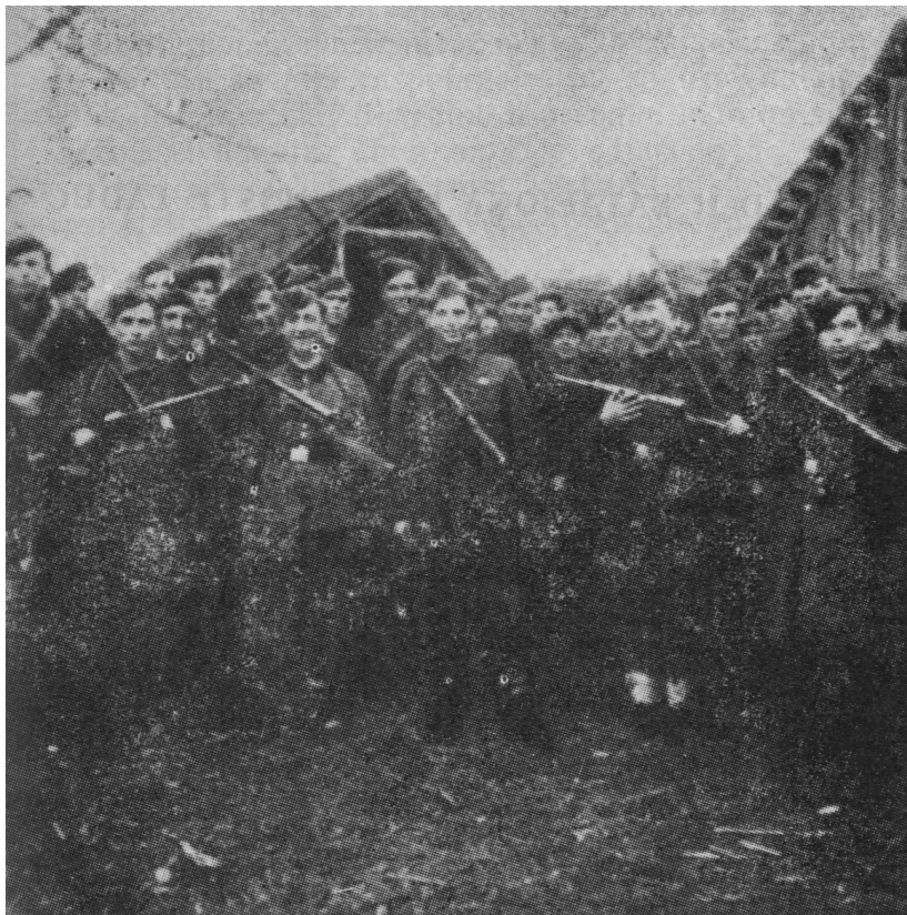
Prva četa Drugog bataljona II Zagorskog partizanskog odreda

izvana zaštititi, a s druge je strane i neprijatelj s time računao i bio više prikovan za uporišta, to tim više što su stalni pokreti naših jedinica unosili kod neprijatelja veću dozu nesigurnosti u svim njegovim uporištima.