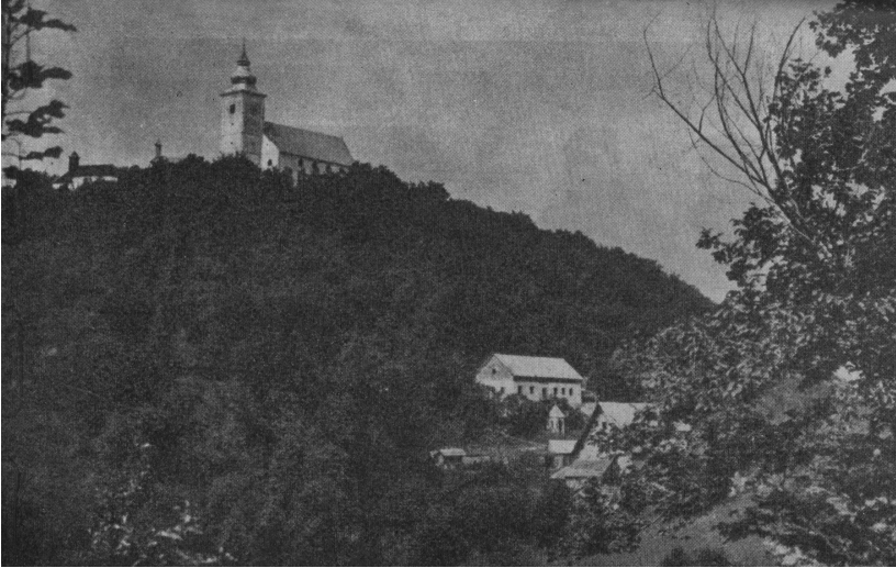
Motiv sa slovenske strane doline Sutle; Sutla je, iako ograđena žicom njemačkog III Rajha, bila uvijek premostiva za suradnju Kozjanskih i Zagorskih partizana