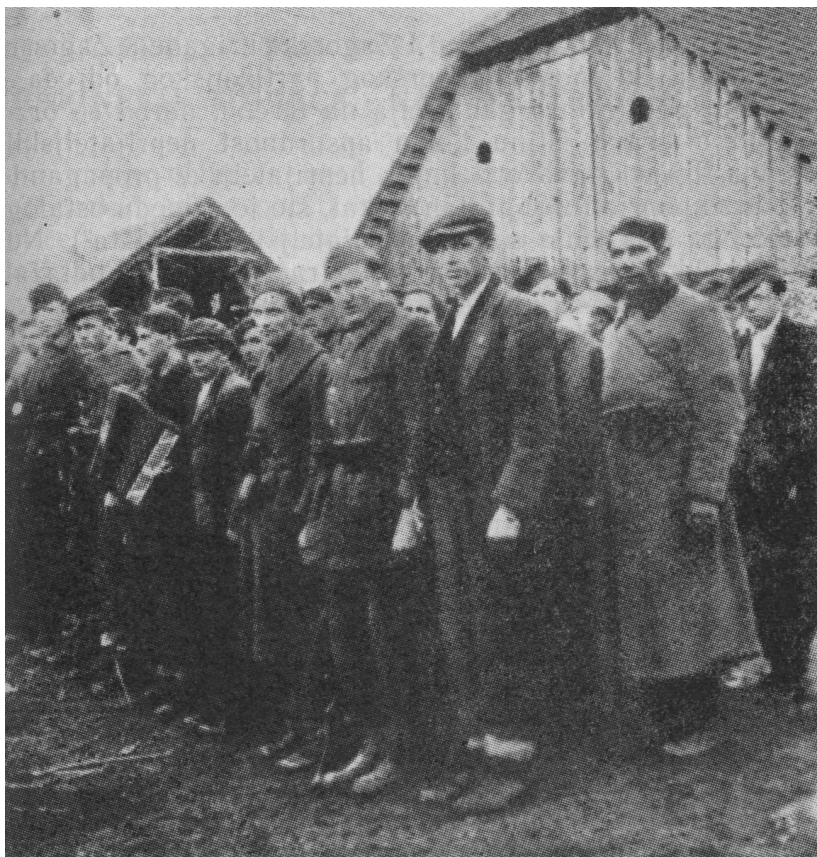
Druga četa Drugog bataljona II Zagorskog partizanskog odreda

Sutle. Bataljon Zagorskog partizanskog odreda, iako neodmoren poslije prijeđenih velikih maršruta s ranjenicima kroz Ivančicu i ponovo za Kalnik i Bilo Goru, uspješno je odolijevao napadima neprijatelja, potpuno ravnopravno s brigadnim jedinicama, na-noseći osjetne gubitke neprijatelju kojemu je u svemu bilo izbačeno iz stroja 100 ljudi, 2 tenka i 3 kamiona. U ovim borbama bataljon Zagorskog partizanskog odreda imao je 4 mrtva i 7 nestalih boraca, dok je I Zagorska imala 8 mrtvih i 8 nestalih.