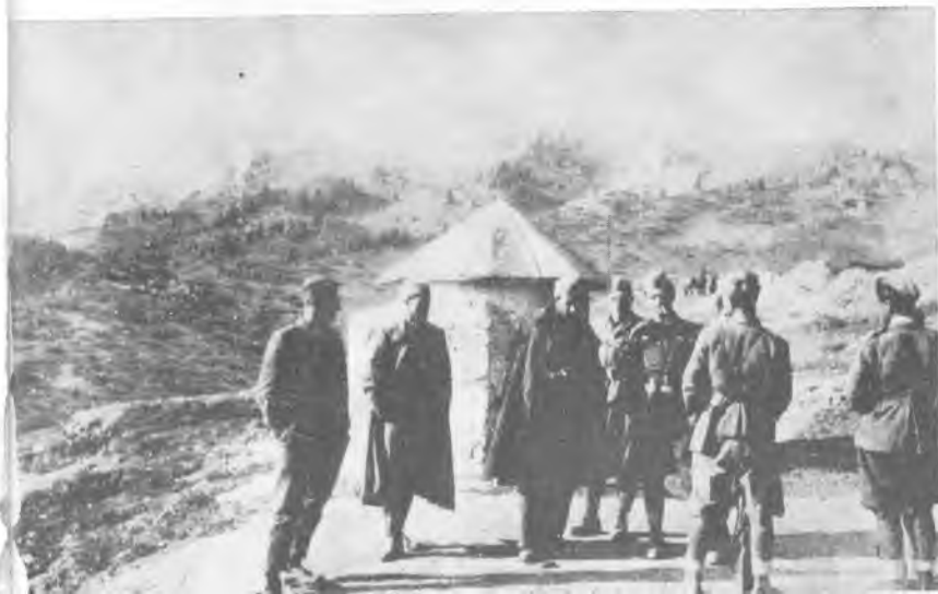
Борци Четврте крајишке бригаде на Чакору јула 1944.