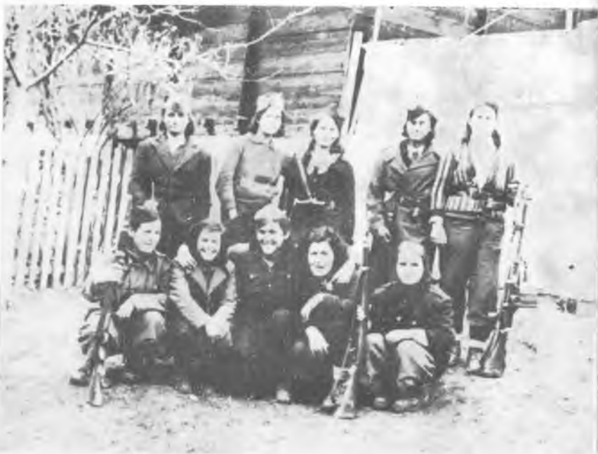
Другарице борци Четврте крајишке бригаде, 1943. године