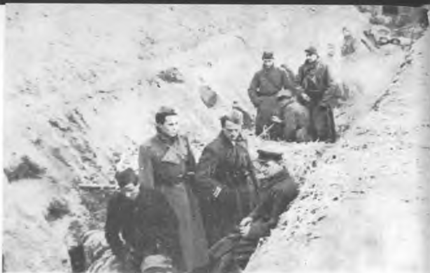
Штаб Четврте бригаде на положају Сопикт 16. децембра 1944.