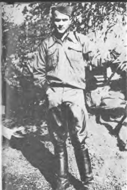
Вићука Бодрожа Вид, народни херој