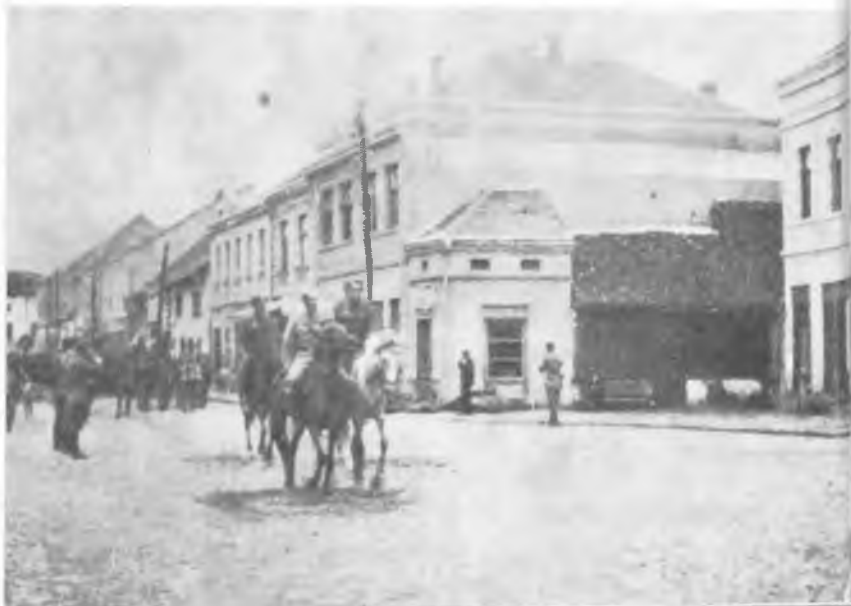
Четврта крајишка бригада у Ивањици 11. септембра 1944. на дан прославе двогодишњице формирања бригаде