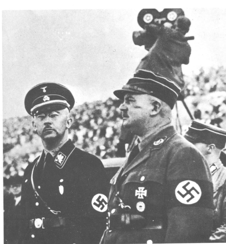
Dva nacisti ka suparnika: Himmler (slijeva), vo a SS-a i Roehm, vo a SA, rame uz rame 1933. godine.