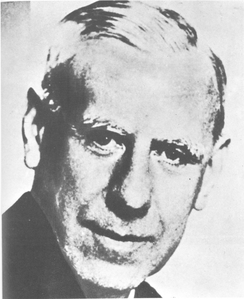
»Stari lisac«, veliki protivnik Gestapoa, antinacisti ki admiral Wilhelm Cänaris, šef vojne obavještajne službe, Abwehra.