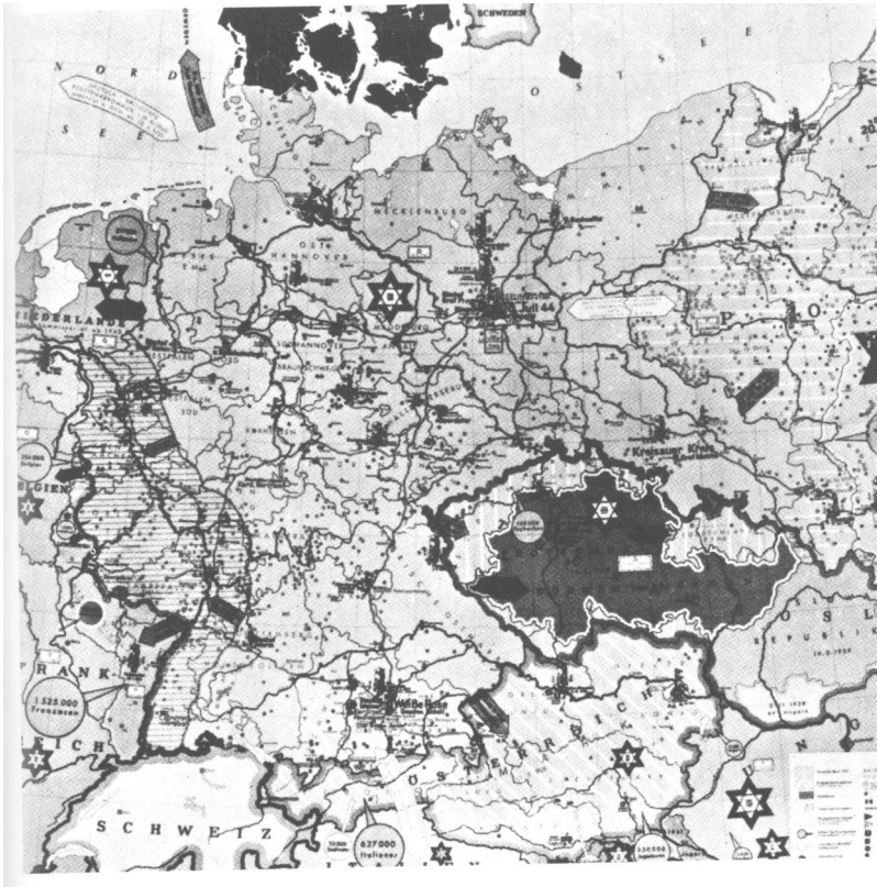
Carstvo Gestapoa u okupiranoj Evropi. Na karti je prikazan razmještaj koncentracionih logora i sjedišta nacističke policije.