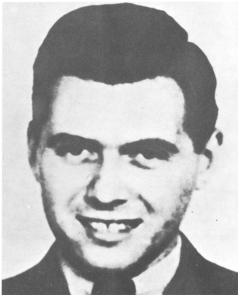
Mengele, lije nik-»eksperimentator« u Auschwitzu. Ova fotografija iz mladosti snimljena je u doba kad je istodobno doktorirao medicinu (u Frankfurtu) i filozofiju (u Miinchenu).