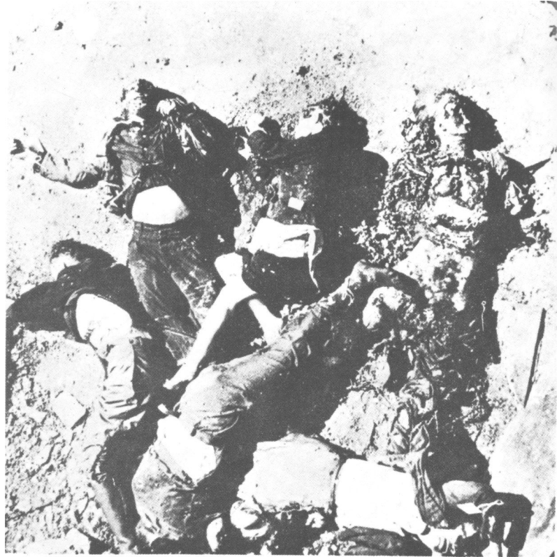
Tijela pripadnika pokreta otpora nad kojima je izvršena smrtna kazna.