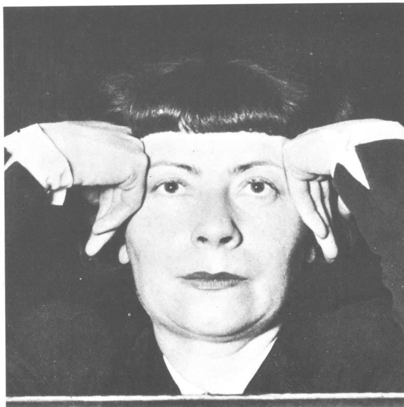
Mnogostruki tajni agent, pripadnica Intelligence Servicea, Sicherheitsdiensta SS-a i pokreta otpora — Mathilde Carré »La Chatte« za vrijeme su enja nakon oslobo enja.