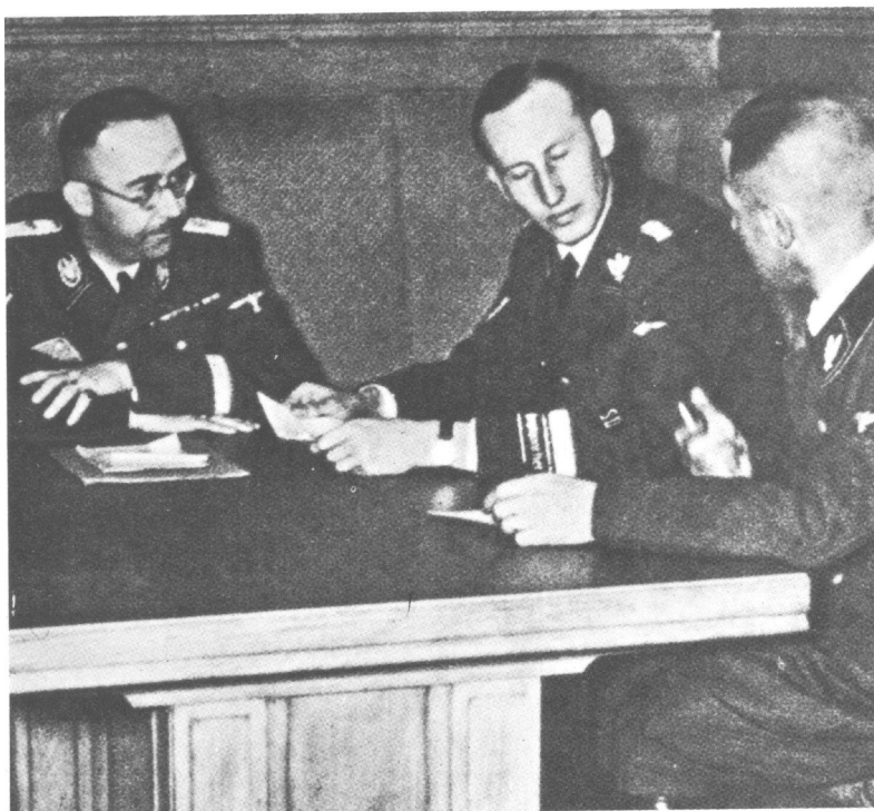
Veliki vo e RSHA za radnim stolom. Slijeva nadesno: Heinrich Himmler, Reinhard Hevdrich i Heinrich Müller.