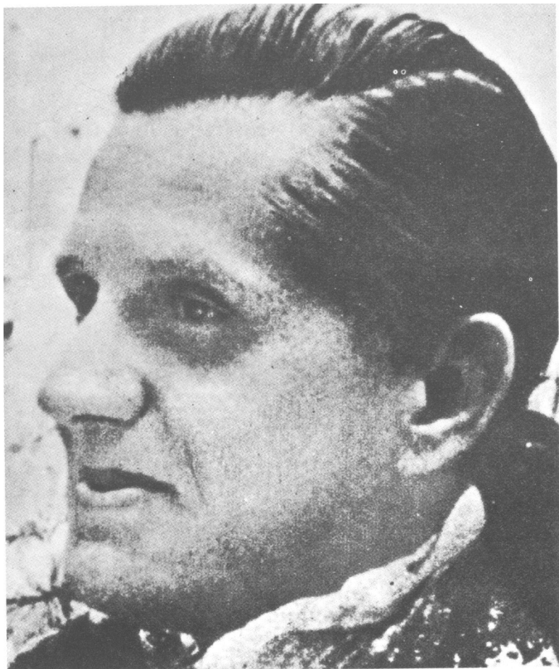
Walter Schellenberg, vođa SD-a za inozemstvo, koji je 1944. godine uhapsiti Canarisa.