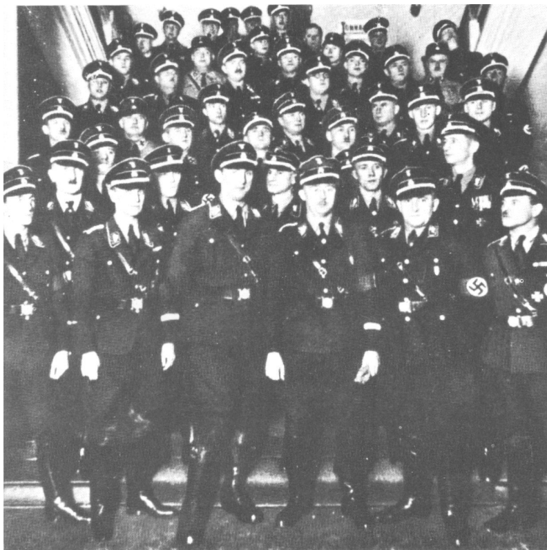
Himmlerova »obiteljska fotografija« SS-a iz 1932. godine, prije dolaska na vlast. U prvom redu prepoznaje se vođa u SS-a Himmler sa spuštenih ruku. Njemu zdesna je golemi Kurt Daluege. U trećem redu drugi zdesna je mladi Reinhard Heydrich kome je upravo povjeren zadatak da organizira službu sigurnosti SS-a.