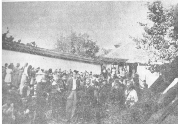
U selu Rahiću kod Brčkog, partizansko pozorište Vojvodanske divizije daje priredbu

Devetnaestog septembra XVI divizija krenula je u pravcu Krupnja, gde se nalazilo oko 3.000, a na širem prostoru još oko 1000—1500 četnika. Šesnaestoj divi- ziji je dato naređenje da razbije te četnike koji su se