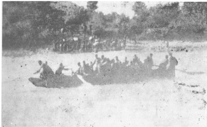
Prelaz boraca / vojvođanske brigade u Srem 1943.

tu prvi put susreli sa novim vrstama neprijatelja — četnicima i zelenim kadrom. O četnicima se u Sremu ponešto moglo i čuti, naročito u vreme ustanka u Mačvi. Tada su mnogi Sremci prelazili Savu i uzimali učešća u borbama u Srbiji. Međutim, o zelenom kadru su Sremci bili slabo obavješteni. O tome su Sremci znali iz prvog svetskog rata. Bili su to njihovi očevi i rođaci koji su, bežeći iz austrougarske vojske, sa oružjem odlazili u šume da bi se borili protiv onih koji su ih slali na svetsku klanicu za interese kapitalista i bogataša. Ali, zeleni kadar je u drugom svetskom ratu u Bosni imao sasvim drugi karakter i druge ciljeve. Bila je to mahom, muslimanska sirotinja kojoj je okupator obećavao parče hleba da bi je koristio u borbi protiv partizana a pod izgovorom da »e bore protiv četnika.