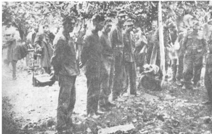
Zarobljeni Nettici kod sela Skele 1944.

Nebo je bilo vedro, osuto zvezdama, a nad gradom već užareno. U gradu su grmele eksplozije. Kao da grad goni, tako je izgledalo.