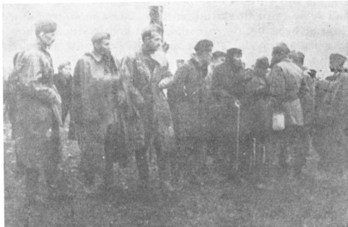
Članovi Štaba III korpusa i Štaba XVI vojvodanske divizije.

Činjenica da je brigadu napustio i vratio se u Srem 21 borac poslužila je kao povod da se održi smotra. Učinili smo to pre nego što smo stigli u Birač. Postrojena po lepom sunčanom danu na jednom proplanku, sa vojnicima rumenih obraza, dobro odevenim i naoružanim, brigada je pružala impresivnu sliku. Sa novim dobrovoljcima sada je brojala oko 1.350 boraca. Na smotri