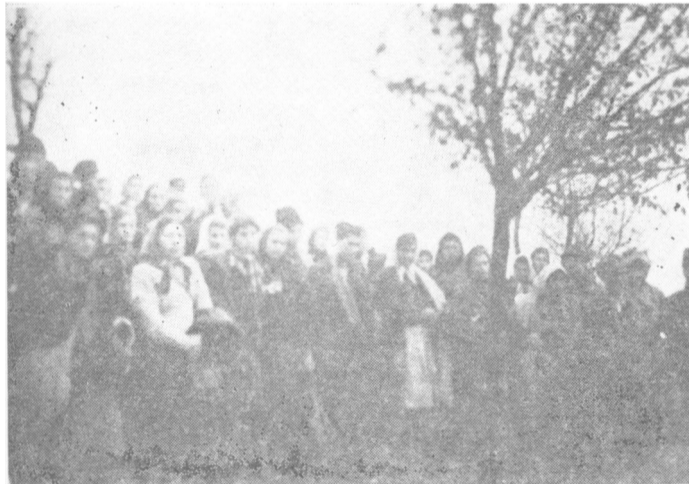
Grupa mladića i devojaka iz Srema 1943. koji su došli u vojvođanske brigade u istočnu Bosnu

Da je srećnijim sticajem okolnosti Vrhovni štab bio bliže Sremu, izvesno je da bi mnogo ranije, još u 1942. godini, bila formirana 1. vojvođanska brigada. Uostalom, na partijskom savetovanju u Sasama decembra 1942. godine zaključeno je da se hitno traži odobrenje Vrhovnog štaba za formiranje 1. brigade. Razlog je njeno formiranje tek u aprilu 1943. godine treba tražiti u sticaju okolnosti što je Vrhovni štab bio udaljen od Srema.