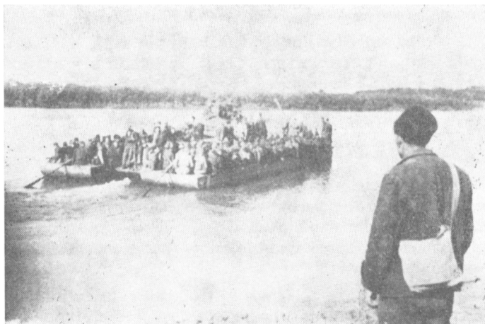
Borci XVI vojvođanske divizije prelaze Savu kod Skele oktobra 1944.

Posmatrajući borce posle oslobođenja Bijeljine, sefio sam se jedne Lenjinove misli o oružanom ustanku — da svakog dana treba postići neki uspeh, makar i mali. Uspehi, naime, hrabre ljude, podižu im borbeni duh i moral. Tako je bilo tih dana i u Bijeljini. U prepričavanju događaja iz borbe za oslobođenje grada bilo je verovatno i mladalačkog preterivanja.