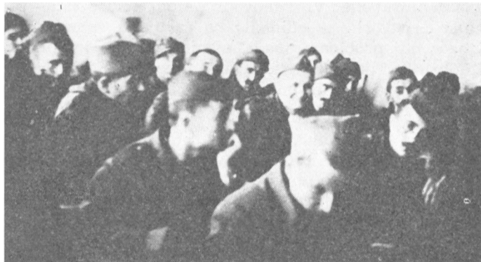
Okto-bar 1943. na Muslimanskoj Maoči, partijsko savetovanje IV bataljona I vojvodanske brigade

Putujući ka Prvoj vojvodanskoj prigadi, koja se u to vreme tukla oko Zvornika, imao sam vremena da razmišljam o svemu tome. Pošto je prema Zvorniku išla veća grupa drugova iz Vrhovnog štaba, želeo sam da pronađem nekoga ko više zna o Sremcima, da razmenim mišljenje o borbenom moralu vojvodanskih jedi-