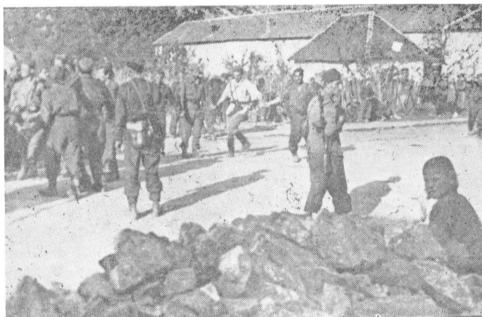
U oslobođenom Krupju 1944. Borci IV vojvođanske brigade razdragano igraju kolo. Kolo vodi komandant XVI divizije Kamenjar

Posle obračuna sa četnicima na Majeveci, približila Prva vojvođanska brigada Bijeljini, najvećem gradu u Semberiji, bogatoj i plodnoj ravnici u istočnoj Bosni. Oslobođenje Bijeljine bilo bi za naš pokret od izvanrednog značaja iz više razloga. Time bi se obezbedila neposrednija veza sa Sremom i Mačvom, a bio bi to i prvorazredan politički i vojni uspeh partizanskih jedinica, što bi moglo imati uticaja na dalji razmah ustanaka u ovom delu Bosne. Naime, u Bijeljini je bio veoma razvijen ilegalni antifašistički pokret sa velikim brojem naših simpatizera. Oni bi masovno pošli u par-