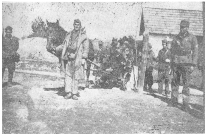
Jedinice XVI divizije u pokretu za napad na Brčko

— To je brigada koja je stasala među naše najbolje brigade u zemlji. O tome treba pisati i PK KPJ za Vojvodinu. Na primeru Prve brigade treba vaspitavati naše ostale brigade i odrede u Sremu.