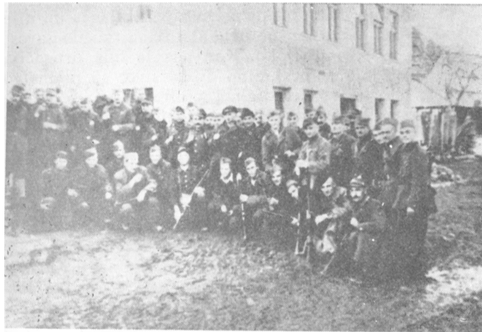
Partijski aktiv 1 vojvodanske brigade posle jednog održanog sastanka

Posle upoznavanja, grljenja i ljubljenja, komandant divizije, kao domaćin, pozvao nas je za sto. Trpe-