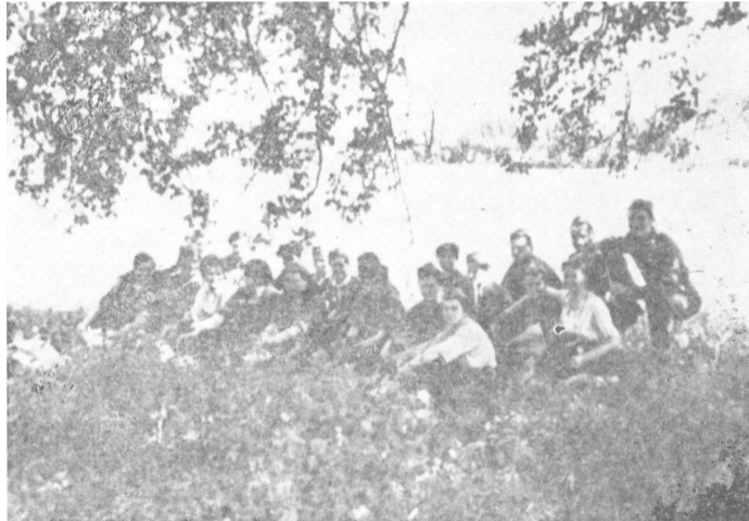
Kurs referenata saniteta XVI vojvodanske divizije

U tim selima naše jedinice su ostavile pet ranjenika sa 32 borca obezbeđenja. Pošto su bili iz tih sela i poznavali dobro teren, zelenokadrovci su iskoristili mrak, povratili se i napali ranjenike. Tom prilikom su ovi strvinari ubili četvoricu ranjenika. Poginuo je i jedan borac iz obezbeđenja ranjenika, a šest ih je ranjeno. Čim su naše jedinice obavestene o divljanju zelenokadrovaca, odmah su se vratile rešene da unište ova