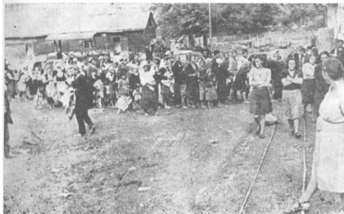
Narod u oslobođenoj Bijeljini avgusta 1943. dočekuje partizanski voz iz Ugljevika u Bijeljini

naestoj vojvodanskoj diviziji jedino se njen komandant, Danilo Lekić, bavio i vojnom teorijom u toku celog rata. On je imao veoma široko opšte obrazovanje i mnogo iskustva iz Spanije i svih ofanziva sa tla Jugoslavije. To je bilo dragoceno i za rukovođenje, a i za organizovanje sistema vojnog obrazovanja u vojvodanskim jedinicama. Gotovo svi načelnici štabova u vojvodanskim brigadama imali su završene vojne škole predratne jugoslovenske vojske. Iako su pravila partizanskog ratovanja bila i za njih nova i nepoznata, usvojivši liniju narodno-oslobodilačkog rata, mnogi od njih su vremenom postali vrsni rukovodioci jedinica NOVJ.