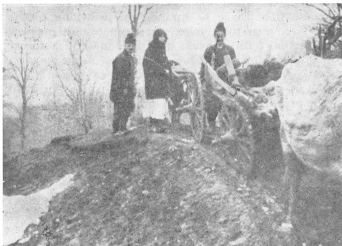
Prevoženje ranjenika na putu za Beograd 1944.

Kad smo završili operaciju čišćenja Trebave, dobili smo naređenje od komandanta naše divizije, druga Lekića, koji se sa delom štaba nalazio preko ceste Tuzla—Zvornik, da se prebacimo na prostor Vukosavci—Lebucka—Tobut, gde bi se prikupila cela divizija. Usput je trebalo preći planinu Trebavu, koja je inače bila gnezno četničkog vojvode popa Božića sve do razbijanja njegovih jedinica. Četnici popa Božića na-