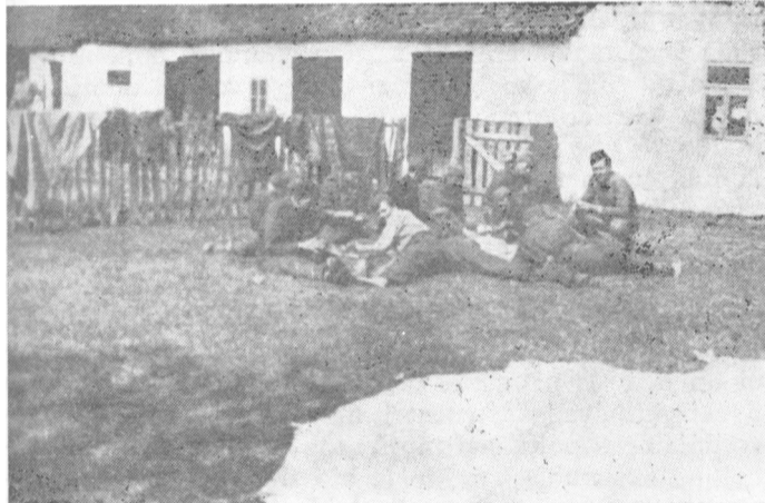
Kuriri Divizije na predahu i odmoru

Takve su bile ocene iskusne obaveštajne službe nemačke sile, koja je i sama spoznala veliku snagu KPJ u partizanskim jedinicama i povezanost boraca i pozadine koju je Partija razvijala. Zadatak Partije je bio da kao unutarnja snaga obezbedi neprekidni uticaj na rad