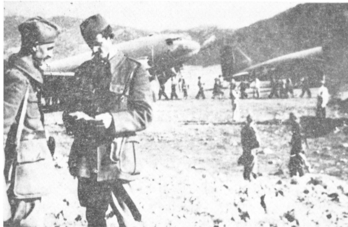
Evakuacija ranjenika XVI divizije za Italiju iz sela Donja Brezna u Crnoj Gori

umrlo od gladi na tom putu, kvalifikovali smo kao dezerterstvo. Bilo je i takvih, čak i među političkim rukovodiocima divizije, koji su nestanak grupe boraca ili pojedinaca nazivali izdajom, izveštavajući i Vrhovni štab o njihovom navodnom priključivanju četnicima, nazivajući ih petokolonašima. Danas je međutim, sasvim jasno i čini se nije ni potrebno mnogo dokazivati da se ni u jednom dokumentu NOB-a niti u jednom arhivu može naći ime i jednog vojvođanskog borca koj* je prešao na stranu četnika u toku narodnooslobodilačke borbe.