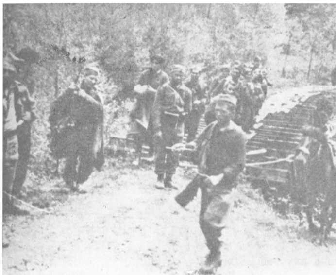
Diverzanti XVI vojvodanske divizije ruše prugu u dolini Krivaje, juni 1944.

Iona koja treba da preseče obezbedeni prelaz. Nije bilo drugog rešenja do da I vojvodanska brigada krene u opšti napad, a da se zamenik komandanta divizije Radosav Jović sa jednim bataljonom II brigade svom silinom sjuri na cestu i razbije neprijateljsku kolonu. I brigada je razbila neprijatelja. Zapjenila je četiri brdska topa, radio-stanicu, 40 konja, dosta municije, dok je Jovićevo bataljon zaplenio neprijateljsku komoru i dve