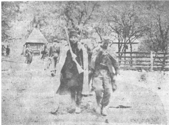
Istočna Bosna 1943/44, prenos ranjenika

bombaša, mitraljezaca, mladih ljudi koji se dobrovoljno javljaju za izvršenje opasnih zadataka. Veliki je broj njih koje bismo već sad mogli primiti u Partiju. U našoj jedinici poseban je problem bolesnih i ranjenih drugova. On je nešto oštrije nego u drugim jedinicama, jer su naši borci iz krajeva koji nisu navikli na glad i druge materijalne teškoće kao ovi ljudi ovde. Zbog toga se javlja težnja za povratkom u Srem, gde ima bar da se dobro jede. Sad, kad se vratimo u Srem, učinimo sve da vam pomognemo. Jedan od glavnih zadataka Glavnog štaba za Vojvodinu biće da vam uputimo što više hrane, odeće i obuće.