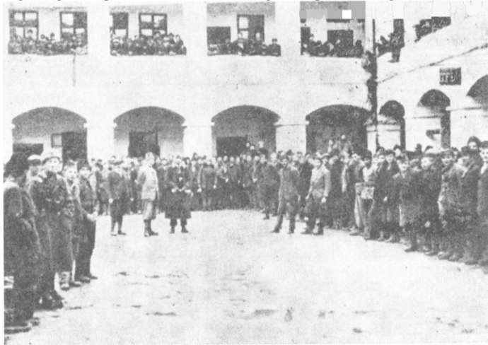
Formiranje jedinica Petefi brigade 1944. u Somborn

Prema zamisli štaba divizije, sa bosanske strane trebalo je da napadaju Prva i Treća vojvodanska brigada i Majevički odred. Sa sremske strane, napad na neprijateljsku posadu u selu Gunji i sprečavanje interven-