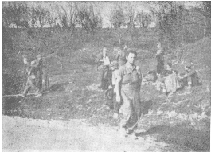
Deo saniteta I vojvodanske brigade 1943.