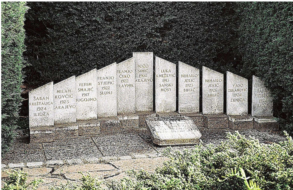
Spomenik padlim osvoboditeljem Brežic iz leta 1945 na mestnem pokopališču v Brežicah. Foto: Tomaž Teropšič, 23. september 2013.

Nemške bojne enote so od 11. do 14. aprila 1944 zasedle vse večje kraje v Posavju, še pred tem pa je 6. aprila, navsezgodaj, nemško vojno letalstvo bombardiralo jugoslovansko vojaško letališče v Cerkljah. Takoj so začeli izvajati svoj načrt - želeli so uničiti slovenski narod kot etnično enoto. Iz Brežic in okolice so izgnali 17.259 ljudi, v izpraznjene slovenske domove pa naselili predvsem kočevske Nemce. 28. oktobra 1941 so ustanovili Brežiško partizansko četo z nalogo preprečitve nasilnega izganjanja Slovencev iz domačih krajev. Leta 1943 so ustanovili Kozjanski bataljon, aprila 1944 pa Kozjanski odred za oborožen boj proti osovraženem okupatorju.