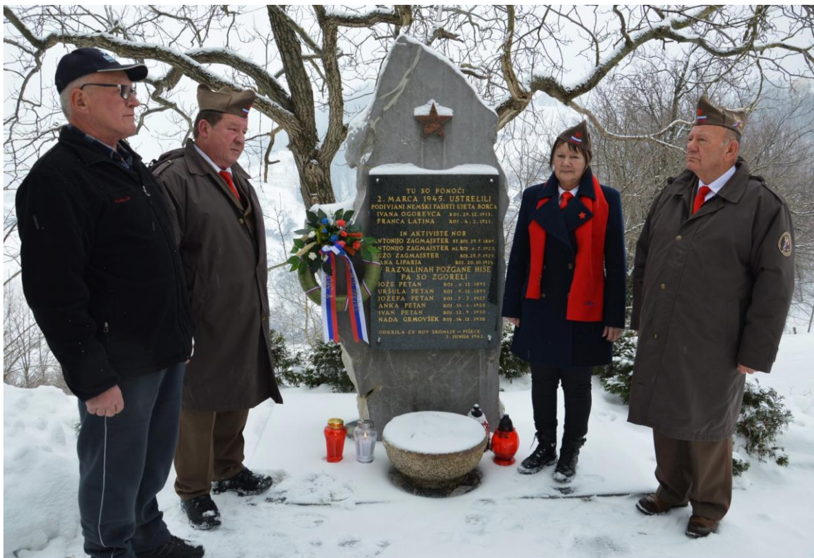
Delegacija zveze borcev iz Brežic pri spomeniku. Lastine, 2018.