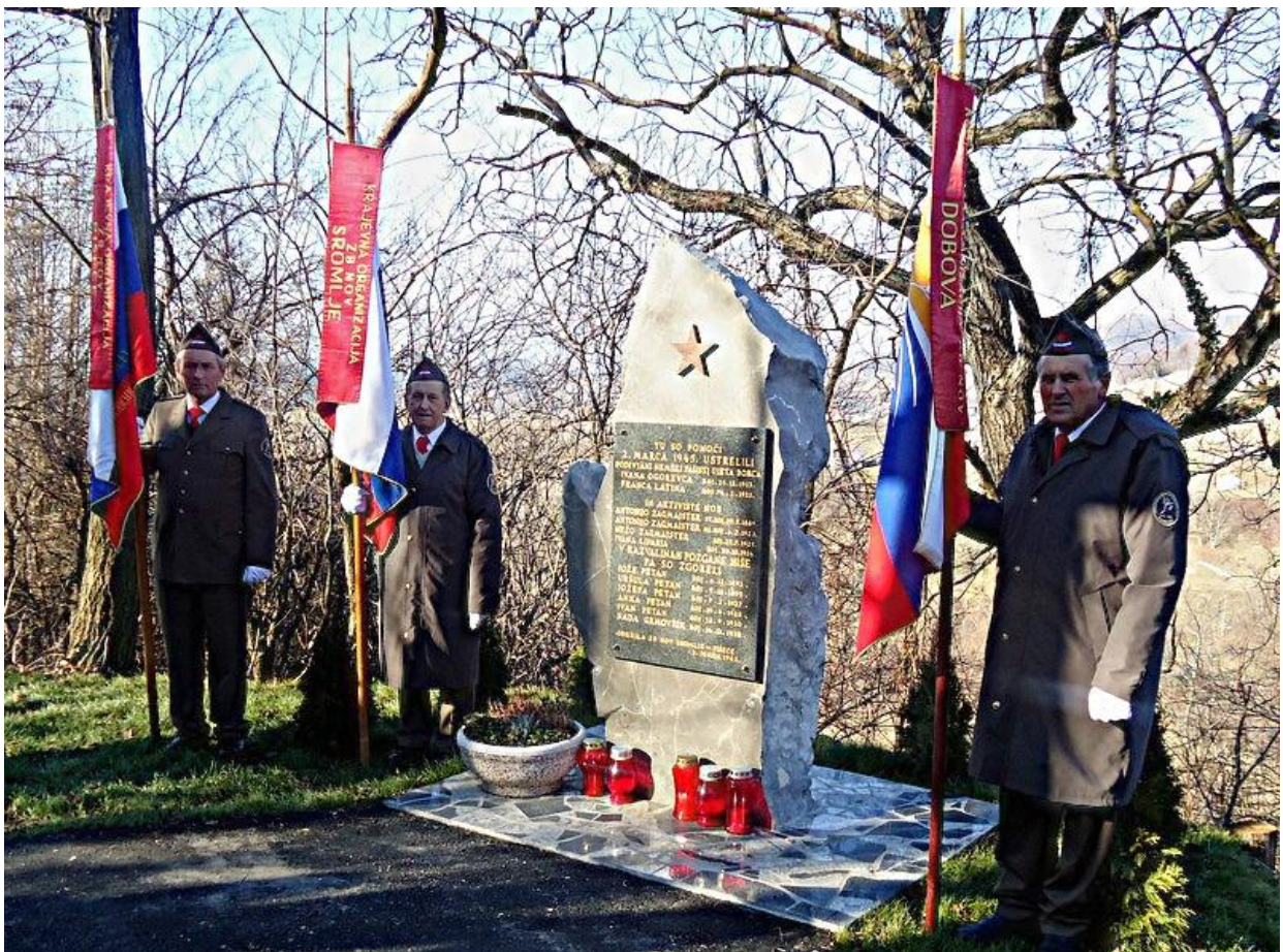
Uniformirani praporščaki Zveze borcev Brežice pri spomeniku iz 2. svetovne vojne (1941-1945). Lastine, 2012.

Nacistična Nemčija ni priznavala partizanov kot vojskujoče se sile, ki bi jo ščitilo mednarodno pravo. Posledica tega je bila, da so vojne ujetnike in ranjence na Štajerskem pobijali vso drugo svetovno vojno. Podobno so počeli s civilnim prebivalstvom, ki so ga sumili podpiranja partizanov.