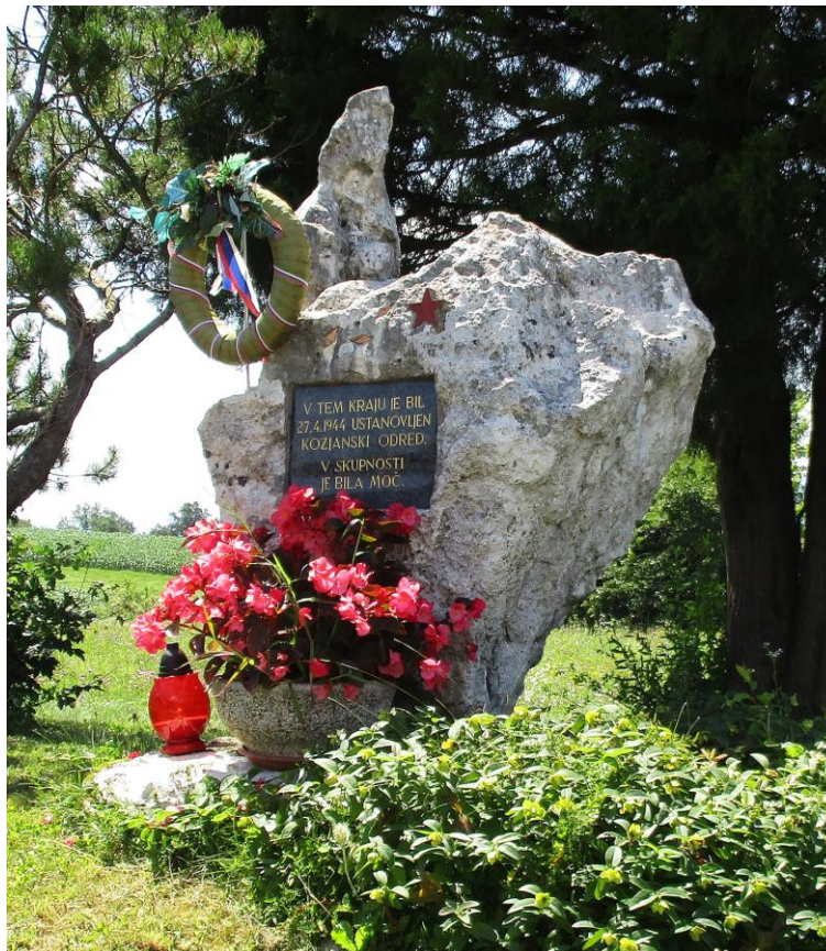
Spomenik na Silovcu pri Sromljah je posvečen ustanovitvi Kozjanskega partizanskega odreda.