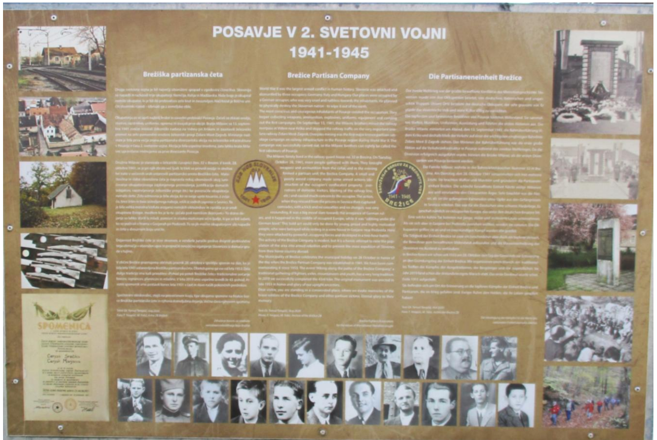
Zgodovinska informativna tabla na železniški postaji v Brežicah. Posvečena je Brežiški partizanski četi. Foto: Tomaž Teropšič, 18. avgust 2025. Iz osebnega arhiva T. Teropšiča.

njimi želijo brežiški borci še dodatno vplivati na domoljubno zavest občanov in občank ter povečati pripadnost skupnosti.