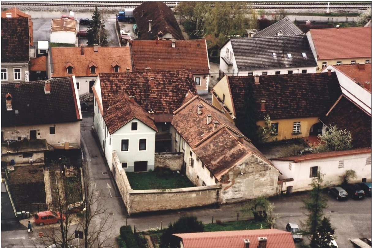
Sodišče in sodni zapori z ograjenim dvoriščem v Sevnici.

izdajalcev, razstreljevanje železniške proge itn.) ter povzročila okupatorju nemalo skrbi. Zelo odmevna je bila akcija, ko so svoje ujete tovariše, z zvijačo, brez žrtev in brez izstreljenega naboja, rešili iz sodnih zaporov v Sevnici. To je bila velika moralna klopota aroganci nemških oblastnikov in zgodila se je sredi okupirane Evrope, medtem ko je le-ta »ječala pod nemškim škornjem.«