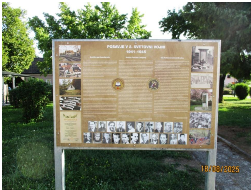
Domoljubno informativno tablo, avtorja dr. Tomaža Teropšiča, je leta 2020 postavilo Združenje borcev za vrednote narodnoosvobodilnega boja Brežice.