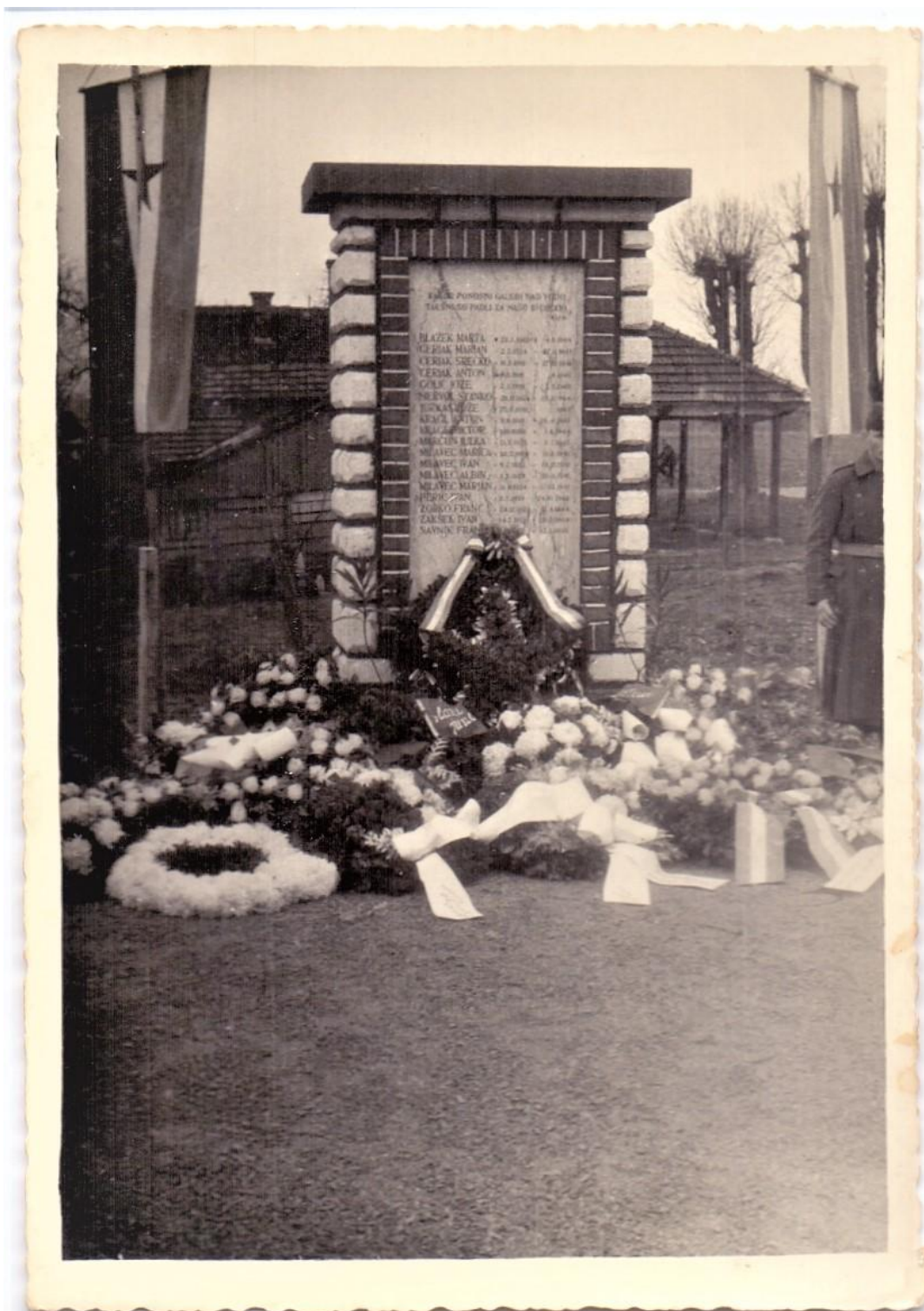
Spomenik posvečen borcem Brežiške čete ter borcem in borkam iz Brežic so postavili leta 1951.

spomenik smo postavili konec leta 1951 v čast in slavo naših pokončnih prednikov.