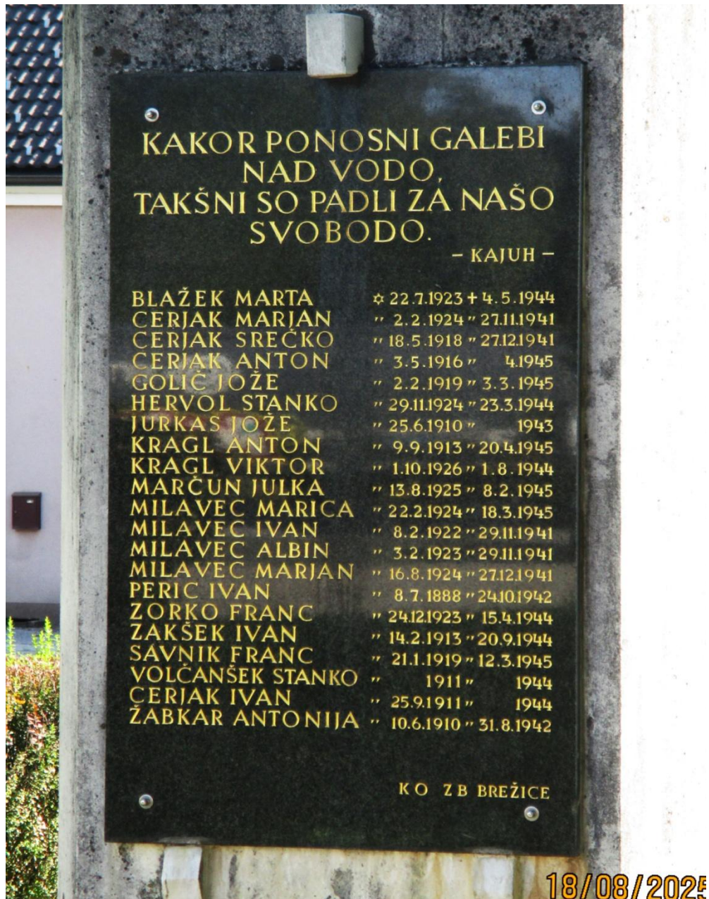
Detajl spomenika na betonskem podstavku. Foto: Tomaž Teropšič, 2025. (Osebni arhiv Tomaža Teropšiča)

V spomin Brežiški četi je v Posavju in na Kozjanskem postavljenih in ohranjenih več spomenikov in spominskih plošč. Za spomeniško dediščino skrbijo prizadevni člani organizacije zveze borcev in drugi. Več raznih domoljubnih organizacij pa skrbi za spoštljivo ohranjanje verodostojnega zgodovinskega spomina na naše hrabre in pokončne prednike, na katere smo ponosni.