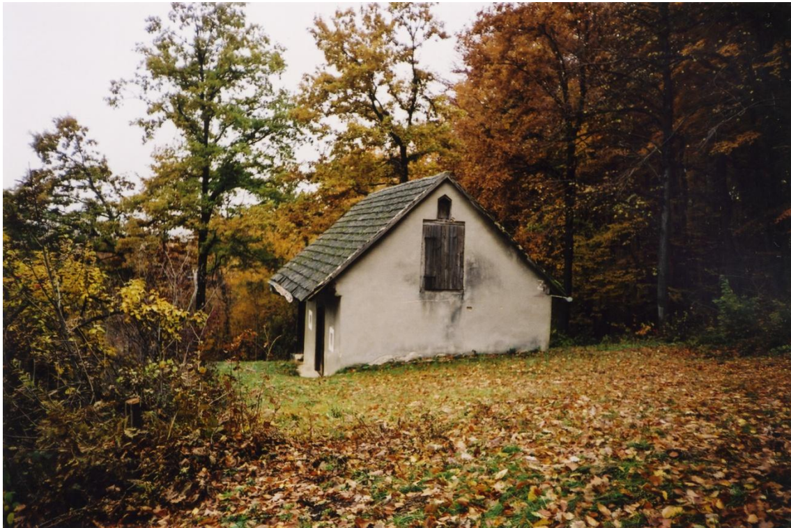
Kunejev hram v Gorjanah pri Podsredi. Hram je bil kraj zadnjega spopada Brežiške čete z nemškim okupatorjem.

a vendarle junaški poskus dvigniti prebivalstvo tega območja v oborožen upor in preprečiti množično izganjanje Slovencev iz domače grude v tujino. Njihove akcije so bile tako le del široko zasnovanega načrta, ki ga je pripravljalo vodstvo narodnoosvobodilnega gibanja Slovenije, da bi nemškemu okupatorju onemogočilo izganjanje Slovencev iz Posavja in Obsotelja.