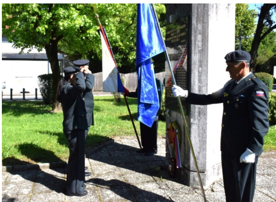
Vojaški pozdrav podpredsednikov Združenja slovenskih častnikov Brežice padlim borcem 2. svetovne vojne.