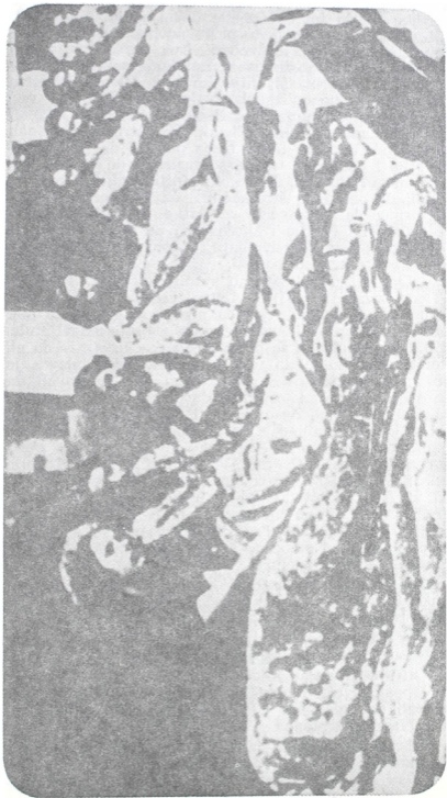
Ankni savorci, tekstilne radnice, na štrajkačkoj straži