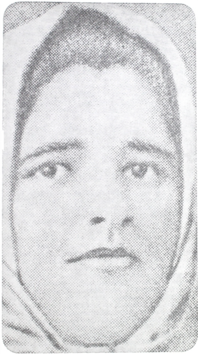
Narodni heroj Anka Butorac, na prvim koracima u revolucionarnom pokretu