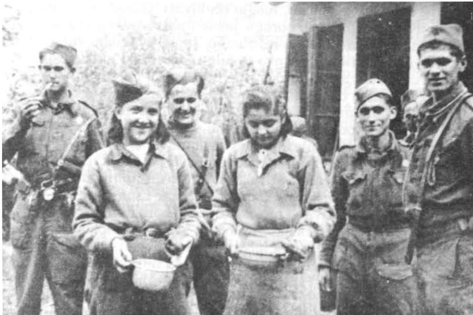
Kulturno-prosvjetna ekipa Tuzlanskog odreda 1944. godine

Kulturno-prosvjetnoj aktivnosti u Odredu, u ovom periodu, takode, je poklanjana potrebna pažnja, iako se ona odvijala sa dosta teškoća zbog velikog broja nepismenih boraca i zbog stalnih pokreta jedinica Odreda. Osnovni zadatak bio je opismenjavanje nepismenih boraca. U ovom smislu prihvaćena je odluka da nijedan borac ne smije ostati nepismen, razvijana je i aktivnost opismenjavanja svih nepismenih drugova. Ovaj zadatak, međutim, nikada nije doveden do kraja, jer je stalnim prilivom novih boraca pridolazio određen broj nepismenih, ali se na njemu, kao najznačajnijem zadatku kulturno-prosvjetne aktivnosti u Odredu, dosljedno istraivalo. Inače, svaki bataljon i četa su imali svoj kulturno-prosvjetni odbor, koji je bio organizator i pokretač svih aktivnosti po određenim sektorima kulturno-prosvjetnog rada. U ovom periodu su