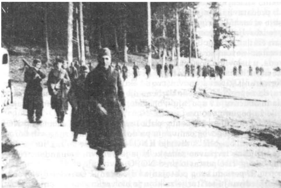
Po slamanju spoljne odbrane neprijatelja jedinice JA su se uputile prema Sarajevu. Podromanija. aprila 1945. godine

Nakon oslobođenja Sarajeva, Odred je, 10. aprila, postavljen na liniju Sokolac - Podromanija sa zadatkom čišćenja okolnih sela