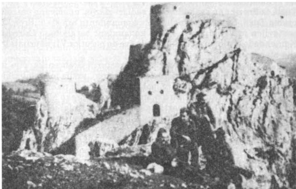
Grupa boraca pred zidinama starog Srebrenika. početkom 1944 godine

Razmješten u Srebreniku i okolnim selima, poslije VI neprijateljske ofanzive i neuspjelog januarskog napada na neprijatelja u Tuzli, Odred je imao zadatak da djeluje prema Tuzli, Lukavcu, Smolući. Okolina Srebrenika pružala je povoljne uslove za oporavak boraca i sređivanje jedinica Odreda. U selima Dobrnja, Kuge, Zahirovići, Ljenjobud. Brezik i drugim, pripadnici Odreda su bili dobro prihvaćeni, smješteni i hranjeni. Odred se našao u sredini gdje je NOP već dublje pustio korijene. Politička diferencijacija u ovom kraju je, u toku 1943., godine, obavljena u korist NOP-a.