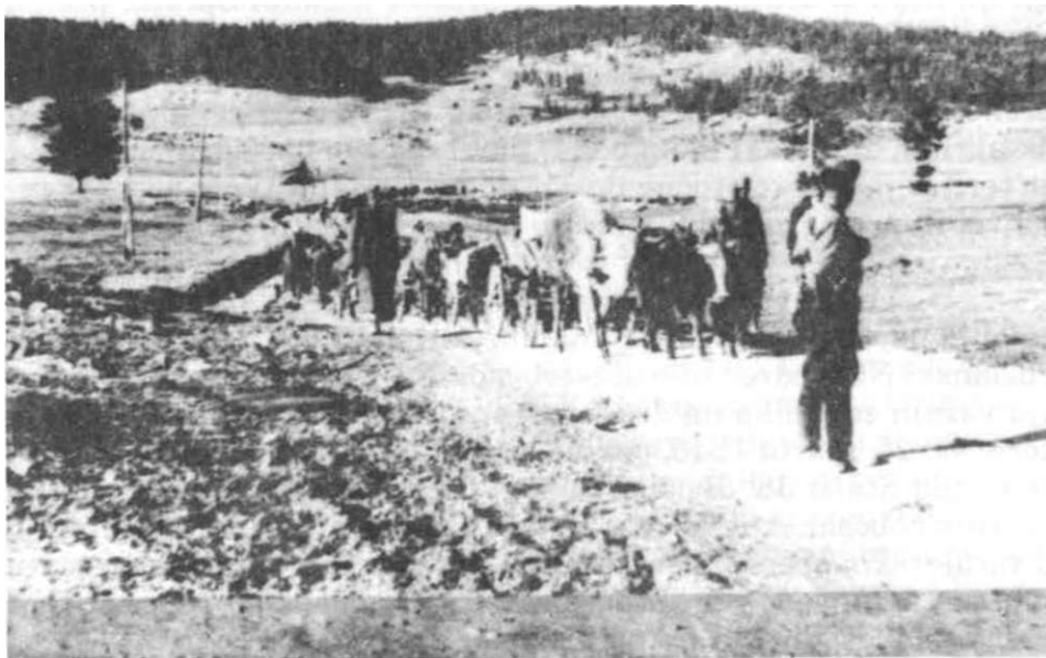
Borci Odreda na obezbjedenju intendanture 38. divizije u širem rejonu Sarajeva, marta 1945. godine

vom naređenju jedinice 38. divizije bile su postavljene na liniji Stari Grad - Kalauzovići - Vrane - Han - Vučija Luka - Crni Vrh - Kojino Selo sa zadatkom bočnog dještva na komunikaciju Mokro - Sumbulovac i čišćenje tog prostora od raznih neprijateljskih grupa. 208) Štab 38. divizije postavio je Tuzlanski NOP odred u rejon Rakova Noga - Riječina - Imamovići sa zadatkom da obezbjeđuje intendanturu Divizije, koja se nalazila u Šurjevićima, kao i da zatvara pravce od Olova i Vareša. 209)