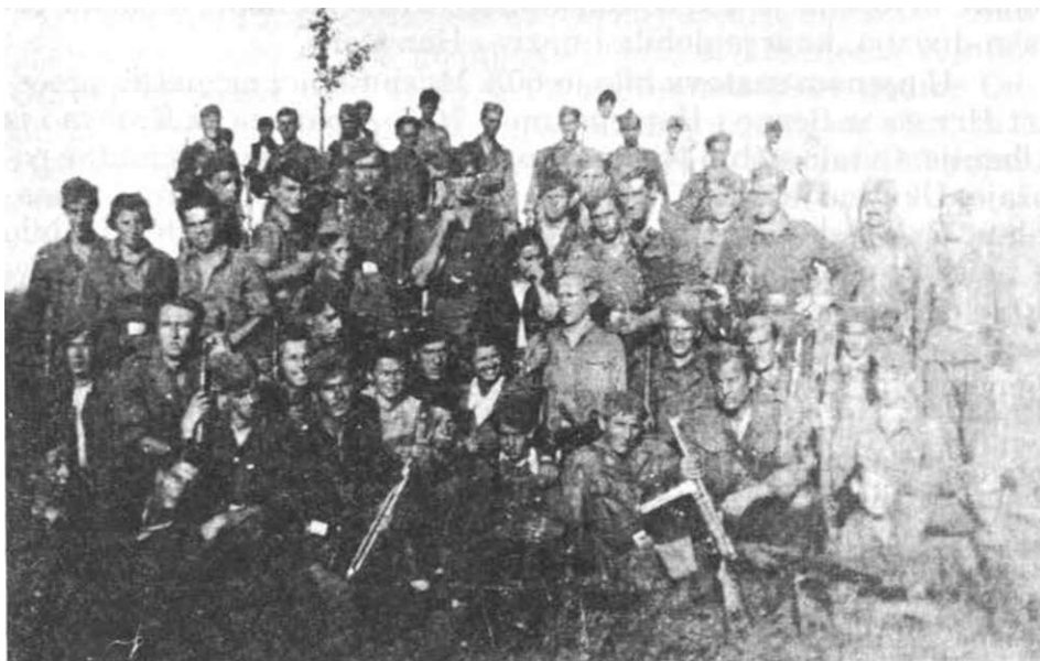
Tuzlanski partizanski odred u Smolući juna 1944. godine

Izvršavajući svoje osnovne zadatke. Odred je postepeno jačao i brojčano narastao. Krajem maja i početkom juna 1944. godine