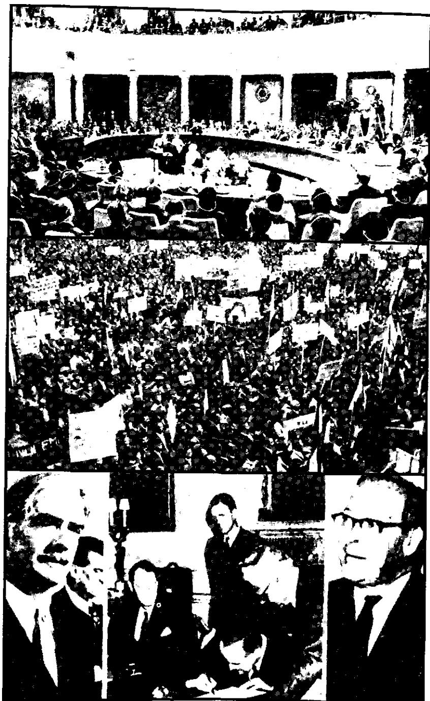
76. SALA BEOGRADSKE KONFERENCIJE U ZGRADI NARODNE SKUPŠTINE 77. DEMONSTRACIJE U LJUBLJANI ODRŽANE 16. APRILA 1952. GODINE POVODOM ODRŽAVANJA LON- DONSKE KONFERENCIJE I REŠAVANJE TRŠČANSKOG PROBLEMA BEZ UČEŠĆA JUGOSLAVIJE 78. POTPISIVANJE MEMORANDUMA O SAGLASNOSTI, LONDON 5. OKTOBAR 1954.