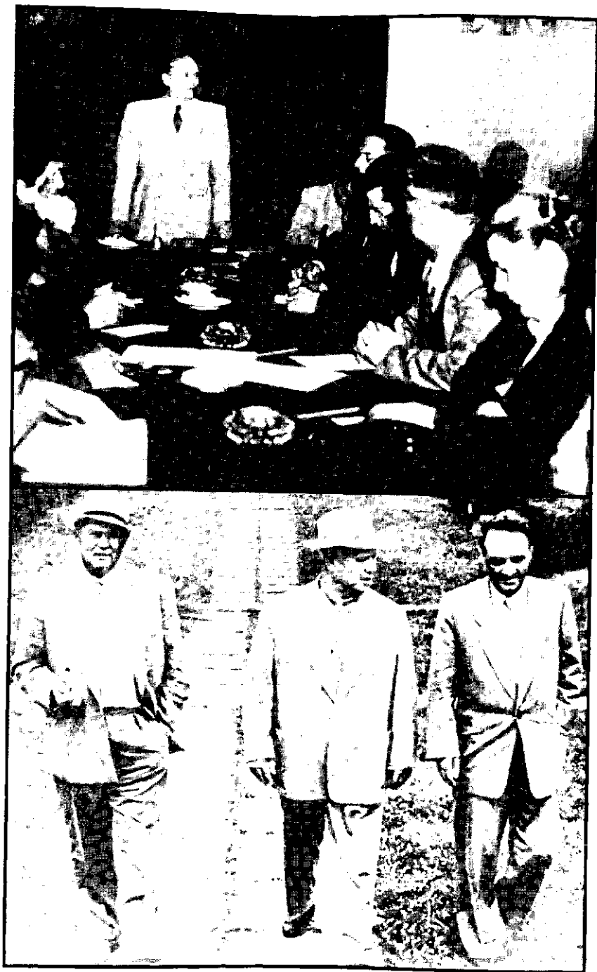
60. NA IV PLENARNOM ZASEDANJU SK KPJ 3. I 5. VI '951. U BEOGRADU RASPRAVLJANO JE O NEKIM TEORIJSKIM PITANJIMA RADA U PARTIJI