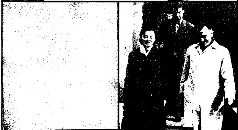
69. JUGOSLOVENSKA I SOVJETSKA DELEGACIJA PREDVOĐENA HRUŠČOVIM I TITOM ZA VREME OD- MORA NA KRIMU 1956. GODINE