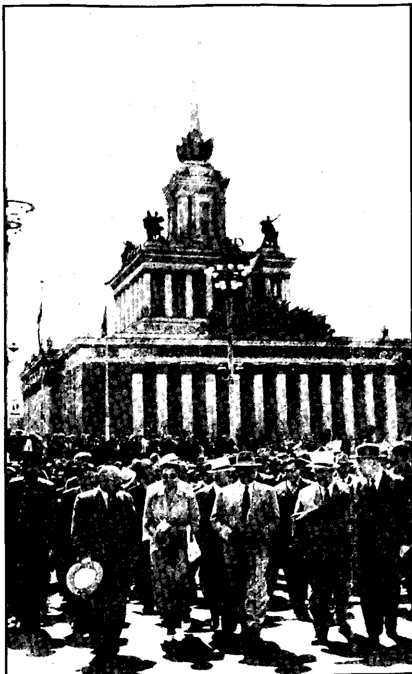
68. ZA VREME POSETE SOVJETSKOM SAVEZU JUNA—JULA 1956. TITO JE SA N. HRUŠČOVOM PROŠETAO JEDNOM OD GLAVNIH ARTERIJA MOSKVE, ULICOM GORKOG, GDE JE SRDAČNO I TOPLO POZDRAVLJEN