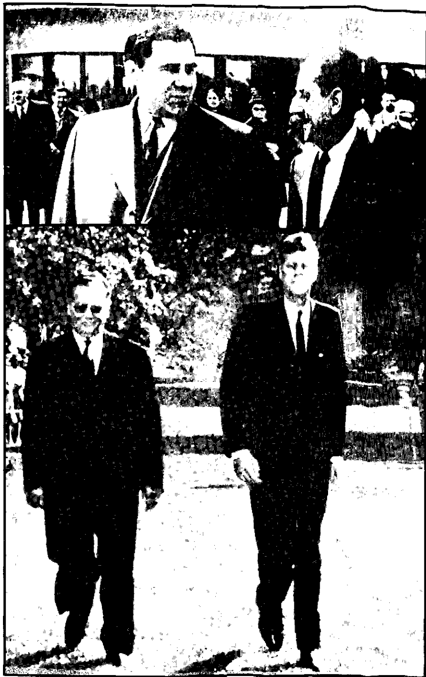
79. ANDREJ GROMIKO UČINIO JE ZVANIČNJ POSETU JUGOSLAVIJI OD 15 DO 21. APRILA 1963. GODINE. 80. PREDSEDNICI TITO I KENEDI PRED BELOM KUĆOM U VAŠINGTONU NOVEMBRA 1963. GODINE.