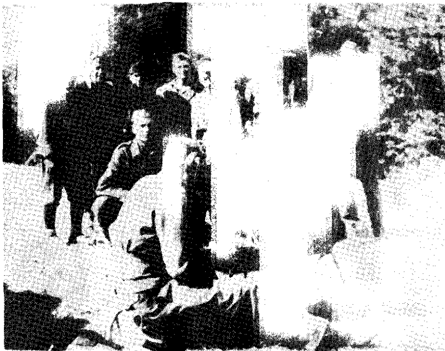
Radisti predaju depeše na novoj radiostanici primljenoj iz savezničke pomoći; u toku marša prema Lici, krajem kolovoza 1944.

Tako je Brigada, nakon osmomjesečnog zadržavanja oko Bosanskog Grahova, gdje je proživjela teške dane i teške borbe s njemačkim, ustaškim i posebno četničkim snagama, prešla na novi sektor. Borcima je teritorij oko Bosanskog Grahova ostao u sjećanju kao ustanički kraj teško popaljen i opljačkan u desetinama ofenziva koje su preko njega protut-