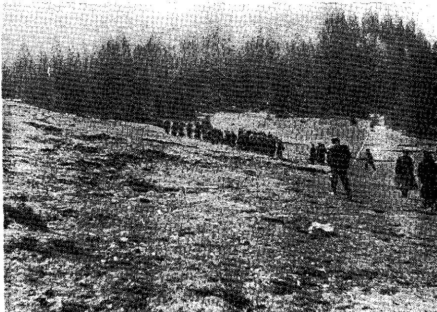
Drugi bataljon odlazi u obilazak ranjenika na Vještića goru u Preodac, Vještićo gora, početkom lipnja 1944.

U međuvremenu su ostali dijelovi 9. divizije na planini Vijenac razbili neprijateljski обруč, izmanevrirali njegove, izmorene i prašumsko-kraškim terenima nenavikle snage, zabacile se za leđa njegovih jedinica i sa Jadovnika sjevernim padinama Vijenca ponovno izbile na Tičevo. Radio depešom od 7. lipnja navečer 4. splitska brigada pozvana je natrag