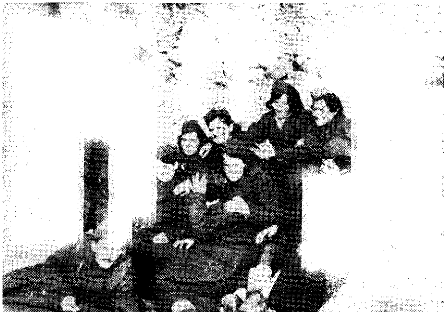
Grupa drugarica iz brigade, Šator planina veljača 1944. godine

Zbog toga je opet brigadi hitno naredeno da se prikupi na prostoriji Grkovci—Peulje radi obrane pravca Grahovo—Tičevo—Drvar. Tako je 2. bataljon dobio naređenje da se hitno vrati u selo Peulje, a 4. bataljon je prebačen iz Peulja u Markovaču. Dijelovi 2. bataljona sačekali su u zasjedi u kolibama kod Borove glave jednu četničku izvidnicu 23. veljače i nanijeli joj gubitke od 4 mrtva i 3 ranjena.