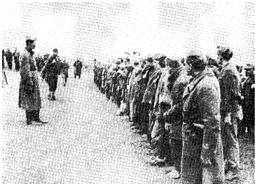
Postrojavanje 4. bataljona, Rujani, travanj 1944.

Do 24. 4. neprijateljevi dijelovi bili su ovladali i Vještića gorom, ali kad su preko Borove Glave i Uništa u njegov bok udarila dva bataljona 3. dalmatinske brigade upućene iz Grahova i jedan bataljon 4. brigade preko Gubina i Troglava, na večer 24. travnja odstupili su natrag u Cetinsku dolinu.