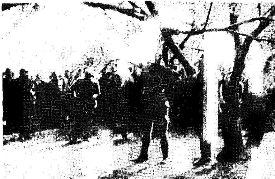
Načelnik Štaba 9. divizije i komandant uže obrane Splita, Ante Bioc.i-Toni pred strojem novopridošlih boraca. Solin, polovinom rujna 1943. godine

Poslije podne u borbe kod Rupotine ubačeno je i šest zaplijenjenih talijanskih tenkova. Izvršen je protunapad, pa su esesovci prinuđeni na odstupanje natrag u tvrđavu Klis. A cijeli taj neprijateljski napad odvi-