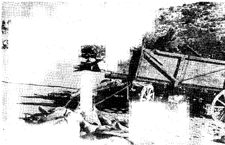
Bojište nakon borbi u dolini Zrmanje, 5. prosinca 1944. godine

stvom komandanta divizije general-majora Windischa (Vindiša) slijedećih dana probije duž željezničke pruge ka sjeveru. Inače češće su poslije dolazili pojedini vojnici ili odjeljenja nakon avanturističkih marševa preko neprijateljske teritorije, a među njima neki i fantastično odjeveni kao, na primjer, goniči magaraca, kao partizani, kao starice i slično . . . 262)