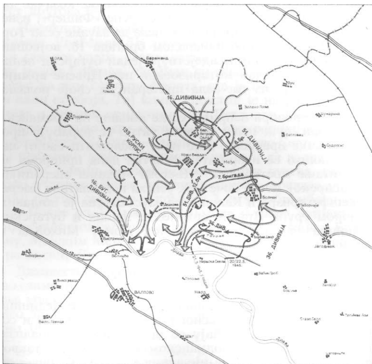
Ликвидација мостобрана код Болмана

По заповести штаба 7. бригаде, напад је требало извршити са три батаљона у линији, док је 4. батаљон задржан у резерви. Трећи батаљон је добио задатак да обилазним маневром са северозапада, са коте 92, изби-