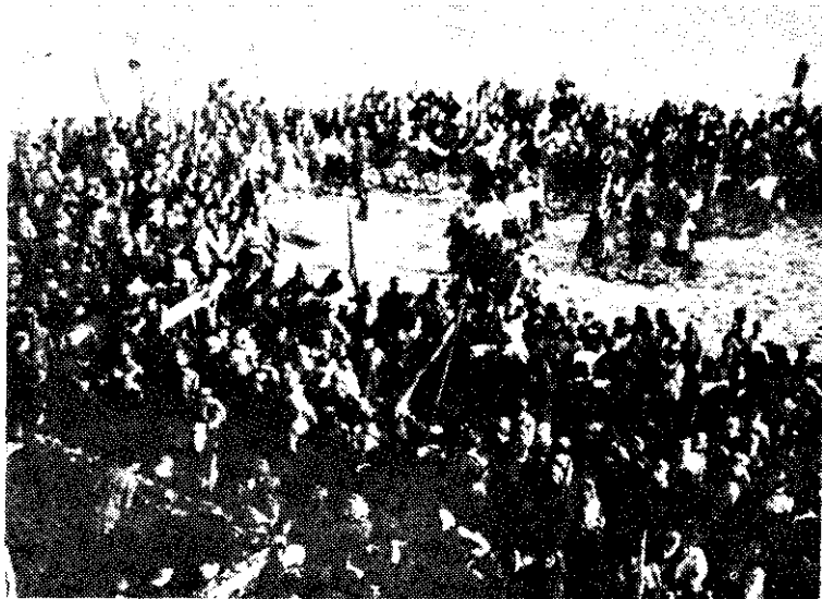
Борци 16. војвођанске НОУ дивизије на митингу у ослобођеној Сремској Митровици, новембра 1944.

Поводом двадесетседмогодишњице октобарске револуције јединице 1, 2. и 4. бригаде припремале су се за дефиле кроз град 7. новембра 1944. Борци су чистили оружје, одећу и другу опрему, а на четним и батаљонским конференцијама одржана су предавања о октобарској револуцији и о улози Црвене армије у другом светском рату. Културно-просветни одбори су организовали више приредби са програмом по окол-