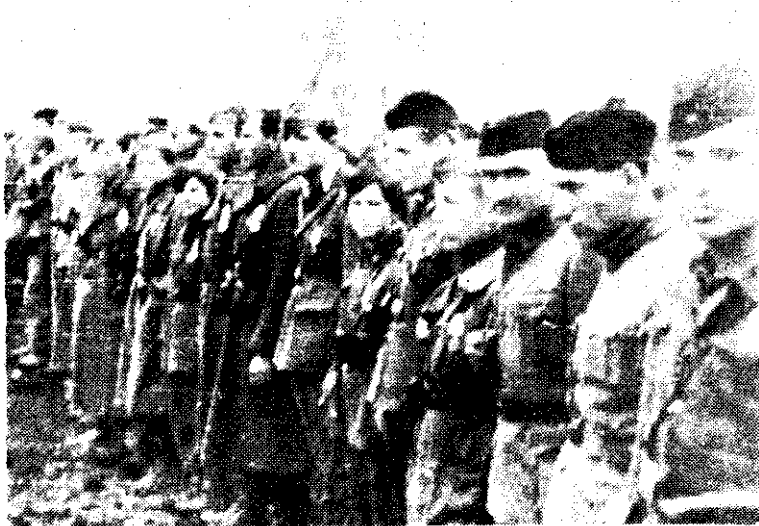
Борци 2. војвођанске НОУ бригаде после поделе одликовања у Сомбору, новембра 1944.

Сви борци и руководиоци 16. дивизије, кад су се постројили за смотру, били су већ упознати са добивеним задатком. Па ипак радост се испољавала на лицу сваког од њих, јер су гледајући себе, своју чету, батаљон, бригаду и целу дивизију видели велику разлику у бројном стању и наоружању људства. Читава дивизија бројала је сада преко 6.000 бораца. У 1. и 2. бригади је било скоро по 1.900, а у 4. бригади 1.700 другова и другарица. Дивизија је имала топове, минобачаче, митраљезе, пушкомитраљезе, аутомате, телефонске центре и апарате. Пушкомитраљеза, на пример, било је око 300, аутомата је било преко 2.000 двосовинских кола је било 744; коња јахаћих 158 и теглећих 1.791. 29