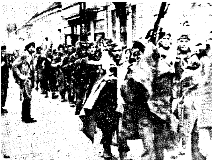
Улазак бораца 16. војвођанске НОУ дивизије у ослобођену Руму, октобра 1944.