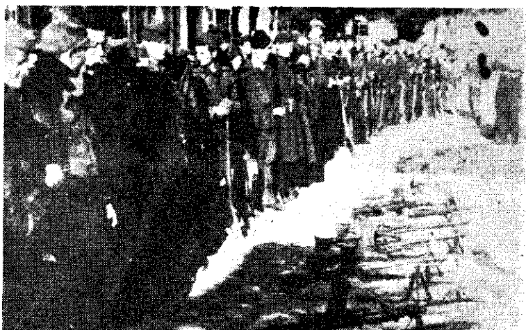
Борци 1. батаљона 2. бригаде после ослобођења Лознице

Напад је почео ноћу 23/24. септембра у 21 час. Пошто је до поноћи сломљена спољна одбрана на околним висовима Лознице, наше јединице су упале у град. Отпор непријатеља (око 700 немачких војника и припадника Руског заштитног корпуса, Српског добровољачког корпуса и Страже) био је јак, нарочито код железничке станице и у североисточном делу града.