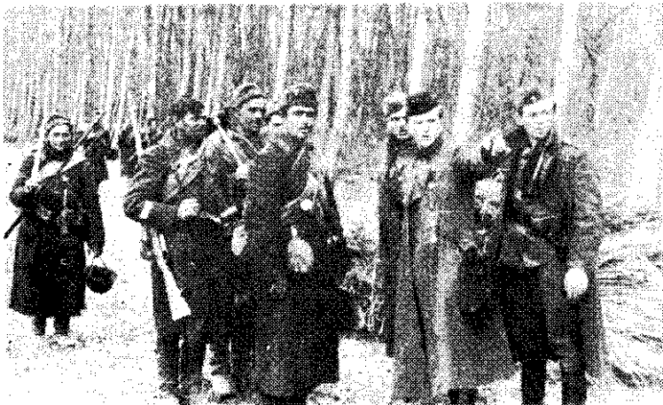
Чланови штаба 4. батаљона 2. војвођанске бригаде са борцима на Болманском мостобрану, март 1945.