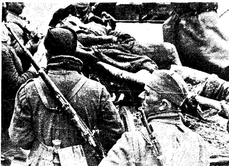
Преношење рањеника у борбама на Болманском мостобрану