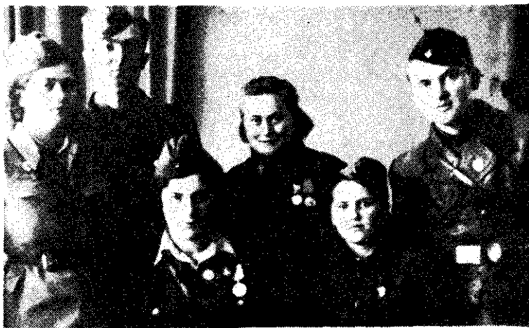
Делегати 16. војвођанске НОУ дивизије на Првом конгресу УСАО ВОЈВОДИНЕ у Новом Саду

У наредном лериоду у политичким одсецима бригада, који се поступно формирају и у условима непре-