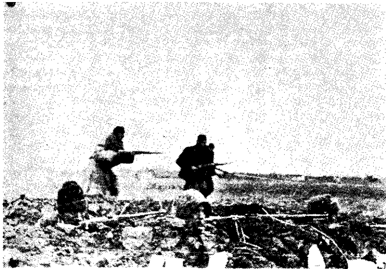
Борба 16. војвођанске НОУ дивизије на положају код Болмана, март 1945.

Пратећи кретање непријатељских јединица које су учествовале у ликвидацији вировитичког мостобрана, штаб Треће армије је утврдио да су се све те јединице задржале на тој простарији; да су десну обалу Драве од Осиека до Доњег Михаљца запоселе снаге 11. ваздухопловне пољске дивизије, а да се у рејону Доњи Михаљца, Подравска Мославина, Напшце групишу јединице 104. ловачке и 297. пешадијске дивизије и 1. козачког коњичког корпуса, да је непријатељ ојачао извиђачку делатност и саобраћај на комуникацијама Осиек — Доњи Михаљца. Због тога је штаб Треће армије 1. марта упозорио дивизије на могућност да непријатељ форсира Драву и наредио им да буду веома опрезне и спремне за борбу. 70