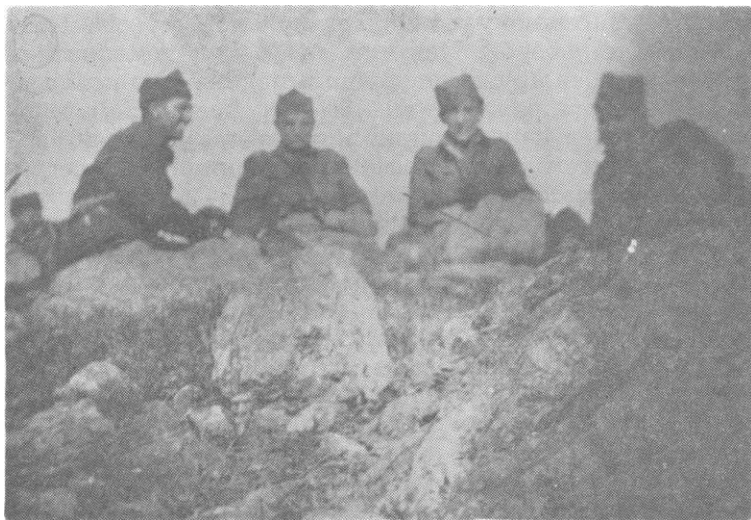
Део Оперативног руководства јужнолоравских, македонских и косовских јединица на положају

На другим положајима борба траје несмањеном жеетином до пада мрака. Уз подршку тешког наору-жања, које је без престанка дејствовало, бугарске јединице су извршиле пет јуриша на положаје наших јединица, али без нарочитог успеха, јер су увек уз осетне губитке биле одбијане. То је деморалисало војнике, те је њихово руководство донело одлуку да се обустави наступање и да јединице привремено пређу у одбрану а да сутрадан ујутро, када им пристигну свежа појачања, пређу поново у напад.