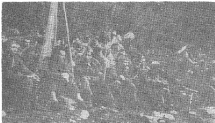
Формирана бригада на првом политичком часу са ратном заставом

При разматрању друге и треће тачке дневног реда указивано је на постигнуте успехе јединица НОВ и ПОЈ на територији Југославије у току 1943. године и истакнуто да су пропали еви планови непријатеља да уништи војно-политичко руководство Југославије са главном оперативном групом у долини Неретве и Сутјеске. Уместо уништења створене су нове, снажније јединице које проширују слободну територију и стварају нову. Југословенско ратиште постаје све значајније и задаје велику главобољу нацистичком руководству. Посебан осврт је дат на значај одлука Другог заседања АВНОЈ-а и при томе је истакнуто: