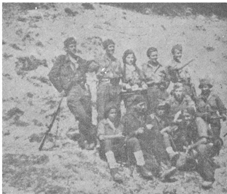
Група бораца батаљона „Стив Наумов“

бункере. А рудници за дужи временски период неће бити способни за рад. Оно што је највише радовало борце и што им је давало снаге била је чињеница да је иницијатива била у нашим рукама и да су на тај начин за кратко време задали два осетна удара од којих је непријатељу поремећен осећај сигурности у утврђеним насељима. Сама ова акција је политички силно одјекнула код становништва у источној Македонији, где није било наших партизанских снага и где се окупатор прилично осећао сигурно.