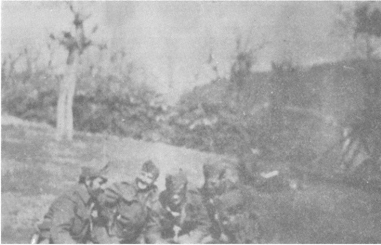
Штаб 3. бригаде разрађује добијену директиву Главног штаба Македоније

Не обазирuћи ee на жестоку ватру, батаљони су вештим пребацивањем постeпeно освајали простор и приближили се њиховим положајима на 100 до 150 метара. Отпочeла је припрема за јуриш. Два узастопна јуриша централне групе била су одбијена. Четници су се осeћали сигурним. У међувремену левокрилна група је успешно вршила обухват. Њена појава потпуно је збунила и преплашила четнике. Настало је комешање. Четнике је захватила паника. Наше јединице су заузимале положај за положајем. Снег је био преко колена, али то борцима није сметало. У једно време четници као да су се повратили од претрпљеног страха. Покушавали су јуришем да поврате изгубљене положаје, али им то није полазило за руком. Све наше јединице су имале тактичку везу. Оперативно руководство је било у току збивања на читавом фронту. Борба је на свим секторима била жестока. Пошто је био снег, четници су се добро видели на положајима, а то је омогућавало нашим пушкомитраљесцима да им наносе осетне губитке.