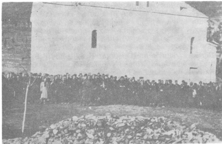
Постројени борци 6. јужноморавске бригаде у с. Трговишту

Косовски одред је добио задатак да са 1. батаљоном минира и обезбеди пут у околини села Ратаја који од Врања води ка Ристовцу; са 2. батаљоном и делом снага 2. батаљона 3. македонске ударне бригаде да заузме и минира железнички мост на р. Јужна Морава.