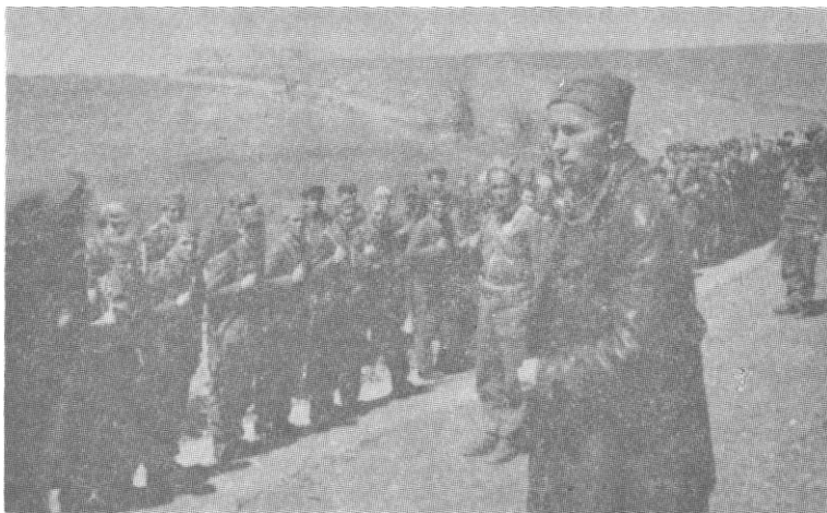
Делегат ЦК КПЈ и ВШ НОВ и ПОЈ Светозар Вукмановић Темпо врши смотру у с. Жегђану

снагама да тежиште својих дејстава усмере на основног бугарског фашистичког окупатора и на врло осетљиву комуникацијску магистралу у долини Мораве, тако важну за саобраћај и транспорт немачких снага у Грчку.