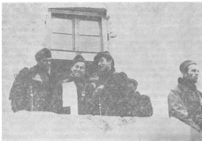
Приредба за време формирања бригаде у с. Жегњане

Овај догађај снажно је преживљавао песник Ацо Шопов. Сетио се похода батаљона: „Стив Наумов“ и „Христо Ботев“ преко Беласице, Ограждена, Плачковице, Осогова до планине Козјак. Сетио се борби војених у источној Македонији. У тим тренуцима у њему су се мешала два супротна осећања: радост због формирања бригаде и туга, бол што у бригади нису легендарни јунаци Христијан Тодоровски Карпош и Стеван Наумов. И док се дуга колона спуштала ка манастиру Про-