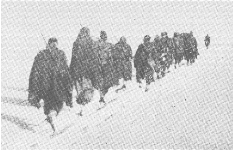
Kolona boraca 13. proleterske prolazi kroz zavijano Petrovo polje u februaru 1944.

oko rijeke Ugra kao privremenu bazu i osigurati Petrovo Polje »zbog specijalne potrebe«. 29