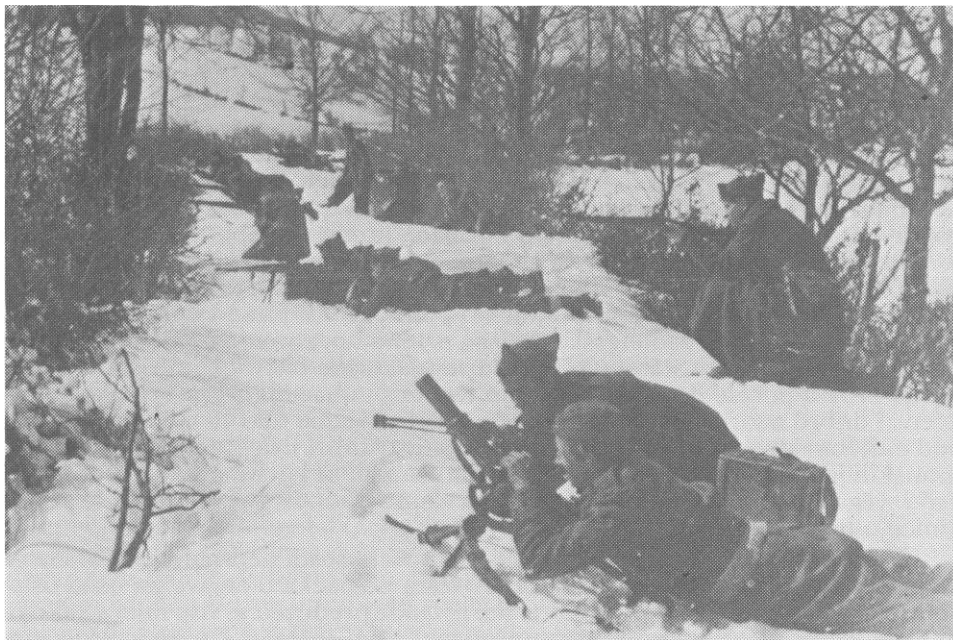
Borci 13. proleterske na obuci kod Travnika, decembra 1943.

Na kraju pomenutog dopisa štab brigade ukazao je štabovima bataljona da dobro povedu računa da se ne pretvore u borce, već da umješno rukovode jedinicama na položajima. »Uvijek imati u vidu«, pisalo je u dopisu, »da smo ušli u 1. proletersku diviziju (čiji su borci) prošli sve borbe i prekaljeni u borbama, a koji očekivaju od nas kao od hrvatske proleterske brigade, koji smo godinu dana tukli neprijatelja na vratima Zagreba, a koji su obavješteni da smo opravdali ime proletera kao i srpa i čekića. Pošto je neprijatelj isti i kod Zagreba i u Bosni zato ga moramo još više tući u Bosni i da pokažemo ovim jedinicama povjerenje koje očekuju od nas.« 6