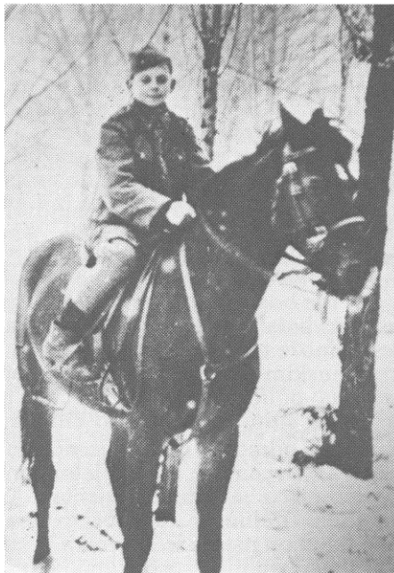
Kurir 13. proleterske na zadatku kod Travnika, januara 1944.

U duhu opšteg plana zimskih operacija trebalo je da Nijemci, poslije borbi u Sandžaku, istočnoj Bosni, Dalmaciji i Kordunu, ofanzivna dejstva prenesu najprije u srednju i zapadnu Bosnu, a zatim u sjevernu Dalmaciju, obuhvatajući istovremeno Liku, Gorski kotar i Hrvatsko primorje. Prema zamisli štaba njemačke 2. oklopne armije, pored ostalog, napadom jakih snaga s linije Derventa - Teslić - Zenica - Sarajevo - Konjic - Jablanica ka dolini Vrbasa, trebalo je odbaciti 1. proleterski i 5. korpus od značajnih komunikacija u dolinama rijeka Bosne i Neretve, a zatim brzim prodorima razbiti njihove jedinice i izbiti u dolinu Vr-