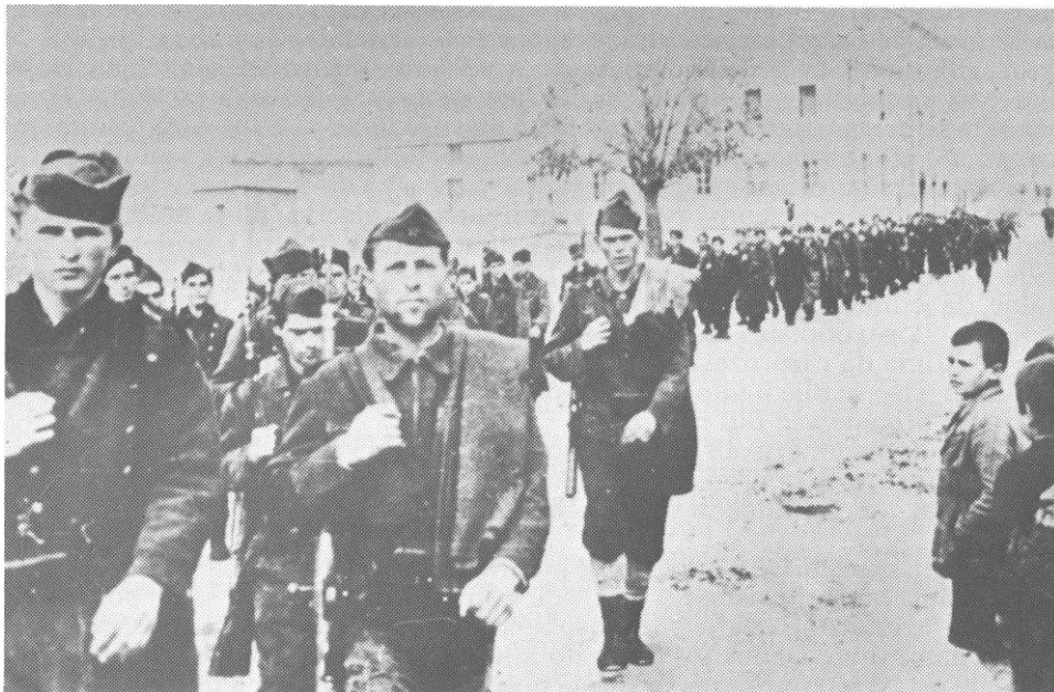
Kolona 1. bataljona 13. proleterske na putu prema Travniku, novembra 1943. (Iz zbirke Muzeja revolucije naroda Hrvatske u Zagrebu)

neprijatelja u rejonu Jastrebarsko - Plešivica i 2. bataljon Žumberačko-pokupskog odreda kod Pokleka radi zatvaranja pravca Stojdraga - Novo Selo, s tim da o situaciji redovno izvještavaju štab brigade koji se nalazio u Vrhovcu. Pored toga jedan bataljon Karlovačkog partizanskog odreda zatvorio je pravac Karlovac - Ozalj. Početak napada određen je u 19 sati 12. septembra. Bilo je predviđeno ako se ne uspije u toku noći da se napad produži sljedećeg dana. 23