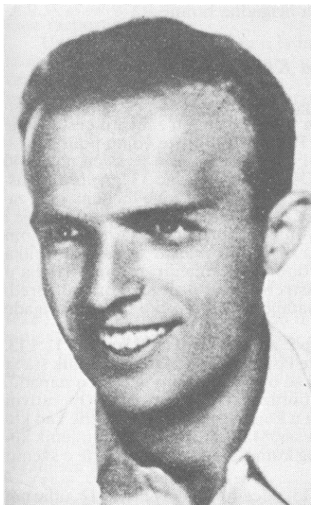
Narodni heroj Rade Končar, sekretar CK KP Hrvatske, čije je ime nosila brigada od 11. decembra 1942.

nističke partije Hrvatske a po odobrenju Centralnog komiteta komunističke partije Jugoslavije i Vrhovnog štaba Narodnooslobodilačke vojske i partizanskih odreda Jugoslavije, XIII Udarne narodnooslobodilačka brigada Hrvatske, radi njenog borbenog i junačkog držanja u borbama protiv talijanskog okupatora i domaćih izdajnika Bele garde i ustaša, zvat će se XIII udarna narodnooslobodilačka proleterska brigada »Rade Končar.« 4,5