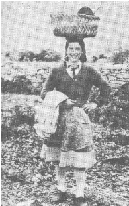
Seljanka iz Badovinaca nosi hranu borcima na položaj kod Kasta, marta 1943.

ofanzivi i kako u ustaško-domobranske jedinice nijesu imali puno povjerenja, oni su s sedmom četom iz 7. SS divizije »Princ Eugen«, uz obezbjeđenje od strane ustaša, u noći između 27. i 28. januara iz Ozlja upali u Krašić, a zatim produžili za Brezarić gdje se nalazio 1. proleterski bataljon i mitraljeska četa. Iako je bilo oko pola noći i borci se nalazili na spavanju izuzev stražara od kojih je jedan na vrijeme primijetio neprijatelja i sa tri metka iz puške uzbunio borce, bataljon se brzo snašao i organizovano pružio otpor. Ne znajući jačinu neprijatelja on se sa dvije čete i mitraljeskom četom, povukao prema Hržniku a jedom četom prema Brleniću gdje su se nalazili Operativni štab i štab brigade sa 3. proleterskim bataljonom, četom pratećih oruđa i četom za vezu.