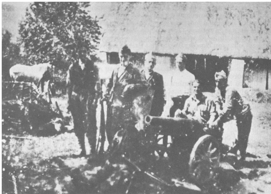
Top »Mali Marko« u naoružanju brigade dobijen od 4. kordunaške brigade, decembra 1942. (Iz zbirke Muzeja revolucije naroda Hrvatske, Zagreb)

rebarsko, Draganići, Ozalj). Zbog takvog položaja za obezbjeđenje su angažovane tri puta jače snage, nego za sam napadna mjesto. Iako je dolazak dvije ustaške satnije uoči napada znatno pojačao posadu i izmijenio odnos snaga sve je to anulirano brzim i odlučnim napadom. Kolebanja nije bilo. Za brigadu to je bio prvi napad na veće mjesto, pa je normalno daje do izražaja došlo i neiskustvo. U vezi s tim, štab 2. udarnog bataljona u operativnom izvještaju od 16. decembra štabu 13. udarne brigade dobro je primetio: »Ovaj puta imali smo pred sobom novi način ratovanja (ulične borbe) gaje se primjetilo da smo tu još početnici.« 15