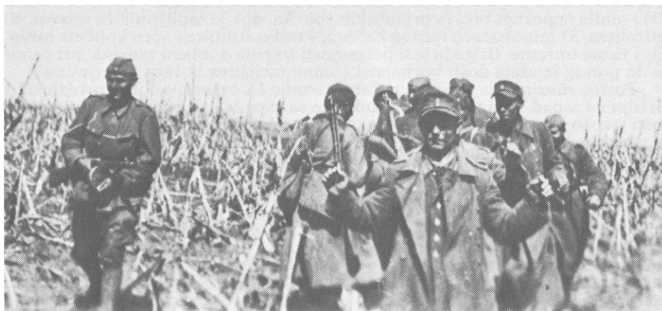
Borci 13. proleterske sprovode zarobljene njemačke vojnike. Bapska, položaj, 12. aprila 1945.

Iako je štab 1. armije JA pretpostavljao da su neprijateljske snage u Sremu u borbama tokom 12. i 13. aprila pretrpjele gubitke u ljudstvu od najmanje 70 odsto, one su bile samo djelomično razbijene. Njih je štab njemačkog 34. armijskog korpusa za specijalnu namjenu povukao na ranije pripremljenu odbrambenu liniju Gorjani - Đakovo - Strizivojna - Jaruge na kojoj je trebalo zadržati nastupanje 1. armije JA, dok se ne izvuku njemačke snage iz doline rijeke Bosne na sjever, iako su trupe Crvene armije još 13. aprila ušle u Beč, a dan ranije američke trupe prešle Elbu. Pored raznih neprijateljevih jedinica na frontu od Save do Drave na odsjeku Đakovačka Satnica - Gorjani nalazio se i 8. združ 3. ustaško-domobranske divizije, a na odsjeku Budrovci - Đakovo njemačka 22. divizija.