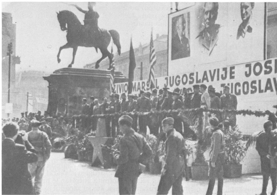
Počasna tribina na današnjem Trgu Republike u Zagrebu, ispred koje su 13. maja 1945. prodefilovali dijelovi jedinica koje su učestvovali u oslobađanju Zagreba. (Snimio Nikola Bibić)

nom artiljerijske brigade, da odmah nastavi dalji prodor pravcem: Donje Psarjevo - Crkvena Ves - Kasina - Sopnica - Čučerije - Dubrava - Gornji Steranovec - Crna Voda - Zvečaj - Prekrižje - Goljak - Pantovčak - do Ilice, a odatle da djeluje duž ulice i željezničke pruge prema Svetom Duhu i željezničkoj stanici u Terdici. Po izvršenom zadatku brigada trebalo je da se smjesti u rejon Gradišćanske ulice, desno od nje prema Kustošiji trebalo je da nastupa 3. krajiška proleterska brigada, a iza ove 1. proleterska brigada s tim da u Gračanima obrazuje rezervu, dok je Italijanska brigada imala zadatak da izvrši manevar preko Zagrebačke gore i da se s njenog vrha spusti u Dolje, takođe kao rezerva. Štab divizije zahtijevao je od štabova brigada da preduzmu »sve mjere da se prodori određenim pravcima vrše najenergičnije i najbrže« i da »s obzirom na opštu situaciju u kojoj se sve neprijateljske snage povlače i beže da bi se predale (Englezima i Amerikancima - prim, autora) posle već objavljene kapitulacije, ni jedna jedinica ne sme dozvoliti daje duže zadržavaju neprijateljske zaštitnice. Prodor do Zagreba i u Zagrebu mora biti nastupni marš bez zadržavanja oko pojedinih mesta otpora«, pisalo je u divizijskoj zapovijesti. Pored ostalog jedinice su dobile zadatak da po prodoru u grad postave straže i obezbijede zgrade svih javnih ustanova do dolaska jedinica 10. korpusa, a zatim da ih predaju njima na dalje čuvanje. 50