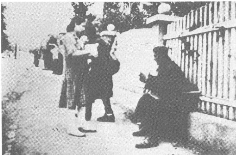
Na ulicama Zagreba borcima 13. proleterske narod donosi hranu, maja 1945.

U Vrbovcu, koji je od ranije bio dobro utvrđen, zatekli su se brojni dijelovi raznih njemačkih i ustaško-domobranskih jedinica koji su imali zadatak da ga uporno brane kako bi spriječili brzi prodor divizija 1. armije JA sa tog pravca u Zagreb. Poslije kraće pripreme i uspostavljanja međusobne veze, uveče 5. maja, u napad na Vrbovac pošle su 1. proleterska s istoka i 13. proleterska brigada s pomenutim rasporedom s juga i jugoistoka. Neprijatelj se uporno branio cijelu noć tako daje tek ujutro 13. proleterska brigada uspjela da zauzme željezničku stanicu i da ovlada južnim dijelom sela. Međutim, prikupivši jake snage neprijatelj je izvršio protivnapad i odbacio dijelove brigade iz sela i željezničke stanice južno od željezničke pruge. Prva proleterska brigada i dalje se zadržala na istočnoj ivici sela.