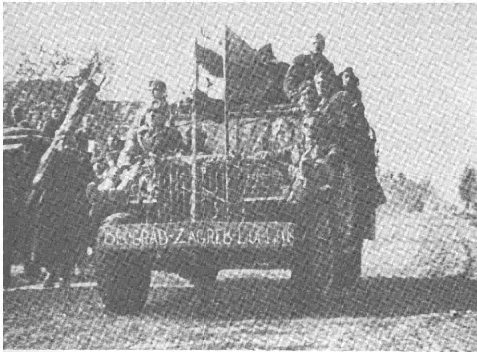
Borci i starješine 13. proleterske u štabnim kolima pred ulazak u Zagreb, maja 1945.

gama, pošto je tada naša brigada brojala malo ljudstva za borbu i svakako da je neprijatelj sa rezervama potpomagao svoje jedinice, koje su nas ispred sela na koti 212 zaustavile«. I dalje »pored malog brojnog stanja, koje je tada bilo u četma 10-15 ljudi, a u nekim najviše do 25 ljudi, sposobnost jedinice, razumljivo da nije bila dobra za daljnje borbe«. No, i pored toga »moral naših jedinica bio je priličan«, konstatovao je štab brigade. 39