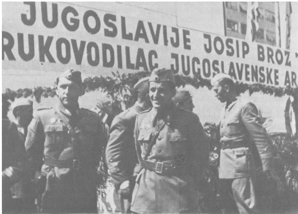
Ivan Gošnjak, komandant Glavnog štaba NOV i PO Hrvatske i Peko Dapčević, komandant 1. armije JA na počasnoj tribini za vrijeme defilea dijelova jedinica koje su učestvovala u borbama za oslobođenje Zagreba. 13. maja 1945.

posljednje borbe 13. proleterske brigade »Rade Končar« u narodnooslobodilačkom ratu. 54