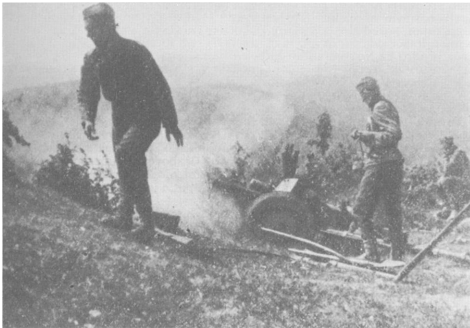
Top 13. proleterske brigade u dejstvu 7. maja 1945. na domaku Zagreba kod Vrbovca.

Izvlačenjem njemačkog 21. brdskog armijskog korpusa iz doline rijeke Bosne sjeverno od Save, Nijemci su znatno ojačali svoje snage pred frontom 1. i 3. armije JA u Slavoniji i Podravini. Istog dana kad su se posljednji dijelovi pomenutog korpusa prebacili na lijevu obalu Save, komandant njemačke Grupe armija »E« stavio je pod komandu štaba 21. korpusa sve njemačke i kvislinške snage na frontu između Drave i Save i naredio mu da posjedne položaj za odbranu na liniji Drava - Bilogora - Ilova - Novska - Sava. 34 Neprijatelj je namjeravao da na toj liniji zaustavi nastupanje 1. i 3. armije JA radi dobitka u vremenu kako bi organizovao uredno izvlačenje snaga ka Zagrebu i dalje prema Austriji. Na pomenutoj liniji štab 21. brdskog armijskog korpusa organizovao je front do 26. aprila.