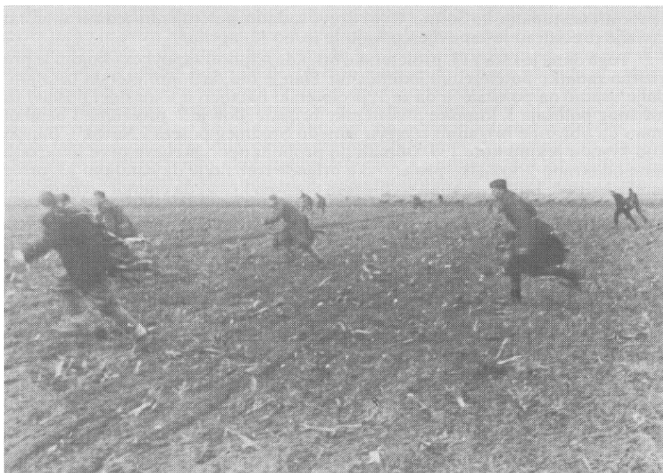
Juriš boraca u probiju sremskog fronta, 12. aprila 1945.