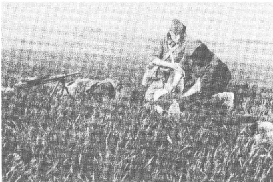
Referent saniteta 4. bataljona 13. proleterske Vera Vunetić i bolničarka Rada Prodanović ukazuju pomoć ranjenom borcu 13. proleterske na položaju, sremski front, aprila 1945. (Iz knjige: »Tri godine borbe 13. proleterske«)