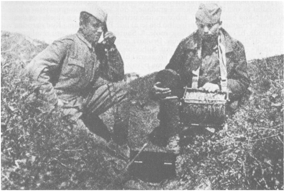
Telefonisti 13. proleterske na položaju, sremski front, aprila 1945.

u predstojećim završnim operacijama za konačno oslobođenje zemlje i njen značaj za očuvanje tekovina NOB-e poslije rata. Nosioi političko-vaspitanog rada u brigadi bili su politički komesari i njihovi pomoćnici. Uslovi za njihov rad u odnosu na raniji period bili su povoljni. Pored toga što brigada nije bila angažovana u borbama, stizalo je dosta štampanog materijala, među kojim treba istaći »Borbu«, organ KPJ, zbog njene informativne, mobilizatorske i vaspitne uloge, koja je stizala skoro do svakog borca. Ovim radom dat je značajan doprinos podizanju političke svijesti boraca, naročito novomobilisanih, njegovanju socijalističkog patriotizma i učvršćenju moralno-političkog jedinstva jedinica.