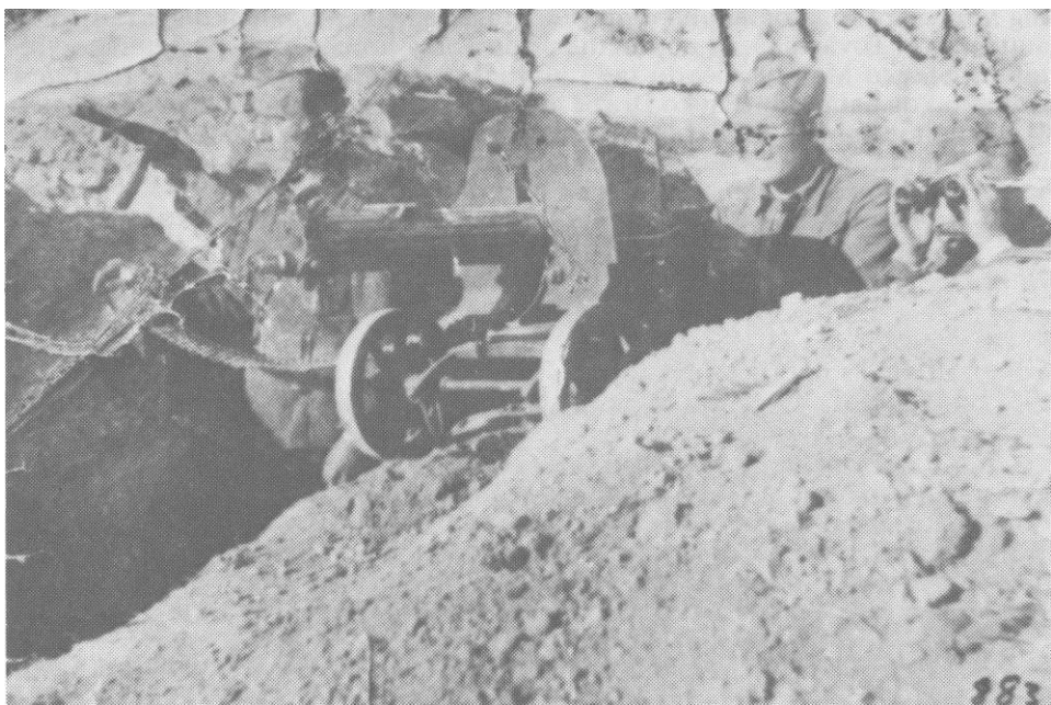
Mitraljezac Josip Spanjol sa otoka Raba, sremski front - položaj, aprila 1945.

je usmjereno na vojnu obuku boraca i starješina kako bi se što bolje osposobili za predstojeće borbe, a time se smanjili i gubici. Najviše pažnje poklonjeno je obuci u rukovanju oružjem, nastavi gađanja, borbenoj obuci i utvrđivanju (fortifikaciji). Obuka je izvođena po planu i rasporedu rada koji je izradio štab brigade, posebno za borce, posebno za starješine. Radilo se svakog dana od 7,30 do 11,30 i od 14 do 16 sati. Uveče od 19 do 20 sati vršena je priprema starješina za obuku boraca slijedećeg dana. Plan i program obuke obuhvatili su naoružanje, pješački egzercir, jedinačnu obuku, nastavu gađanja, napad na utvrđene linije, Pravilo službe IV dio, služba veze, desetičnu obuku, ratnu službu, borbenu obuku, fortifikaciju, borbe u šumama i oko šuma, noćne borbe, borbe oko rijeka i prelaz rijeka. 45