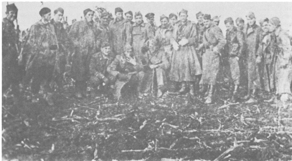
Štab 13. proleterske sa štabovima bataljona na sremskom frontu, februara 1945. (Iz zbirke Muzeja revolucije naroda Hrvatske u Zagrebu)

Poslije artiljerijske pripreme koja je trajala od 9 do 10 sati 3. decembra, jedinice 1. proleterskog korpusa krenule su u napad riješene da razbiju neprijatelja u Sremu i prodru do Osijeka i Vinkovaca. Na desnom krilu, ne samo divizijskog već i korpusnog borbenog poretka, 13. proleterska brigada napadala je sa 2. i 3. proleterskim bataljonom u prvom ešelonu uz podršku dijelova pratećeg bataljona.