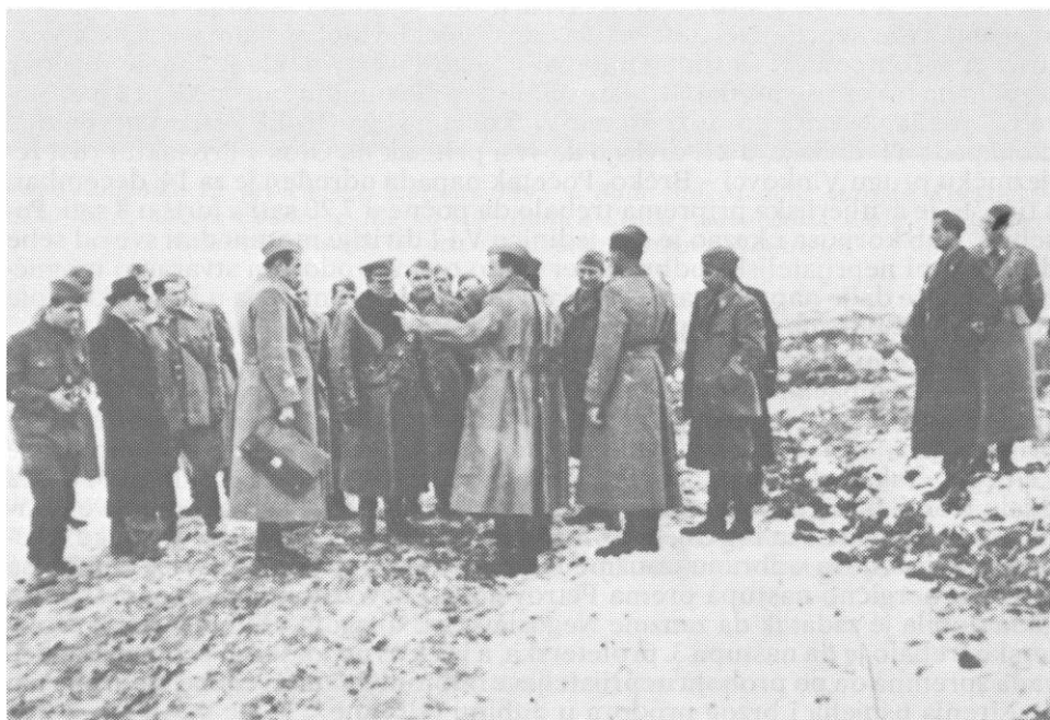
Vrhovni komandant NOV i POJ maršal Jugoslavije Josip Broz Tito, nakon raporta koji mu je predao komandant 1. proleterske divizije Vaso Jovanović. Sremski front - položaj, 16. februara 1945.

Nalazeći se na desnom krilu i na pravcu glavnog udara 1. proleterske divizije, 13. proleterska brigada poslije artiljerijske pripreme, u određeno vrijeme krenula je u napad. Četvrti proleterski bataljon, napadajući sa istoka uspio je da upadne u prednje rovove neprijatelja ispred Grabova, ali je zbog slabog sadejstva s našom artiljerijom, koja je tukla po njegovom streljačkom stroju, kao i zbog protivnapada neprijatelja bio prisiljen da se povuče na polazni položaj za napad. Za to vrijeme 1. proleterski bataljon uspio je da izbije na put koji od željezničke stanice Grabovo vodi u selo, ali ne i da prodre u selo, pa se i on povukao na polazni položaj. Napad je ponovljen u 16 sati ali ga je, i pored izvjesnog uspjeha, neprijatelj protivnapadom uz podršku tenkova odbio, pa su se bataljoni povukli na polazne položaje. Uveče oko 20 sati, uvođenjem 5. i 3. proleterskog bataljona mjesto 4. proleterskog bataljona, izvršenje još jedan napad na Grabovo ali i ovoga puta neprijatelj je uspio da ga odbrani, a bataljoni se ponovo povukli na polazne položaje.