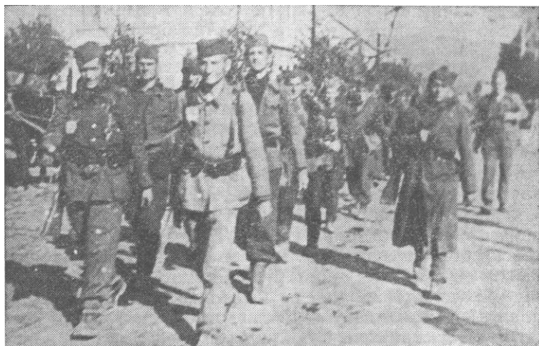
Бригада на маршу кроз Крагујевац крајем октобра 1944.

је сутрадан одмарала. 475^ Из рејона Сопота 14. бригада је кренула 26. октобра у 9.30 часова и преко Младеновца стигла у Тополу, где је преноћила (делом у селу Жабари). Сутрадан у 8.00 часова бригада је наставила покрет до Крагујевца и села Петровца, одакле је 29. октобра извршила покрет преко Крагујевца за Горњи Милановац и заноћила у Белом Пољу и Доњој Врбави, а сутрадан се пребацила у село Брћани где је остала у дивизијској резерви. 476^