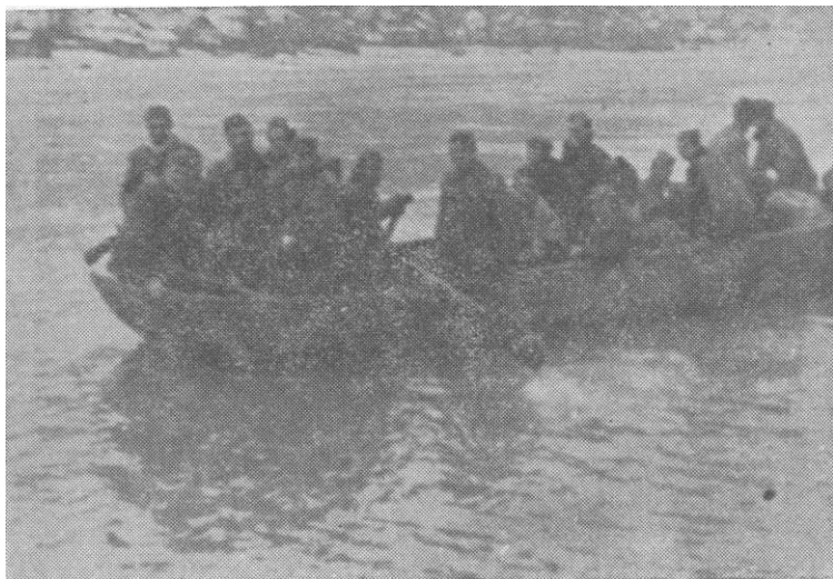
Прелаз преко Дрине код Зворника 22. децембра 1944.

Након заузимања Љубовије и пада мрака 1. батаљон је заноћио на положају село Читлук, 2. батаљон у рејону села Мичићи—Николићи и 3. батаљон на простору Љубовија—Извор—Владичица. Сви батаљони су одмах послали обезбеђења према комуникацији Љубовија—Мали Зворник, јер је још увек претила опасност од изненадног продора немачких јединица.