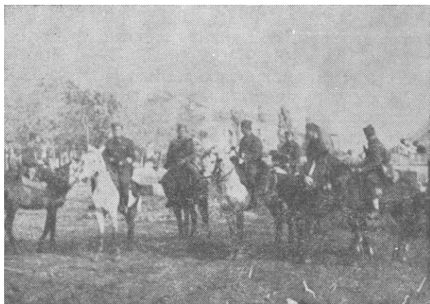
Штаб бригаде на маршу Београд—Чачак, у пратњи курира, октобра 1944.

ловачке дивизије, противтеиковски дивизион, батаљон пољске жандармерије, 1001. тврђавски батаљон, батаљон морнара и чета тенкова, обједињени под командом штаба 104. дивизије. 470^