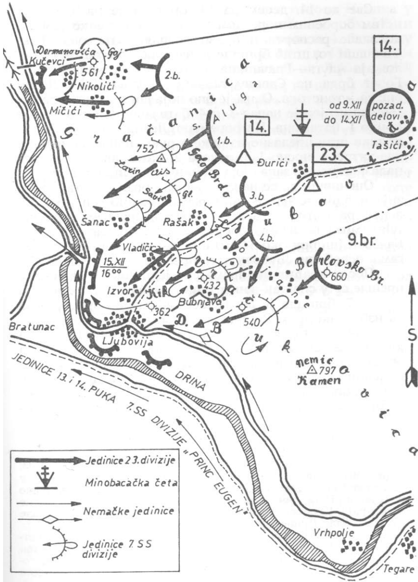
Борба за ослобођење Љубовије од 8. до 15. 12. 1944.