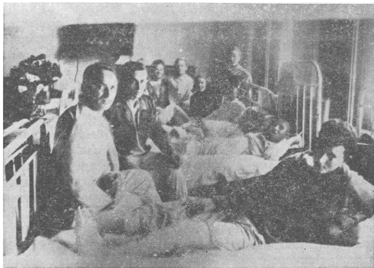
Рањеници из борбе код Лвале у болници, у Младеновцу, у другој половини октобра 1944.

жања, већу количину муниције и другог ратног материјала.