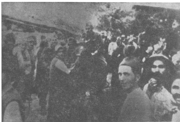
Трећи батаљон при ослобођењу села Палилула, сврглишки срез, септембра 1944.

жао отпор све до 9.00 часова 3. септембра, када се предао 2. чети. Том приликом су заробљена 54 бугарска окупаторска војника, док су четири погинула. Известан број је ипак успео да побегне, и то са дела пруге према Књажевцу. Тада су заплена три пушкомитраљеза »шарац«, око 45 пушака, 15.000-метака и друга војна опрема. Бугарским војницима су остављене личне ствари. За овај успех 3. батаљон је похваљен истог дана (2. септембра) од штаба 23. НОУ дивизије. 316)