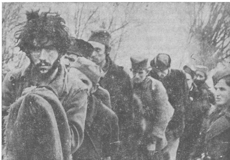
Заробљени четници Млавске и Хомољске бригаде 26. септембра 1944. у селу Сиге, хомољски срез

часова, пошто је блокада извршена, 3. батаљон је извршио препад на четнике у школи и општини и позвао их да положе оружје. Тог момента су и две чете 4. батаљона притекле у помоћ. Четници су отворили ватру и одмах се повукли на таване зграда и са крова почели да бацају бомбе, док је један део скакао кроз прозоре и бежао кроз мрак при чему их је 15 погинуло. Мобилисано људство у четничким редовима је одмах прихватило позив и кроз прозоре бацало оружје, молећи да се не пуца на њих. Тако се око 170 четника одмах предало, док је око 50 четника, са својим командантима који су се налазили ван ових зграда, успело да побегне.