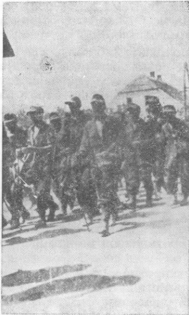
Група заробљених Немаца у Зајечару 7. септембра 1944. *

уз Црни Тимок пробије ка Звездану. Око 180 људи пошло је путем између Лојза и Бачишта на позадинске делове 14. бригаде (болница са рањеницима, интендантура и други приштапски делови). Део штаба бригаде, који се тог тренутка затекао у рејону Бачишта и руководио борбом против четника, хитно се пребацио у рејон Лојза и са комесаром бригаде и целокупним људством (куварима, болничарима и лакшим рањеницима) сачекао ову колону у заседи и на њу отворио митраљеску и пушчану ватру.