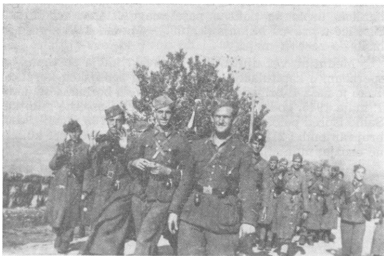
Druga četa 4. bataljona 1.(7) banijske brigade »Vasilj Gaćeša« na maršu od Ilirske Bistrice za Rijeku, maja 1945. godine

Za izvršavanje ovog naređenja, među ostalim jedinicama, našle su se i bandjske brigade u sastavu 7. banijske divizije. Međutim, neprijatelj se brzo povlačio i, umjesto borbi u dolini Save i na komunikacijama Zagreb—Ljubljana—Jesenice, 7. banijska divizija prolazi paradišnim mar-