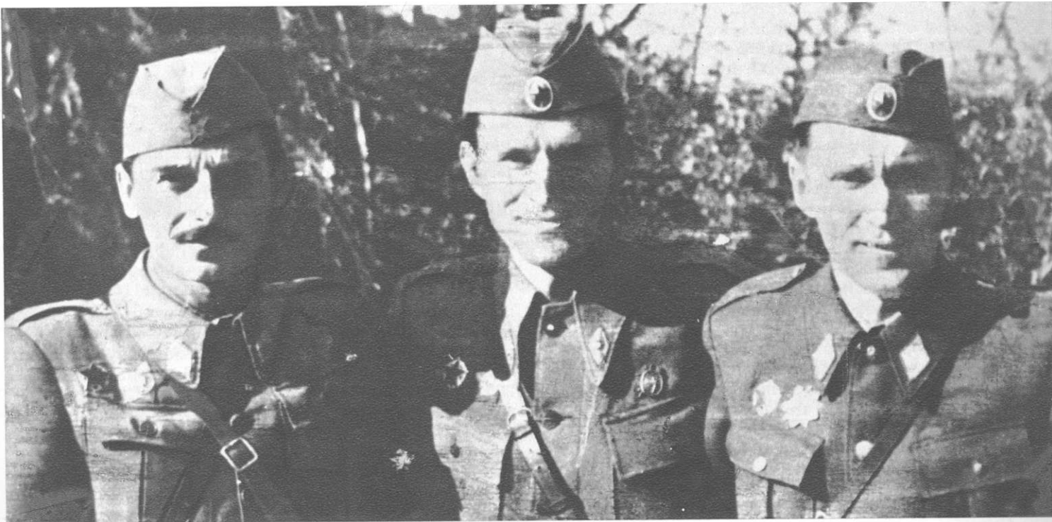
Три команданта армија НОВЈ (слева надесно): Командант 2. армије генерал-лајтнант Коча Поповић, командант 1. армије генерал-лајтнант Пеко Дапчевић, и командант 3. армије генерал-лајтнант Коста Нађ

Факсимил наредбе врховног команданта НОВ и ПОЈ маршала Тита о формирању 3. армије НОВЈ