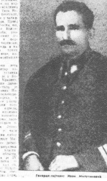
Генерал-пушњак Иван Милутиновић

Иван Милутиновић је био члан Војвођеног штаба НОВ и ПОЈ. Он је био члан КПЈ од 1928. године. Он је учествовао у борбама против фашизма и окупације Југославије. Он је био члан Војвођеног штаба НОВ и ПОЈ.