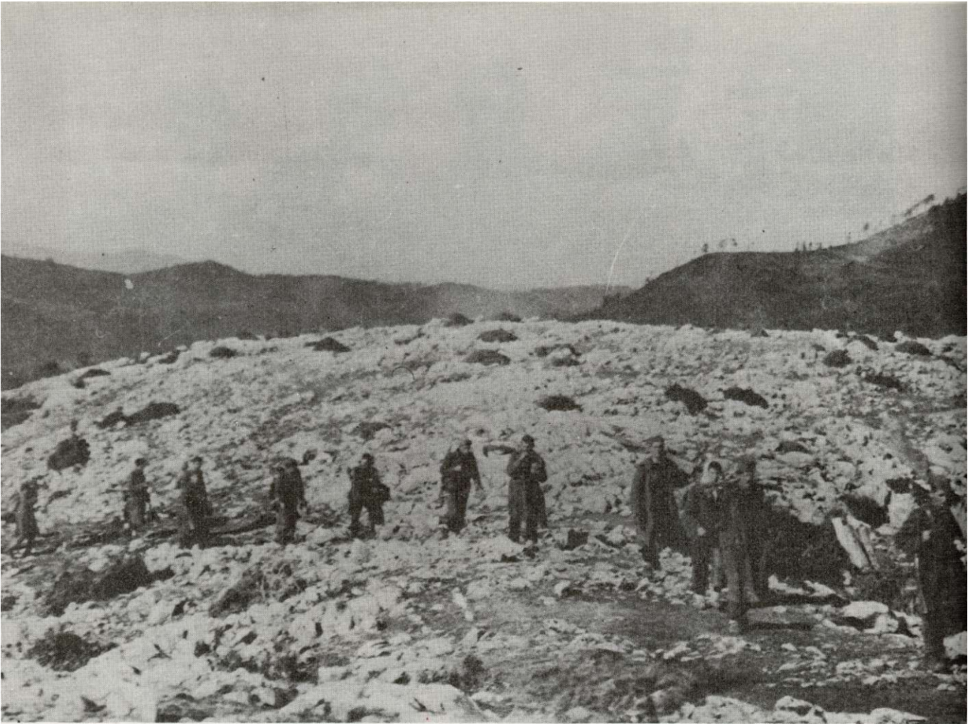
Marševska kolona boraca na putu za Kalinovik, koji je oslobođen 18. oktobra 1943. godine.