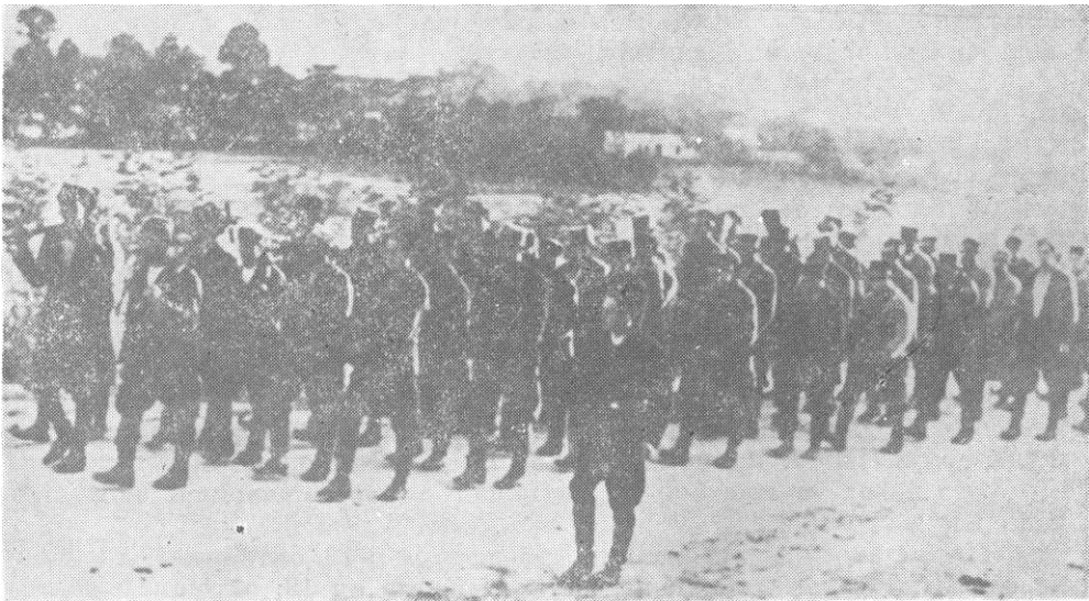
Борци Трнавског батаљона одлазе на лоложај код Краљева

У припремном периоду генерал Беме је сталним офанзивним дејствима својих јединица, уз обилну помоћ и сарадњу домаћих издајничких војних и полицијских формација, нарочито четника, успио да веже знатан број партизанских снага и тиме да осујети нове офанзивне