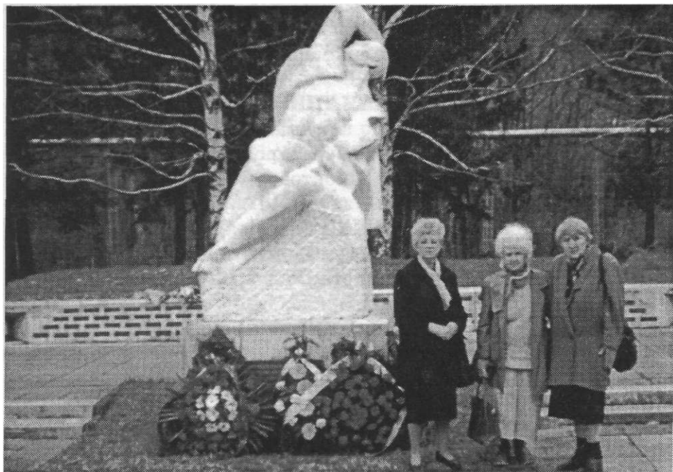
Костурница стрељаних Милановчана у Собанти