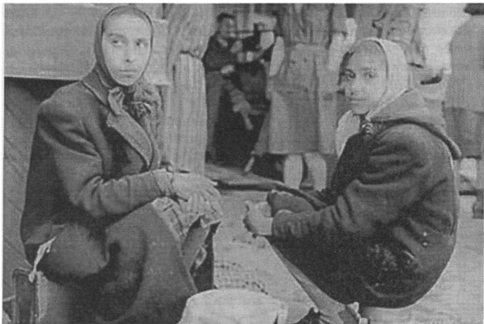
Жене у логору

Овакво убеђење начелство је стекло упознавањем рада именованих за време комунистичке акције коју су у свестрано помагали за све време њеног трајања". 51 Од ове Групе бораца стрељани су 41, десеторица су пуштени кућама, али су одмах неки били ликвидирани од четничких тројки, а неки ухваћени и послати у Бањички логор. Од целе те Групе рат је преживело само пет бораца. У Групи је било 10 чланова КПЈ, који су били утицајни у организацији устанка и у рукама партизанских одреда.