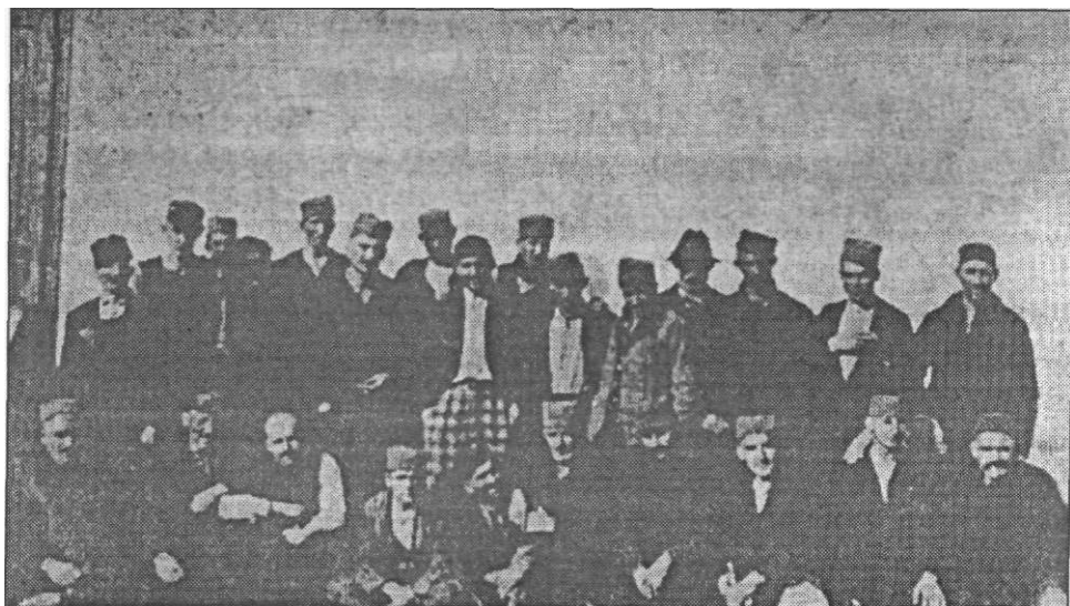
Припадници партизанског покрета из таковског краја у логору Крагујевац