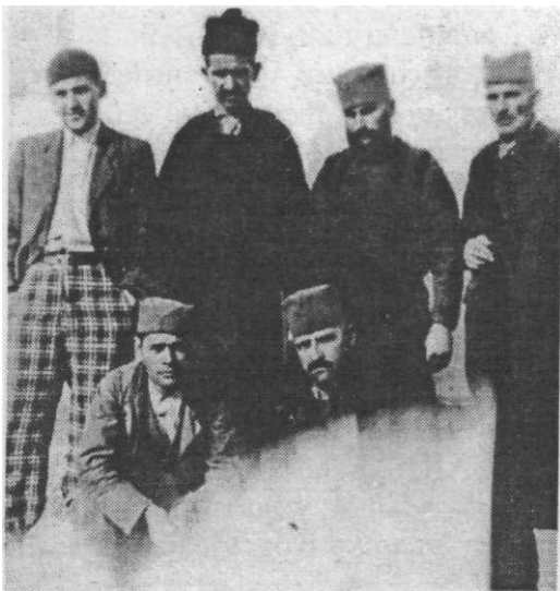
Група Таковаца у логору у Крагујевцу 1942. године

Поред цивила, усмрћено и стрељано је 66 бораца НОР-а,