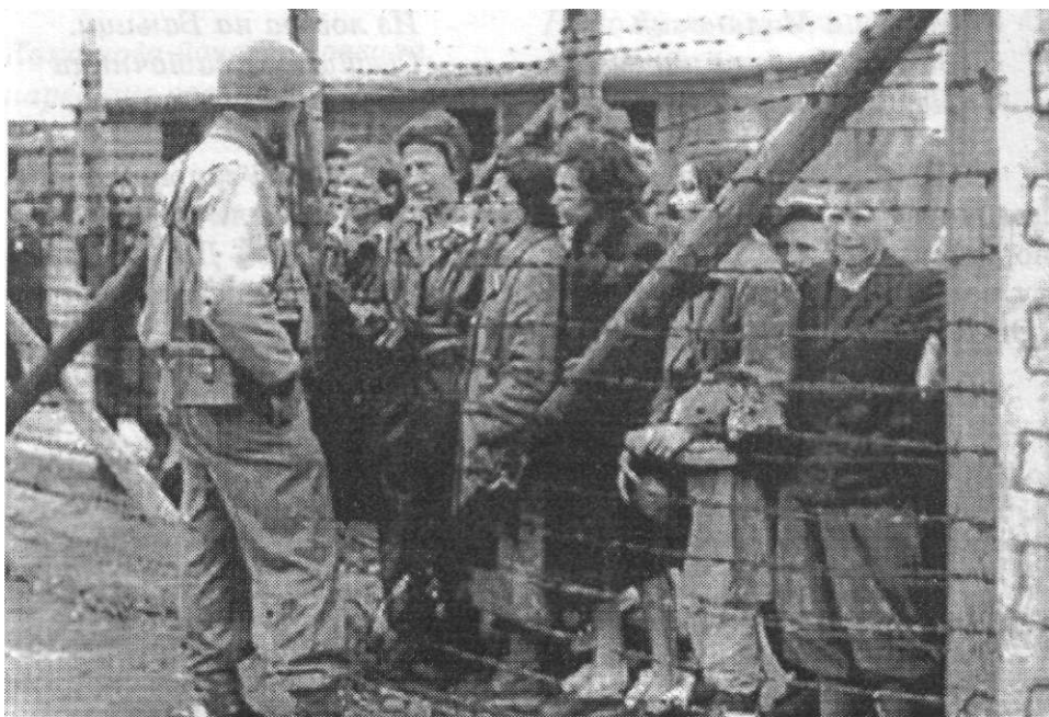
Сужњи су били деца и жене