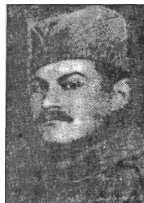
Херој на вешалима