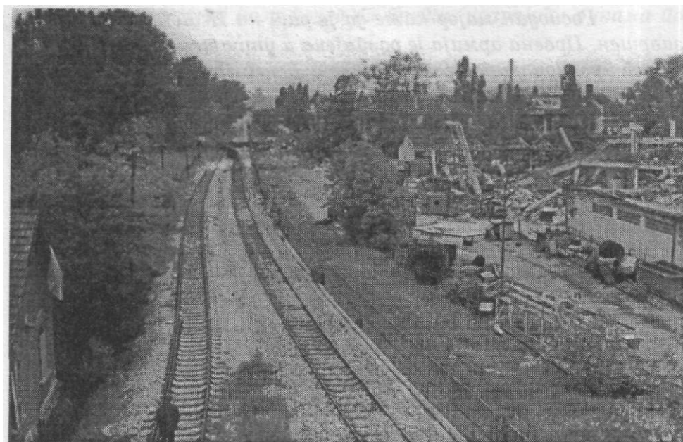
У НАТО бомбардовању 1999. године срушени су објекти „Цера у којима је у децембру 1941. и јануару 1942. био логор

Немци су поново заурлали, ударци кундака су падали по телима наших другова, али песма је од свега била јача: