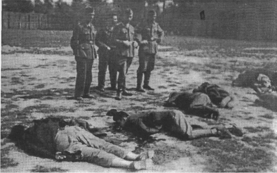
Стрељање комуниста и родољуба у Чачку

предали Немцима, који су их стрељали. Према томе, њихови злочини, као и злочини четника, у великој мери су приписани Немцима или Бугарима, јер су они били помагачи, па њихова одговорност треба да буде подељена.