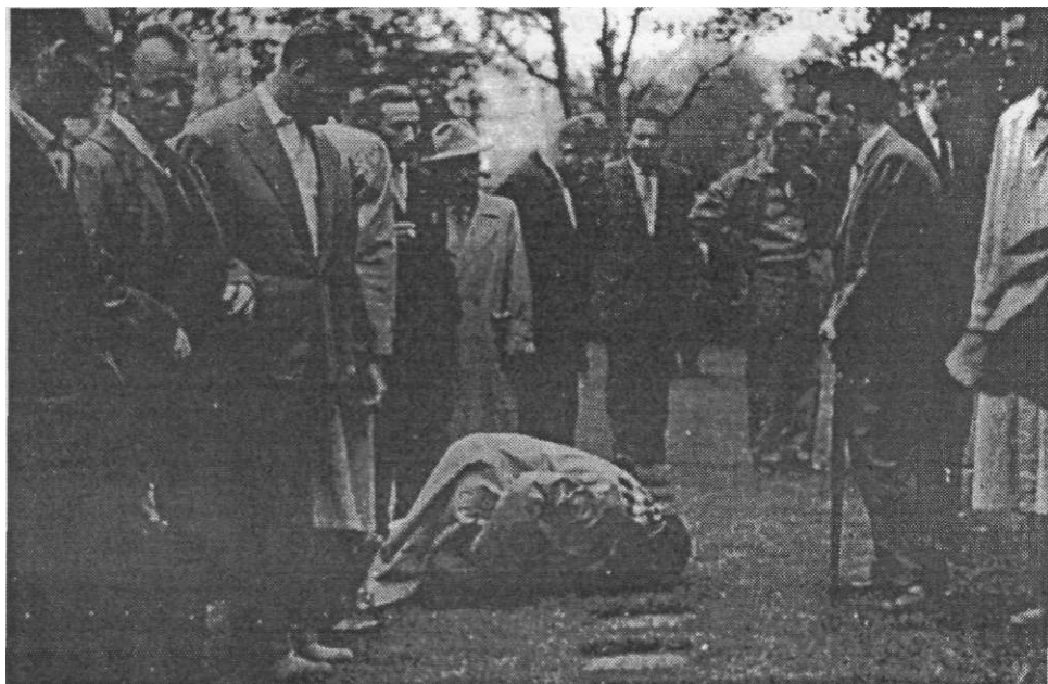
Над гробом свога оца. На спомен гробљу у Мухолту. Снимак: 1974.

А патроле су га и даље вијале просторима области Ране. 79