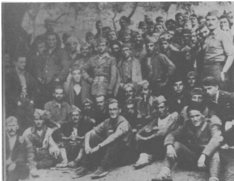
Grupa talijanskih vojnika s borcima 2. dalmatinske brigade u selu Trebaljevo kod Kolašina, 3. oktobra 1943.

Brigadne bolnice 4. proleterske i 2. dalmatinske brigade trebale su se smjestiti u neposrednoj blizini Kolašina.