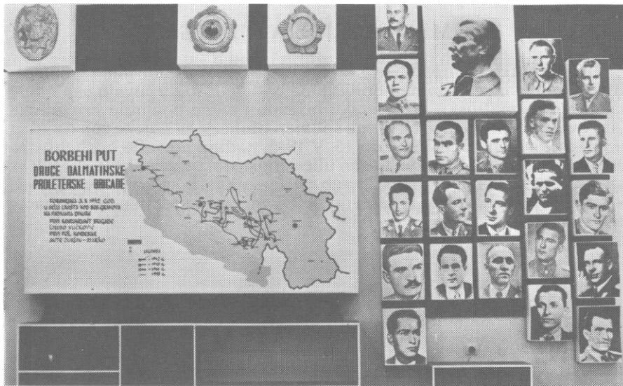
Pano koji se nalazi u Spomen-domu prikazuje borbeni put brigade, narodne heroje i odličja brigade

tinske brigade, na inicijativu i udarničko pregalaštvo njenih preživjelih boraca, sagrađen je Spomen-dom. Lijepa građevina - kombinacija fino klelanog kamena i cementa, čiji se pokrov od crijepa doima kao jarko crvena ruža procvjetala u kamenjaru, ima višestruko značenje i simboliku. Malo zabačeno selo dobilo je reprezentativne prostorije u kojima su našle svoj kutak za djelovanje i okupljanje mjesne društveno-političke organizacije, brojni izletnici, planinari, lovci i ini posjetioči. Centralno mjesto Doma je spomen-soba s autentičnim fotosima i grafikonima koji govore o ratnom putu brigade. Pored toga Dom raspolaže s 18 kreveta, ima biblioteku, blagovaonicu i čajnu kuhinju.