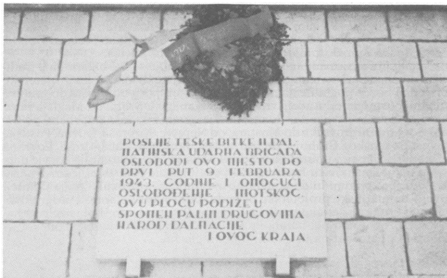
Spomen-ploča na zgradi Skupštine općine Posušje

Spomen-ploča na zgradi Opštinske skupštine u Posušju govori o zajedničkom jurišu boraca Druge dalmatinske i Četvrte crnogorske brigade kada su veljače 1943. oslobodili taj grad.