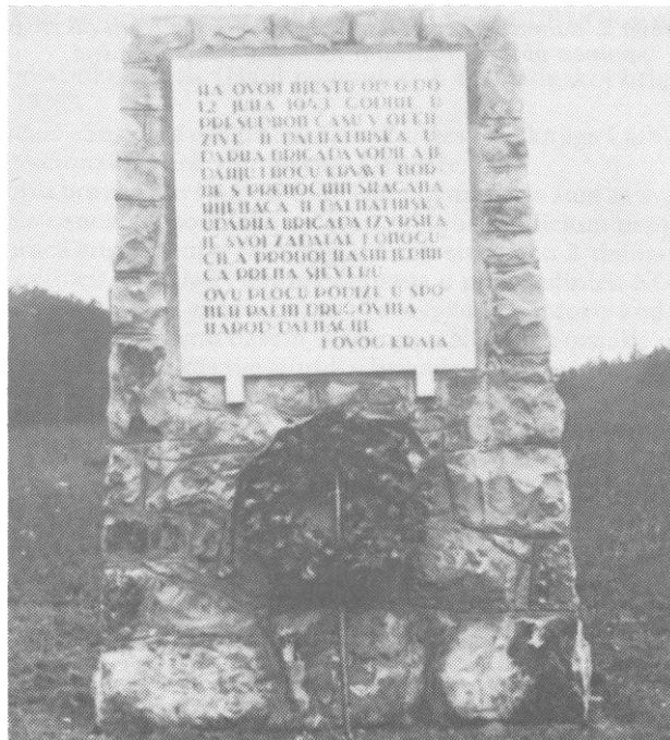
Spomen-ploča na Donjim Barama, Sutjeska

Spomen-ploča u Foči u počast borcima koji su izgubili život u virovima Drine, ožujka 1943. godine