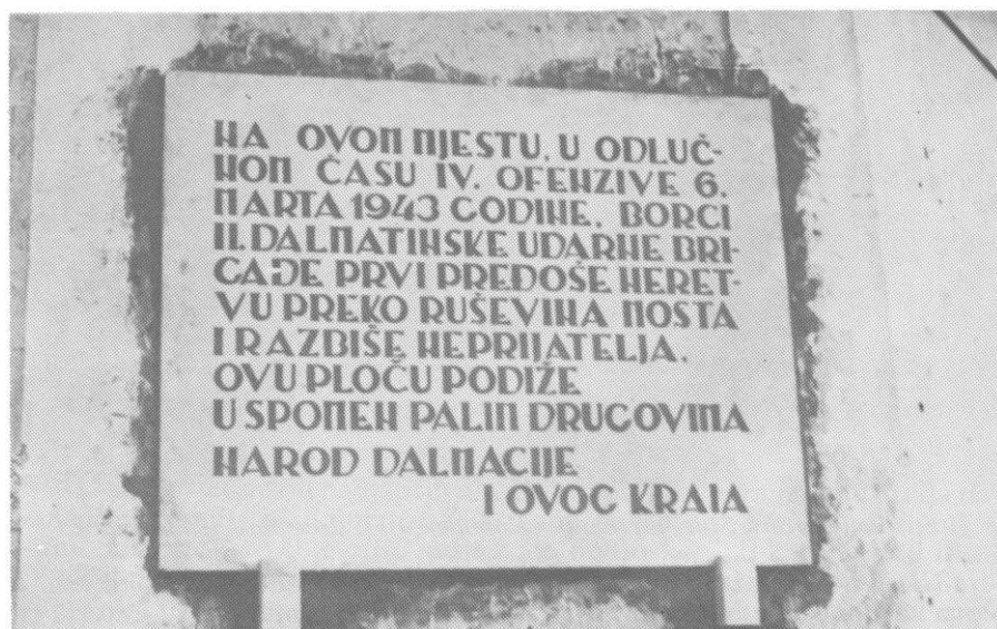
Spomen-ploča u Jablanici o prelasku 2. dalmatinske brigade preko Neretve