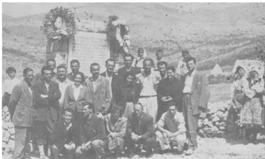
Grupa boraca ispred spomen-ploče u Uništima 1962. godine