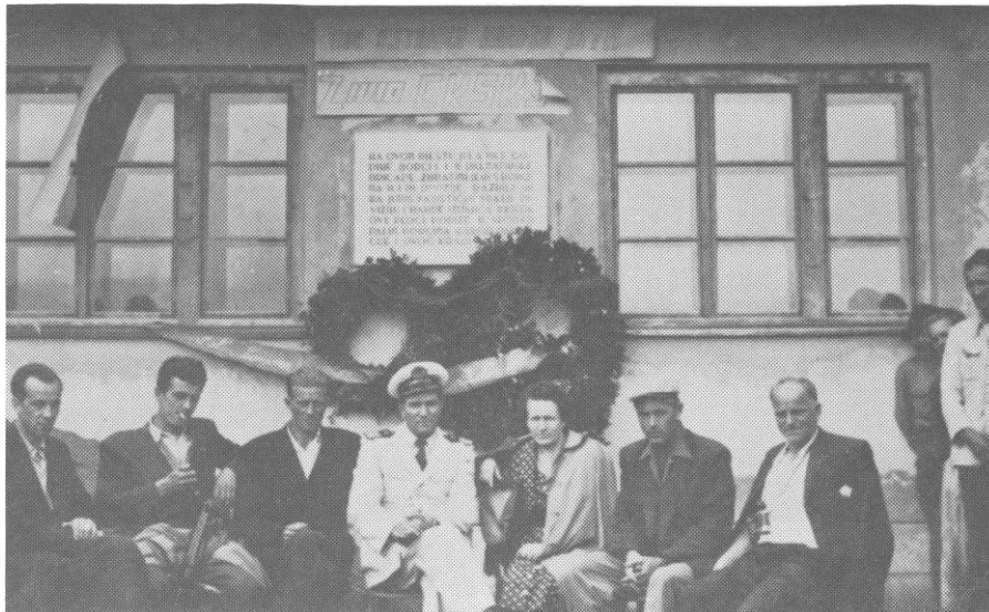
Delegacija 2. dalmatinske proleterske brigade prilikom otkrivanja spomen-ploče u Pašinom Konaku, istočna Bosna

Na putu od Glavatičeva ka Kalinoviku spomen-ploča kaže da su ovaj kraj po prvi put krajem ožujka 1943. oslobodili borci Druge dalmatinske brigade do nogu razbivši četničke jedinice. To je spomen-obilježje na dvadesetak poginulih boraca Druge dalmatinske brigade.