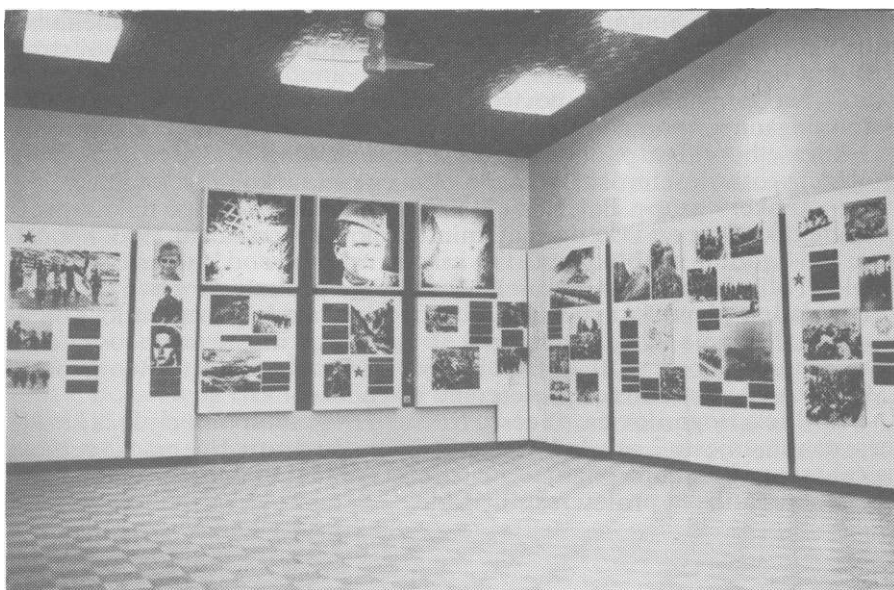
Spomen-sala u Domu 2. proleterske brigade u Uništima