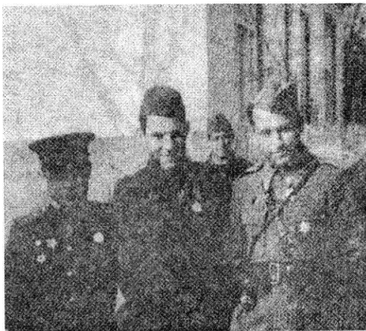
Штаб 2. дивизије са официром Црвене армије