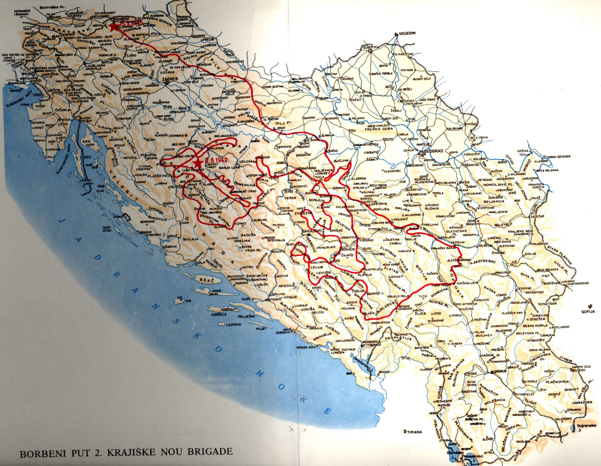
BORBENI PUT 2. KRAJIŠKE NOU BRIGADE