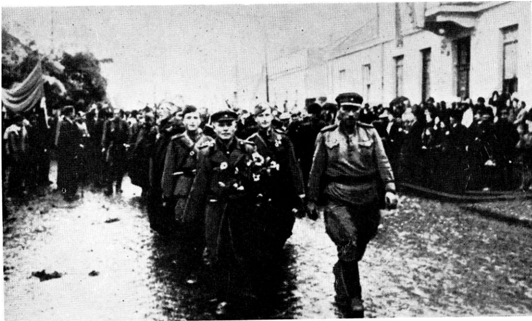
Јединице Црвене армије и НОВ улазе у Параћин 13. октобра 1944. године