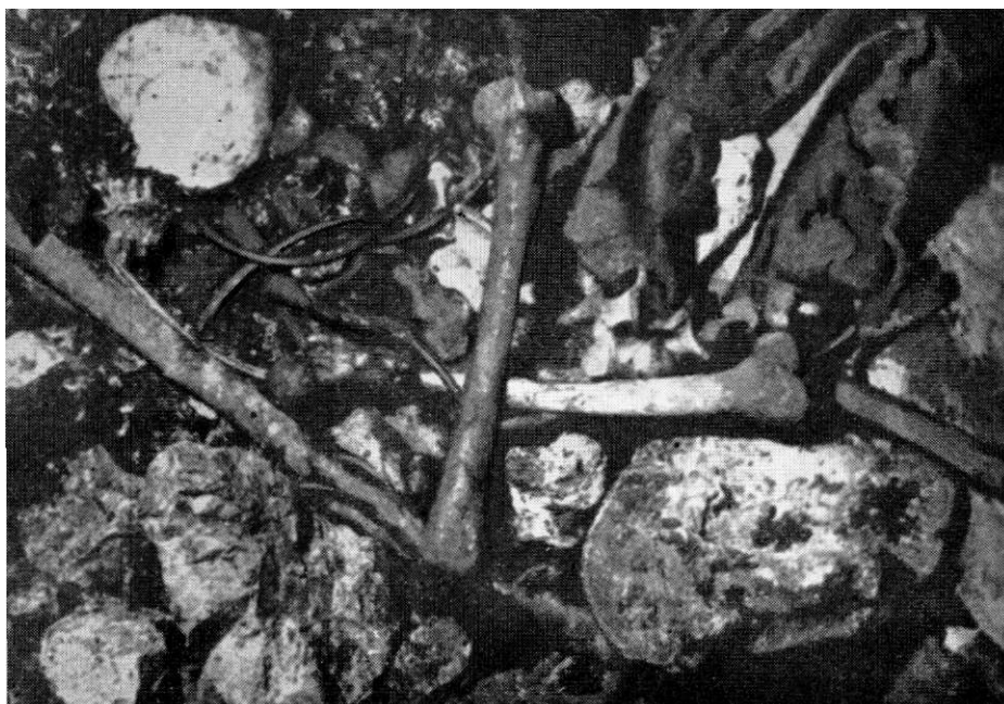
Детаљ са дна „Мијајлове јаме“