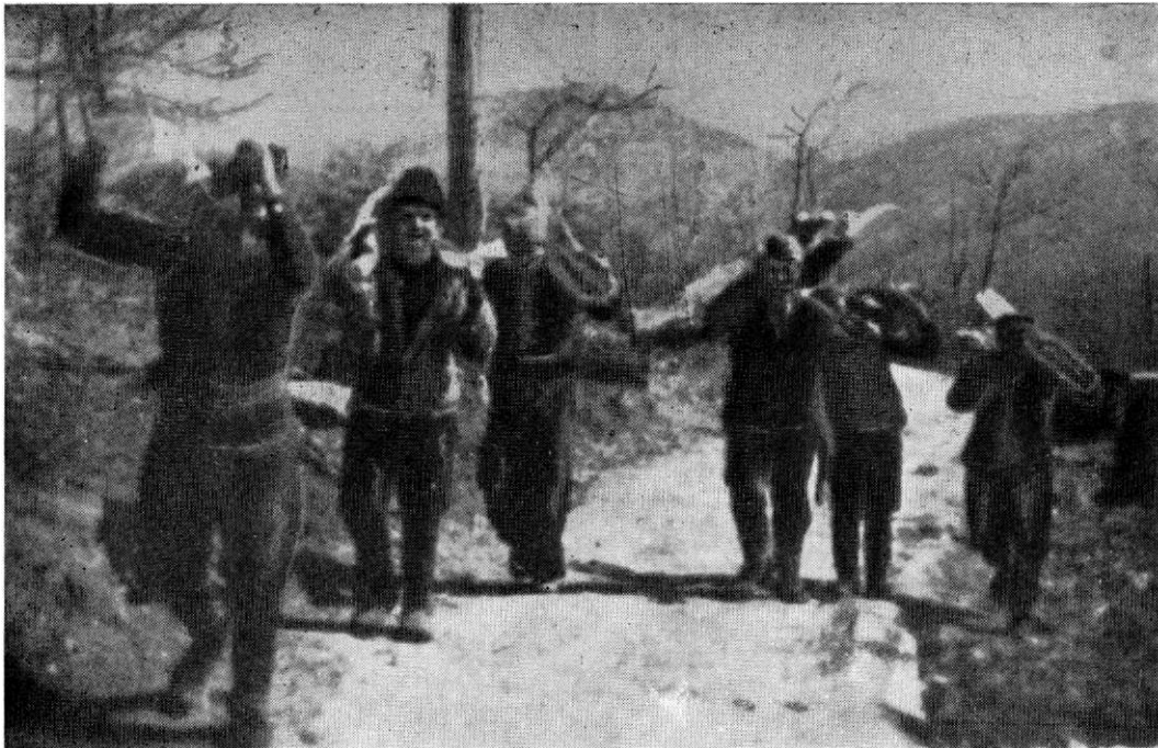
Радна акција омладине Моравске бригаде на Црном врху 1945. године