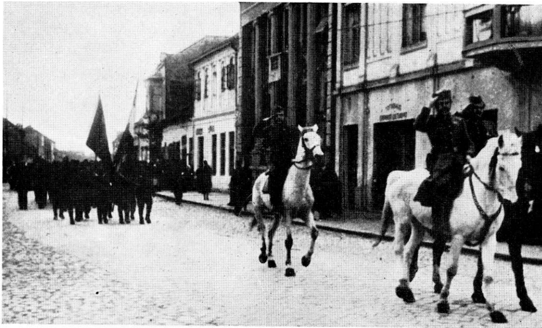
Дефиле инжењеријске бригаде ЈНА 9. маја 1945. године у Параћину