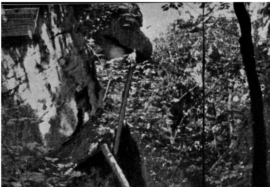
„Мијајлова јама“ — у равничком срезу у коју су четници ДМ бацали велики број својих жртава