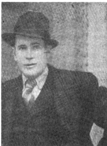
Синадин Миленођић, народни херој, заменик команданта Друго! јужномораћској одреда, пошнуо 14. октобра 1943. Јодине код с. Радосина.