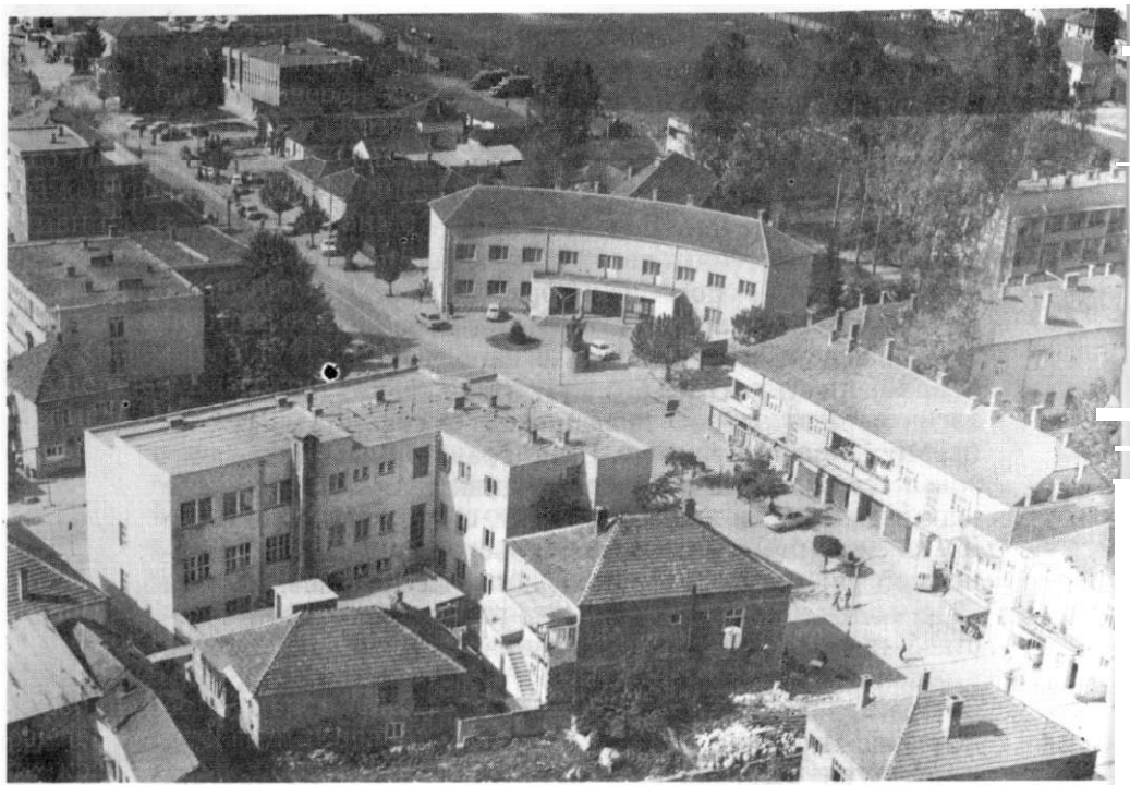
Бабуиница - општински центар Лужнице, снимак из 1982. године.

тулација. 19) Тако је завршила најсрамнија страница историје краљевине Југославије и њене војске.