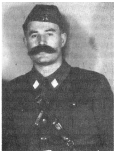
Николић Жикојин - Брка, народни херој.