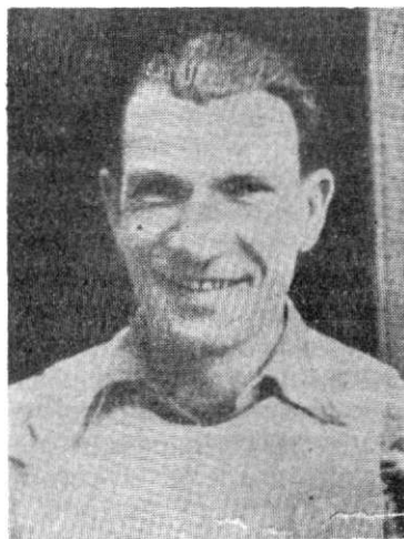
Милорад Диманић - Милош, народни херој, начелник шшаба Се-дме бришаде.