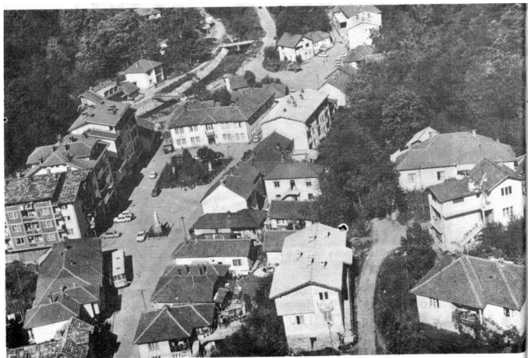
Црна Трака - снимак из каздуха 1982. јодине.