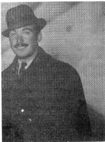
Мирко Соширођић - Сошир, народни херој.