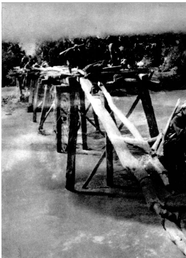
Прва чета Тамнавског батаљона прелази реку Пештан између Бргула и Дражевца при поласку на положа Барич — Дубока, септембар 1941. године