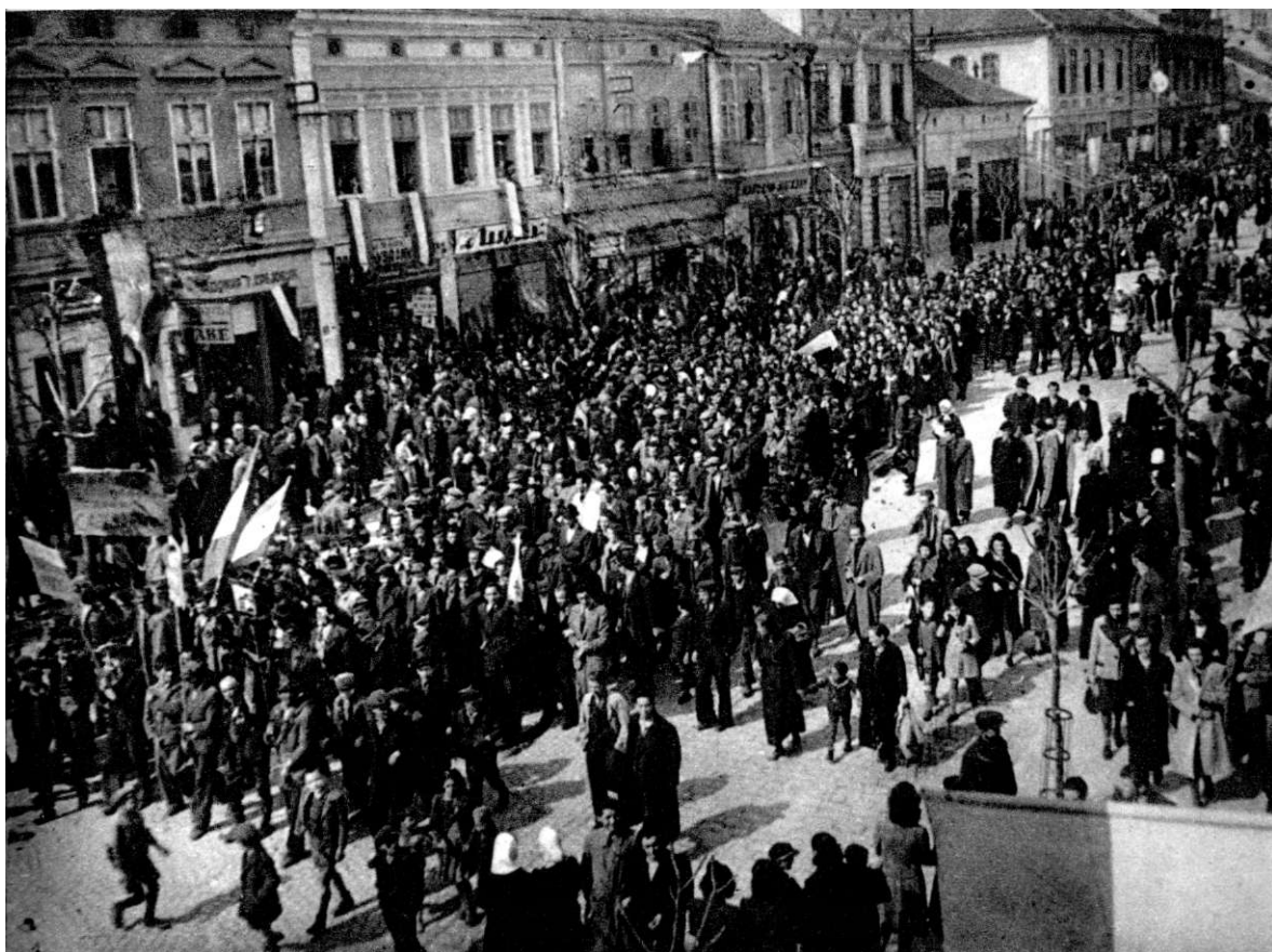
27. март 1941. године у Крагујевцу