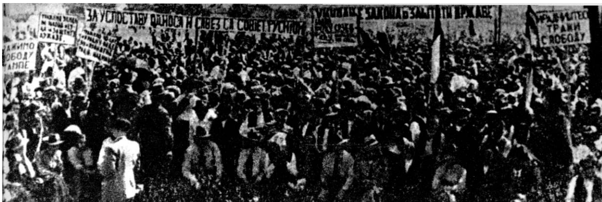
3500 у Крагујевцу, 25. август 1935. год.