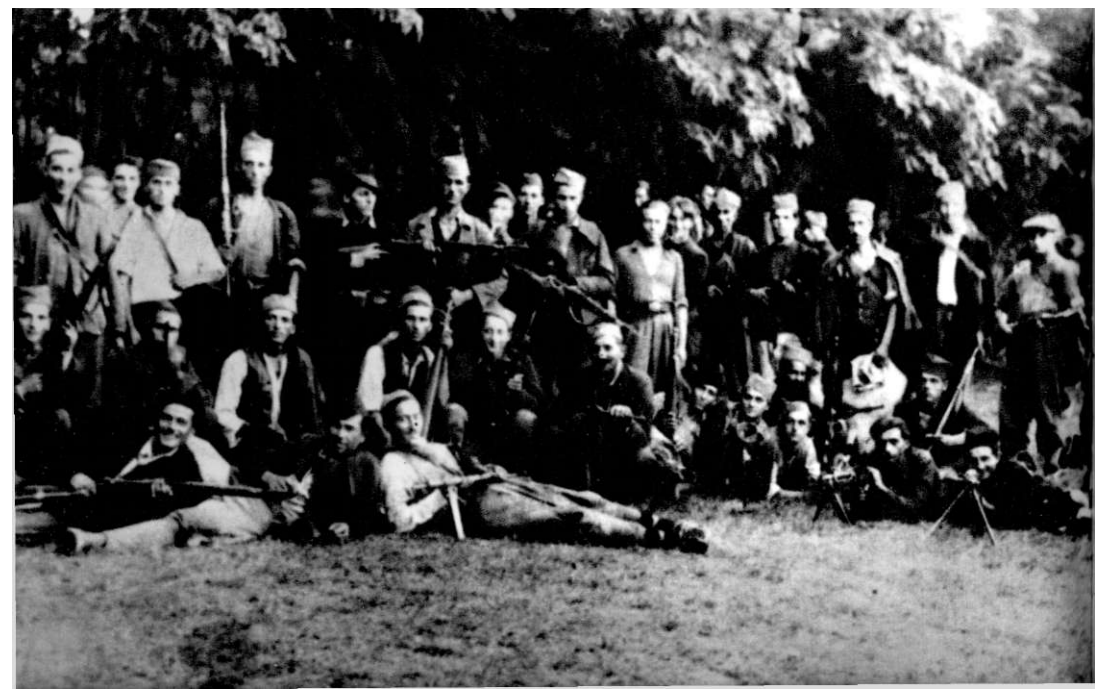
Други батаљон КосмаЈОКОг партизанског одреда у Друговцу јул 1944. године I