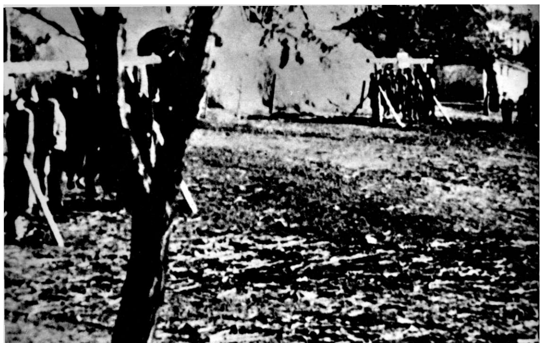
| Вешање у Аранђеловцу, 26. новембар 1943. године