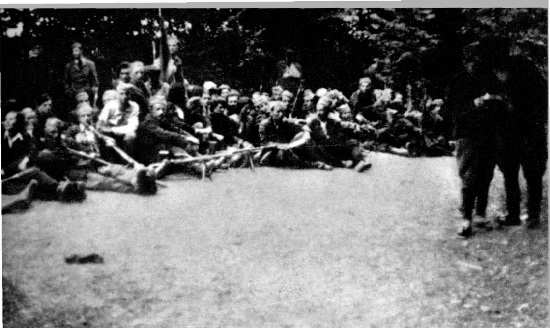
Прва шумадијска бригада на пл. Руднику, 5. октобар 1943. год.

Штала Милијановића у селу Дучини изгорела са штабом Авалског четничког корпуса приликом напада Прве шумадијске бригаде НОВ, Комајског, Првог шумадијског одреда и Сремског батаљона. октобар 1943. године