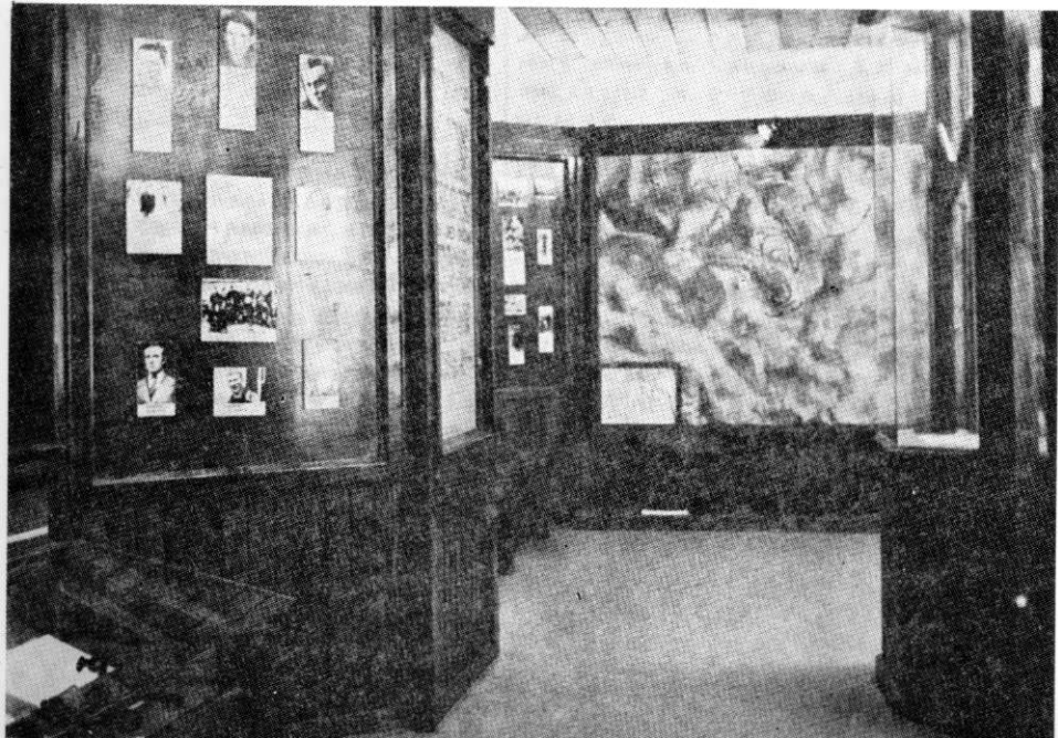
Детаљ из спомен собе 4. санџачке НОУ бригаде