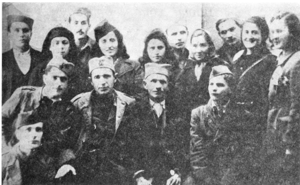
Делегација општине Прибој на дан формирања 4. бригаде 1. децембра 1945. год. у Пљевљама

морати и даље да остане у одреду. Настало је међусобно договарање бораца и незванични захтеви од руководилаца за одлазак у бригаду. Скоро нико није желео да остане у одреду.